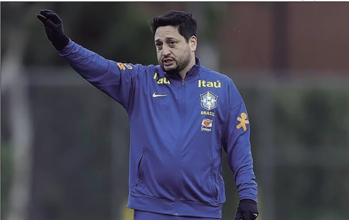
Seleção venceu na estreia, mas Arthur Elias e jogadoras admitem falhas