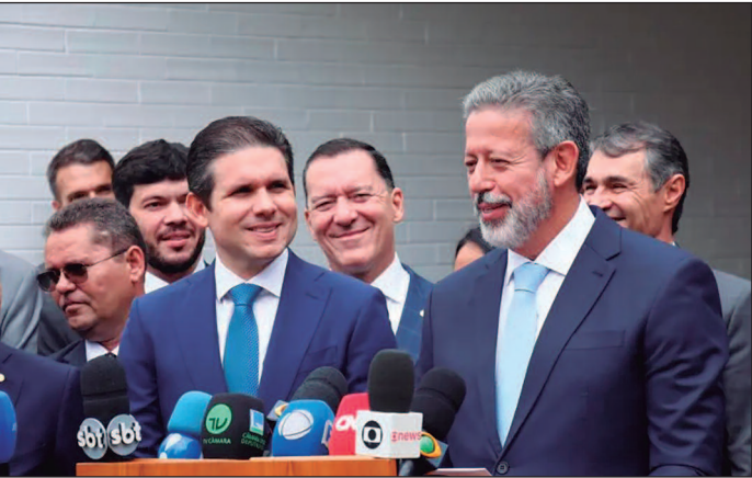
Relatório é votado em comissão especial nesta quarta; sessão no plenário será só após o recesso