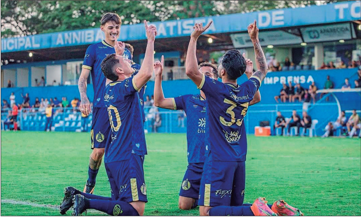
Com 12 jogos disputados, Camaleão soma 28 pontos na Série D tem 9 vitórias, 1 empate e 2 derrotas