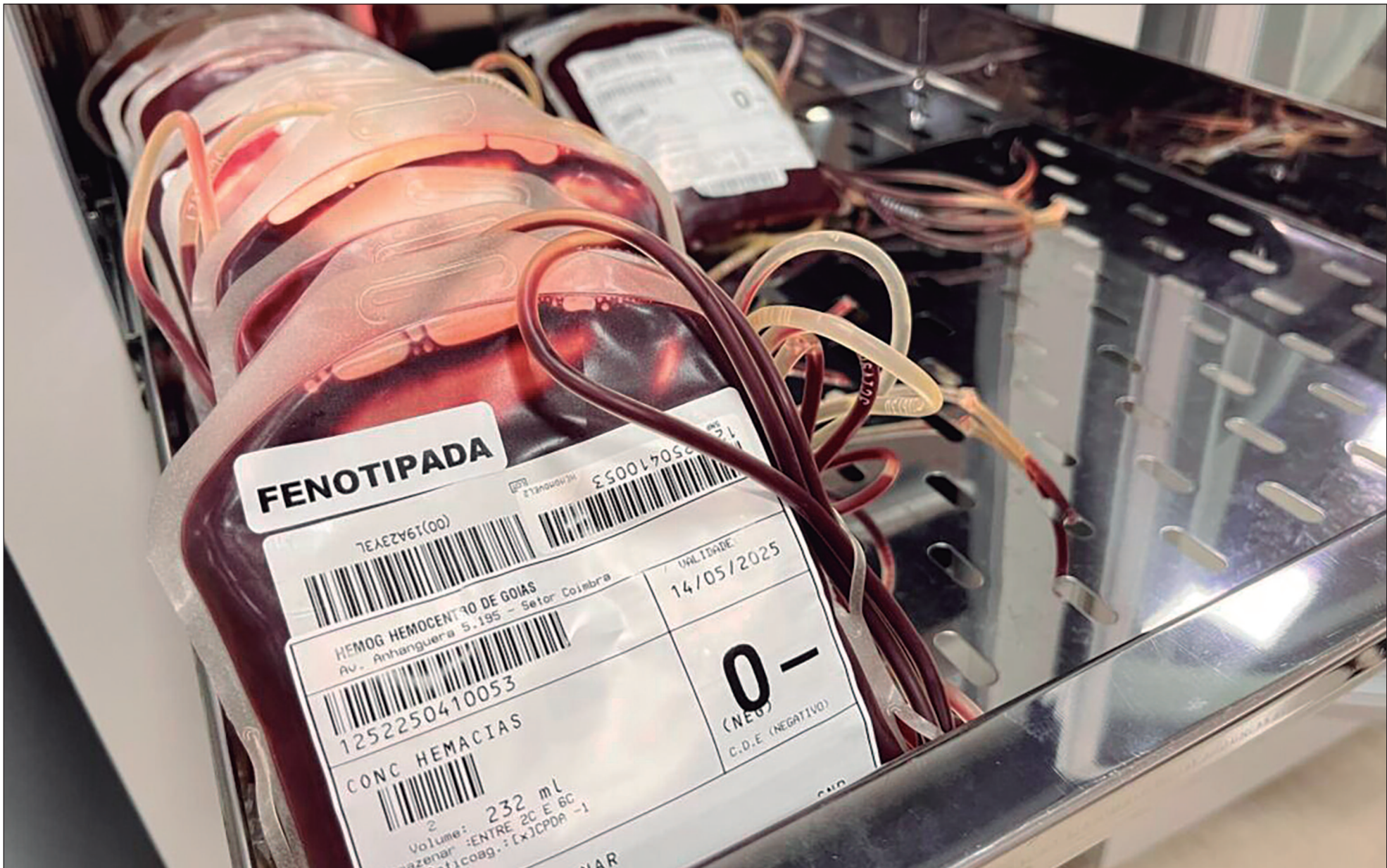
O déficit desse tipo sanguíneo tem impactado diretamente o funcionamento das 223 unidades