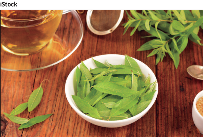
Estudos apontam a proteção de células pancreáticas