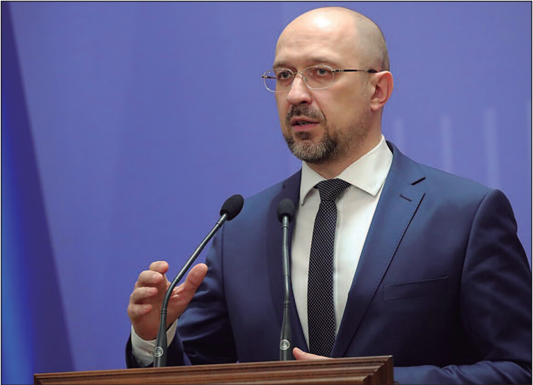
Yulia Svyrydenko é escolhida para assumir o cargo de primeira-ministra no lugar de Denys Shmyhal

Zelensky anunciou também a intenção de nomear Shmyhal para o Ministério da Defesa. “A experiência colossal de Denys Shmyhal será definitiva-