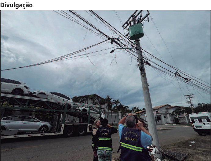
Fios soltos ou mal fixados são alvo de operação que busca reduzir riscos à população e à estética da cidade