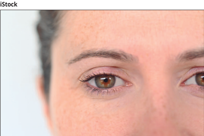
A manifestação mais comum é a chamada heterocromia parcial