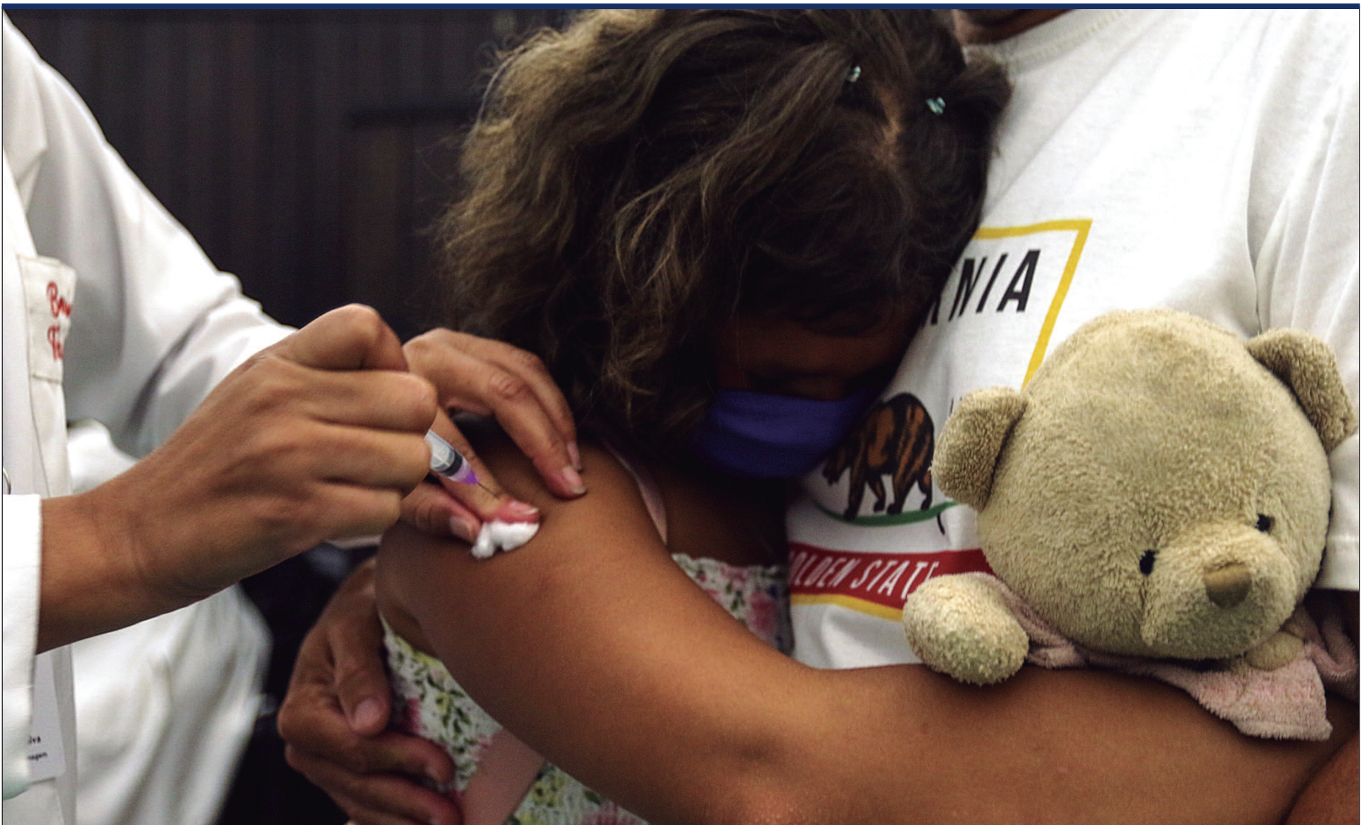
Depois de sair da lista em 2022, Brasil volta a figurar entre os 20 países com mais crianças sem a DTP1, imunizante básico da infância