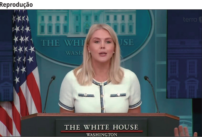
Reprodução Porta-voz do governo diz que Trump é “líder do mundo livre”