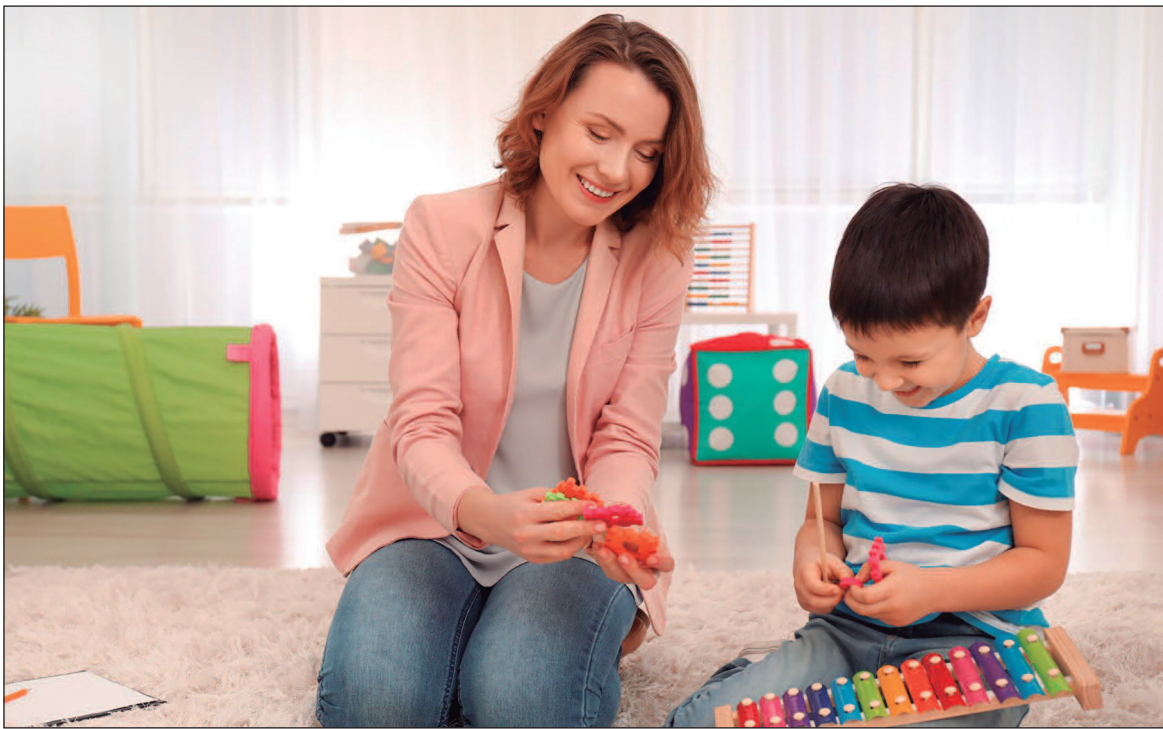
A data reforça a importância da primeira infância no processo de desenvolvimento e aprendizagem

Nos últimos anos, as políticas públicas brasileiras avançaram em relação ao direito de estudantes com deficiência.