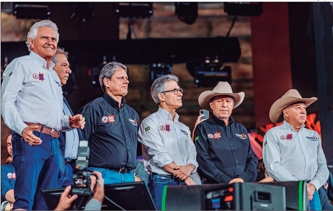
Ronaldo Caiado, Tarcísio de Freitas e Romeu Zema começaram a adotar discursos complementares