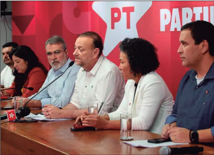
PT denuncia “guerra híbrida” e ofensiva digital e comercial