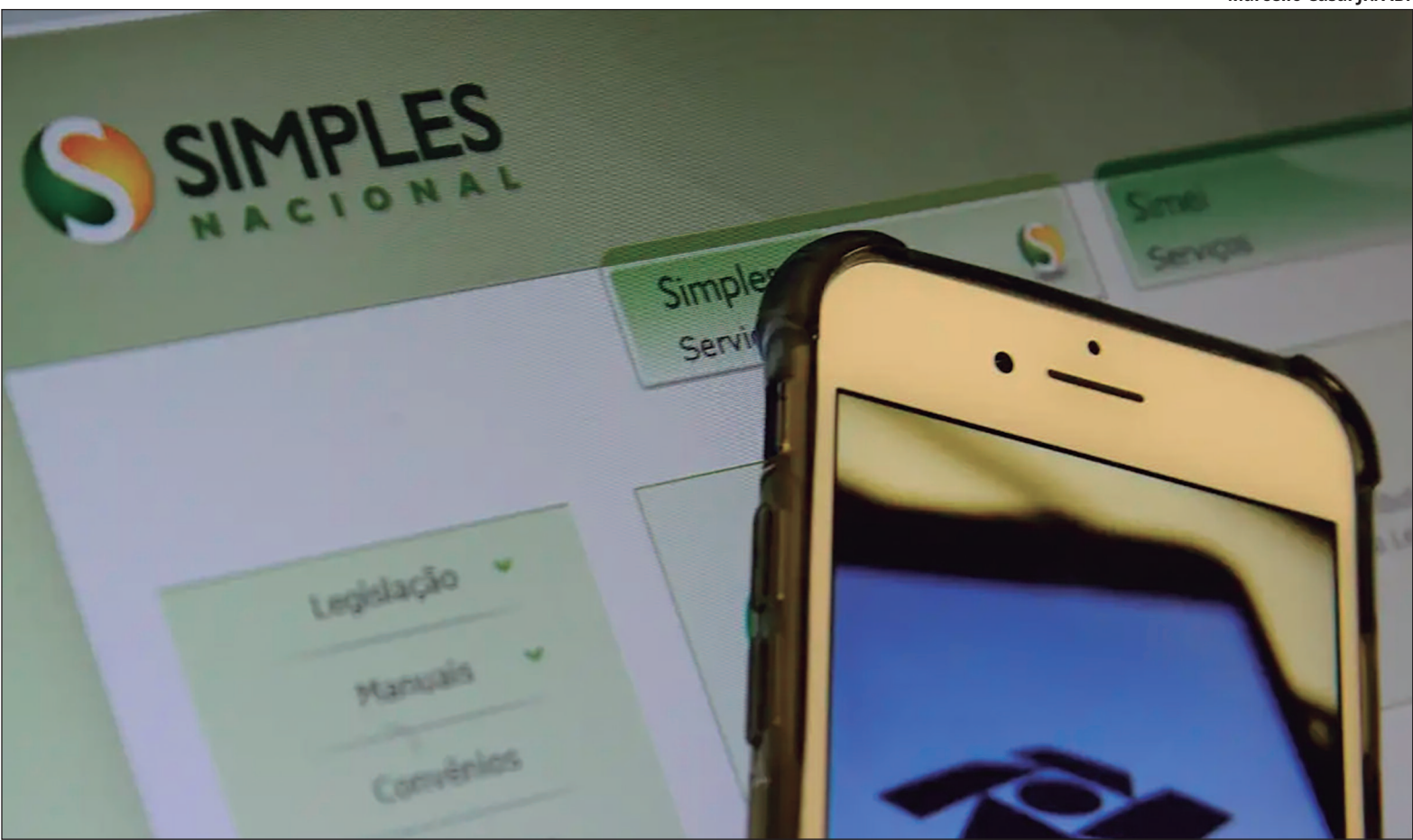
Marcello Casal Jr./ABr