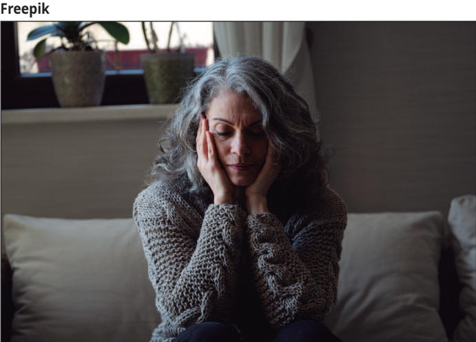
Terapia proporciona maior proteção vascular e óssea, além de reduzir as chances de efeitos adversos em tratamentos tardios