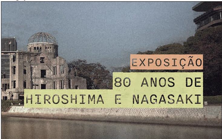
Mostra apresenta coleções de painéis informativos com os roteiros históricos da tragédia nuclear e os estragos causados

roviária de Bonfinópolis. A montagem é fruto da parceria entre três grupos potiguaros — Clowns de Shakespeare, Grupo Facetas e Grupo Asa-vessa — e apresenta uma sátira política cômica e grotesca inspirada no clássico Ubu Rei, de Alfred Jarry. O projeto conta com realização do Ministério da Cultura e patrocínio da Transpetro, por meio da Lei Rouanet, e faz parte de um circuito que percorre diferentes estados brasileiros com apresentações gratuitas, acessíveis e abertas ao público. Quando: segunda-feira (25). Onde: Estação Ferroviária de Bonfinópolis. Horário: 19h. Entrada: gratuita, com acessibilidade em Libras, audio-