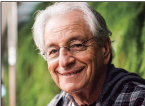
Fernando Gabeira é escritor, jornalista e ex-deputado federal pelo Rio de Janeiro

O jornalismo explora muito as tensões. Temo estar me transformando num antijornalista porque, na maioria dos casos, vejo crises cheias de som e fúria significando nada. Estou pronto para iniciar um novo gênero: o Correio Zen, órgão destinado a mostrar que, na maior parte das vezes, é melhor não se deixar levar pela confusão das redes e pelas bravatas dos políticos. Preciso apenas de um patrocinador que aceite perder dinheiro com serenidade.