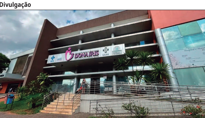
Maternidades passam a ser geridas por Organizações Sociais