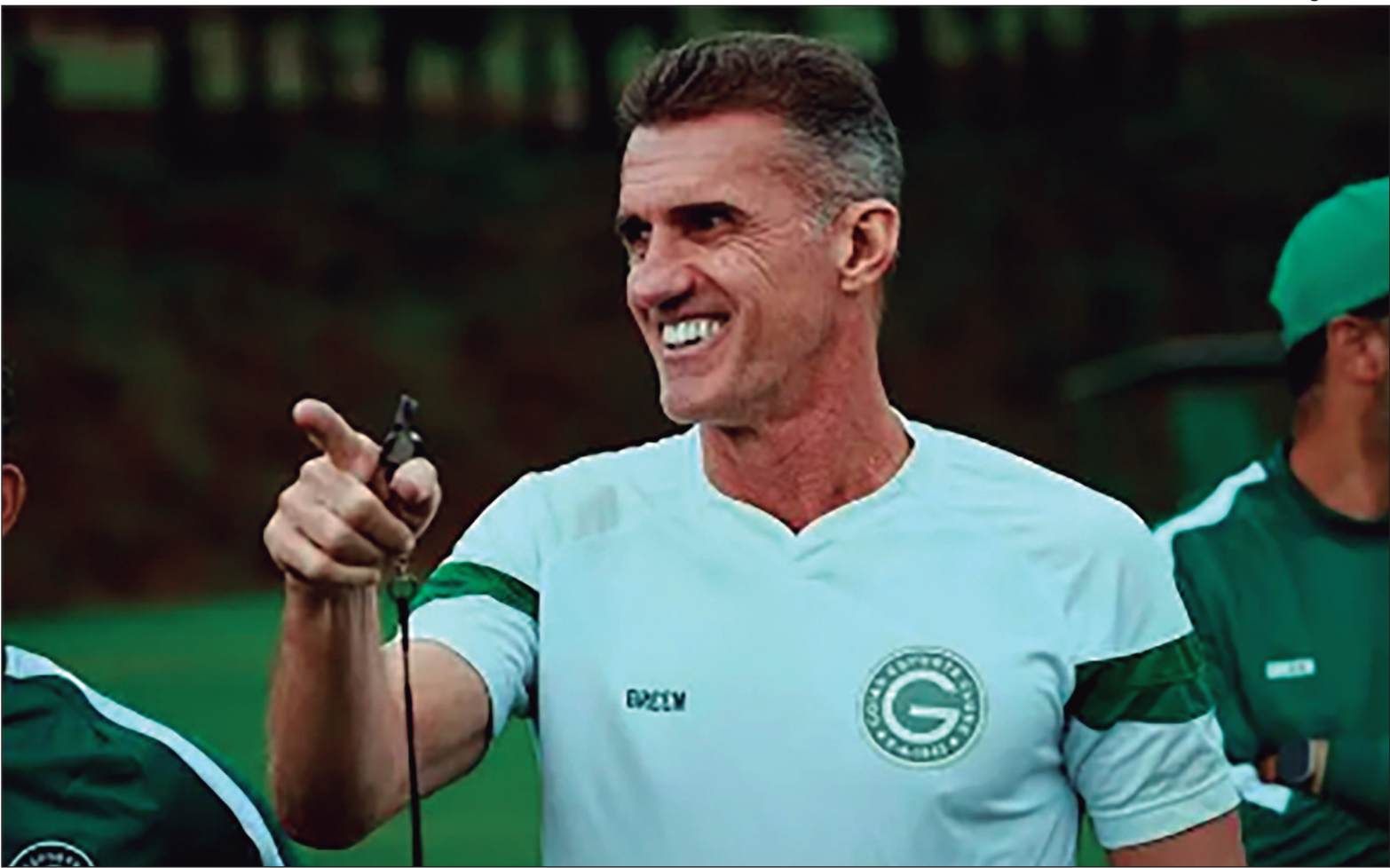
O nome do treinador foi especulado no Vitória, que demitiu Fábio Carille após a goleada histórica de 8 a 0 para o Flamengo

Apesar de reconhecer sua ligação com o clube baiano, onde soma quatro passagens e 197 jogos à frente da equipe, sendo o treinador com mais jogos na história do clube no Campeonato Brasileiro, Mancini destacou que a valorização do trabalho realizado no dia a dia no Goiás foi determinante para sua decisão.