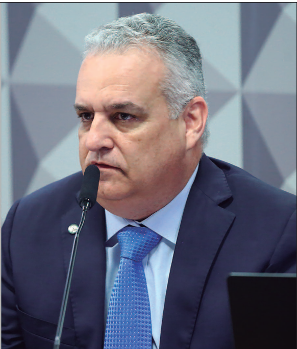
Aliados do governo, como Omar Aziz, ficaram de fora. Enquanto isso, Alfredo Gaspar foi eleito relator

geu presidente. Não procurem terceiros para responsabilizar. A culpa foi minha”, admitiu o senador Randolfe Rodrigues (PT-AP), líder do governo no Congresso. Alinhada com membros do Centrão, a oposição elegeu o senador Carlos Viana (Podemos-MG) para presidir a CPMI e ainda conseguiu emplacar o deputado federal Alfredo Gaspar (União-Brasil-AL) na função de relator, para a qual o governo Lula tinha escolhido o aliado Ricardo Ayres (Republicanos-TO), outro derrotado no episódio. O que pode explicar a derrota da gestão Lula na formação da CPMI é a falta de atuação dos próprios membros