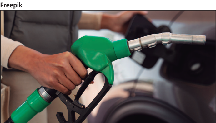
Dados mostram tendências relevantes para a economia local