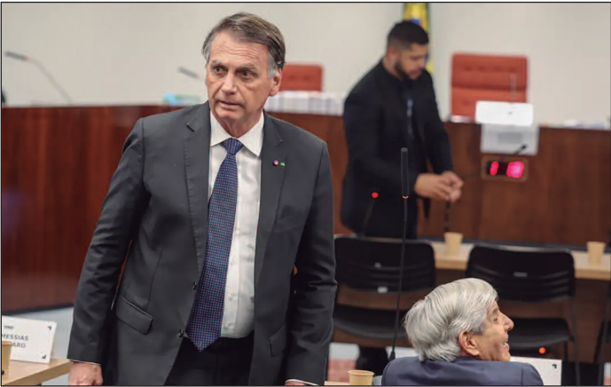
Medida busca evitar fuga do ex-presidente. Polícia Penal do DF fará a vigilância sem entrar no domicílio