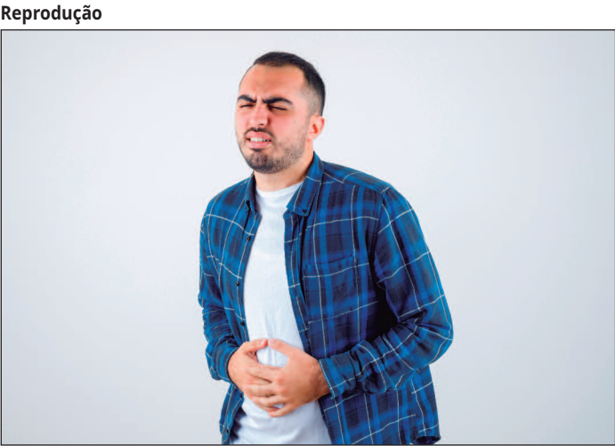
O diagnóstico é realizado pelo médico por meio da anamnese