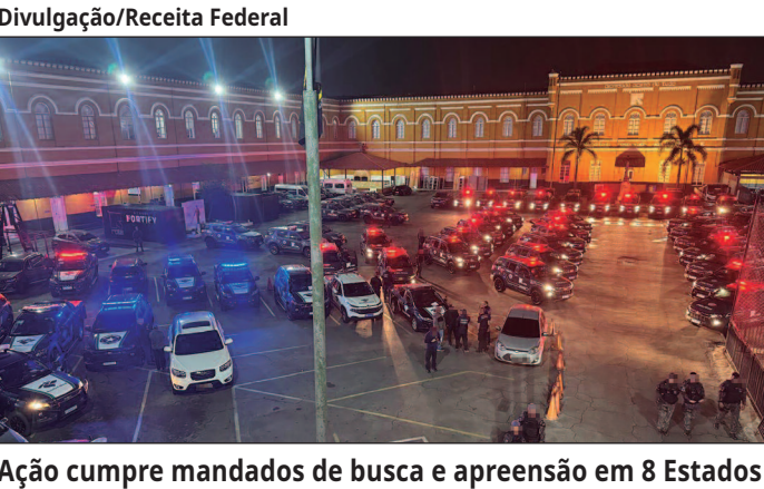
Ação cumpre mandados de busca e apreensão em 8 Estados