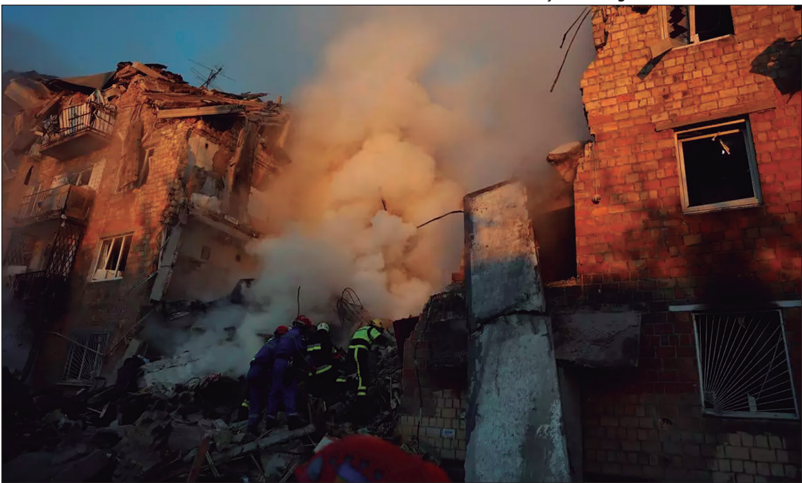
Explosões em Kiev causaram destruição em ao menos sete distritos e reacenderam tensões diplomáticas

diu que Moscou interrompa o que chamou de “ataques indiscriminados à infraestrutura civil”. Em Bruxelas, o bloco convocou o representante russo para prestar explicações. A comissária europeia Marta Kos classificou a ofensiva como brutal e afirmou que a Rússia rejeita a paz ao optar pelo terror. O presidente do Conselho Europeu, António Costa, declarou que a agressão apenas reforça a determinação da União Europeia em apoiar Kiev. Em Londres, o ministro das Relações Exteriores, David Lammy, também anunciou a convocação do embaixador russo, ressaltando que prédios britânicos foram atingidos. O presidente francês Emmanuel Macron descreveu os ataques como bárbaros. Em publicação no X, Macron afirmou: “629 mísseis e drones em uma única noite sobre a Ucrânia: esta é a ideia de paz da Rússia. Terror e barbárie”. O vice-premiê da Itália, Antonio Tajani, expressou solidariedade à Ucrânia e às instituições da União Europeia, defendendo um esforço diplomático para garantir segurança aos cidadãos europeus.