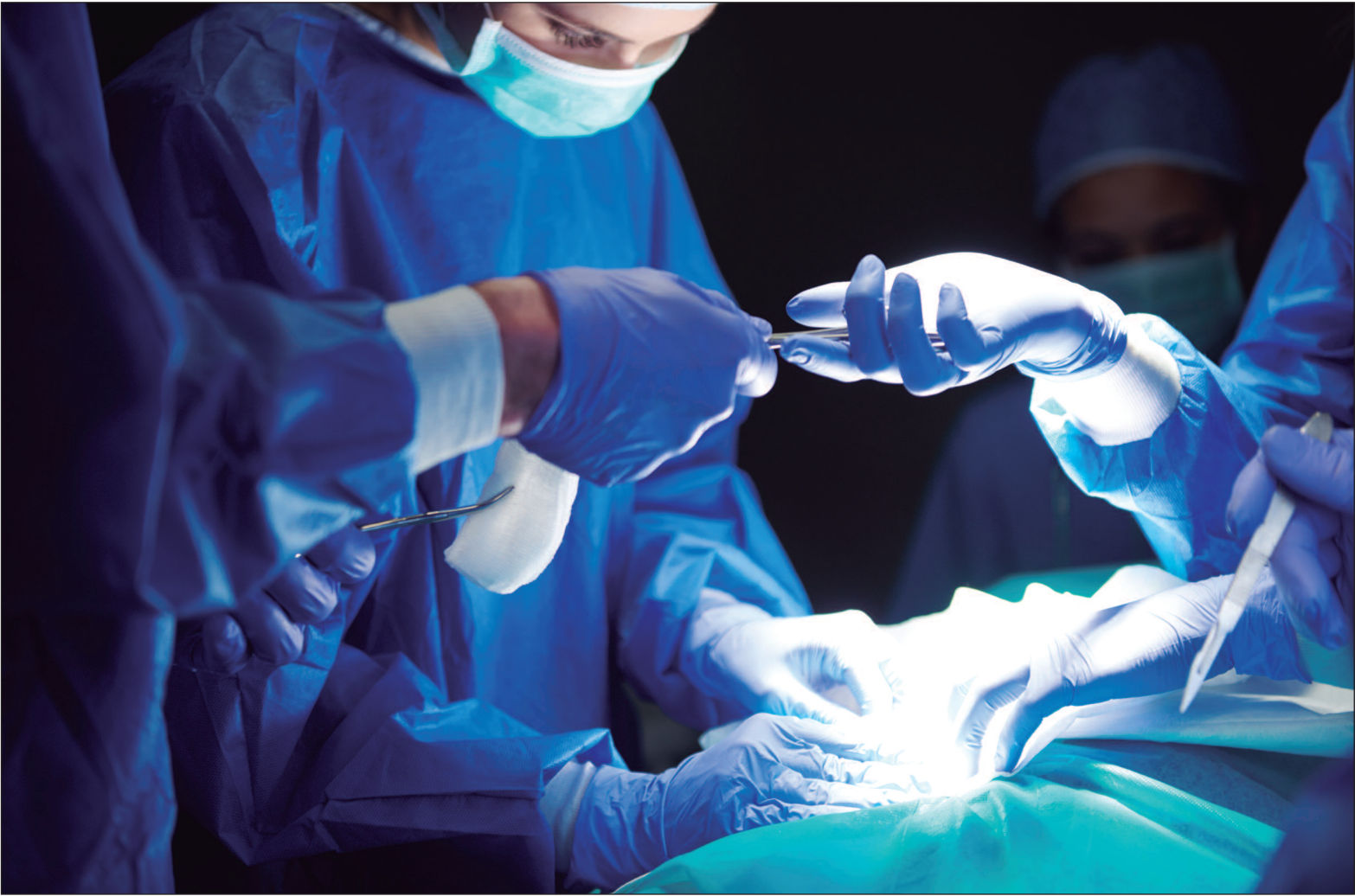
Em junho de 2025 havia cerca de 78 mil pessoas na fila por um órgão

O Brasil mantém posição de destaque internacional quando o assunto é transplante de órgãos. O país é considerado referência nesse campo e possui um sistema de espera estruturado com critérios rigorosos, que buscam assegurar equidade e transparência em cada etapa do processo. Segundo informações divulgadas pelo Ministério da Saúde, em junho de 2025 havia cerca de 78 mil pessoas na fila por um órgão. Os dados também apontam que mais de 85% das cirurgias são custeadas pelo Sistema Único de Saúde (SUS). Apenas em 2024, a rede pública realizou mais de 30 mil transplantes, número que representa um aumento de 18% em relação a 2022 e consolidou um marco histórico para o sistema. A coordenação desse processo cabe ao Sistema Nacional de Transplantes (SNT), órgão do Ministério da Saúde responsável por estabelecer normas, supervisionar e fiscalizar cada procedimento. A atuação do SNT assegura que a fila de espera siga critérios definidos, garantindo que os transplantes ocorram de forma ética, transparente e em consonância com os princípios do SUS. No centro da gestão está o Cadastro Técnico Único, a lista nacional de transplantes. Embora seja unificada, essa fila é administrada por estados e regiões, por meio das Centrais de Notificação,