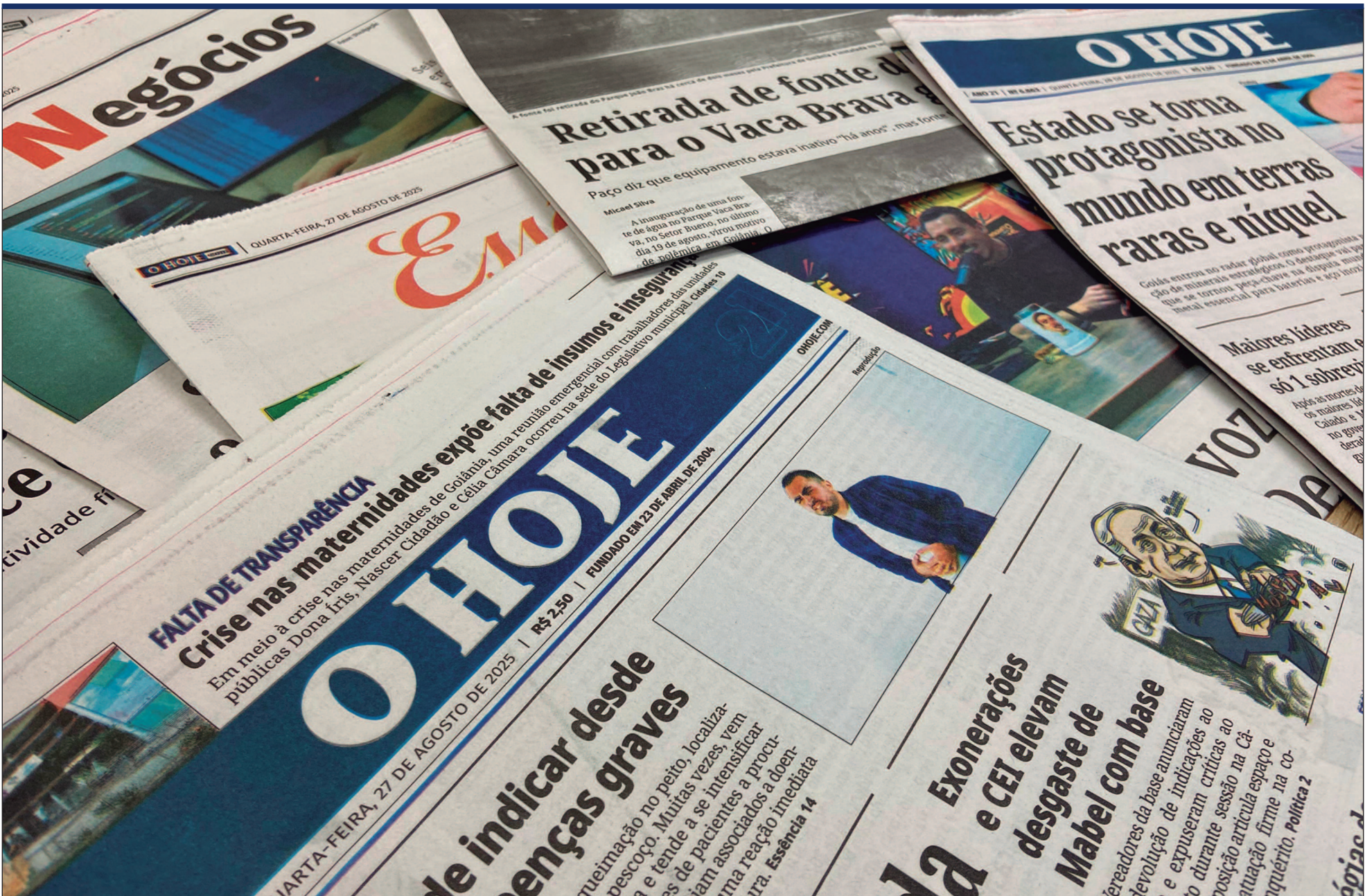
Nossa comunicação digital se ambienta como se toda a equipe estivesse dentro das redações em Goiânia e Brasília cara a cara com o consumidor da notícia