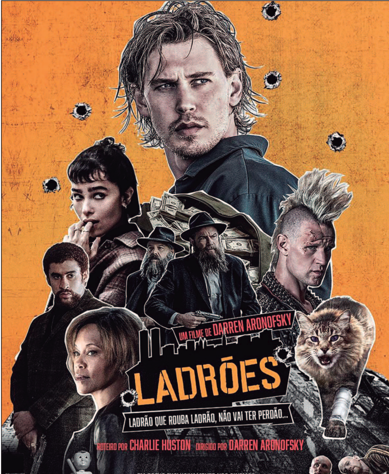
“Ladrões” acompanha a jornada pela sobrevivência de um antigo fenômeno do beisebol Hank Thompson (Austin Butler)

Corra que a Polícia Vem Aí! (EUA, 2025). Duração: 1h 25min. Direção: Akiva Schaffer. Elenco: Liam Neeson, Pamela Anderson, Paul Walter Hauser. Gênero: Comédia, Ação. Cinemark Passeio das Águas: 16h20. Moviecom Buriti: 17h40. Os caras malvados (EUA, 2025) Duração: 1h 44min. Direção: Pierre Perifel, Juan Pablo Sans. Elenco: Sam Rockwell, Craig