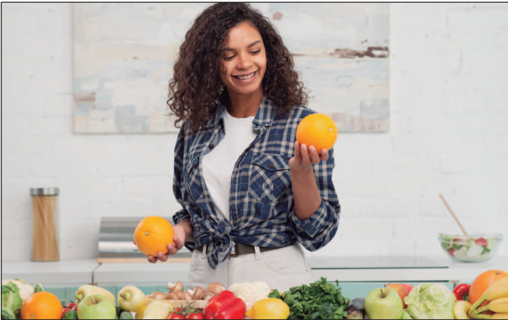
Pequenas escolhas no dia a dia podem tornar a alimentação mais equilibrada

A organização é outro ponto-chave. Ter vegetais lavados e cortados prontos na geladeira facilita o preparo. Cozinhar grãos em maior quantidade e armazenar porções prontas economiza tempo sem comprometer a qualidade. Se-