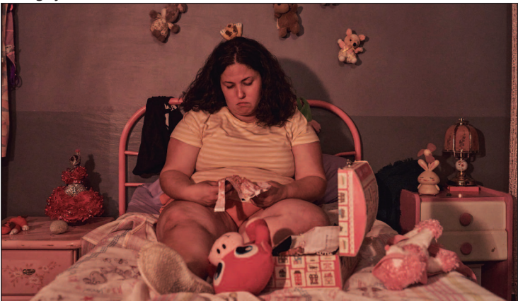
Mostra de Cinema Espanhol é realizada em parceria com a Embaixada da Espanha no Brasil

xão com sua vocação artística durante uma viagem à Argentina. Onde: Cine Cultura – Centro Cultural Marieta Telles Machado, Praça Cívica. Horário: 20h.