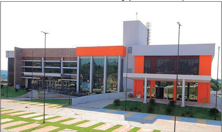
Trabalhadores permanecem mobilizados e aguardam definição sobre pagamento integral das verbas rescisórias

Com base na decisão da categoria, os sindicatos anunciaram que farão nova tentativa de diálogo com a prefeitura, buscando pagamento em parcela única e a defesa integral dos direitos trabalhistas. Também será solicitada a intervenção do Ministério Público Estadual (MP-GO) e do Ministério Público do Trabalho (MPT) para viabilizar propostas mais justas. Todas as propostas serão apresentadas à categoria em assembleia e só serão aceitas se