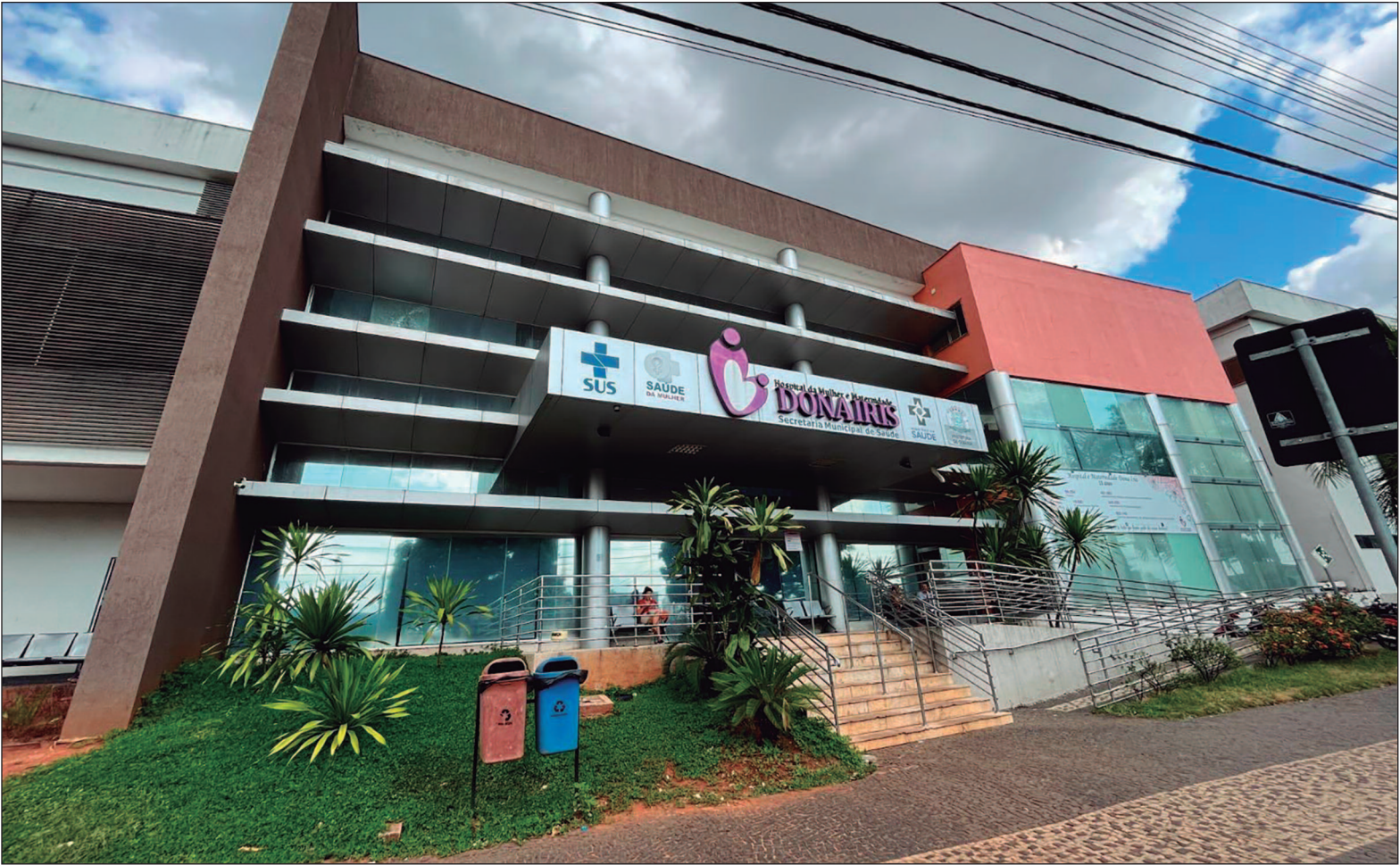
Prefeitura de Goiânia repassa R$ 8,4 milhões à Fundahc e garante pagamento dos salários de agosto durante transição da gestão