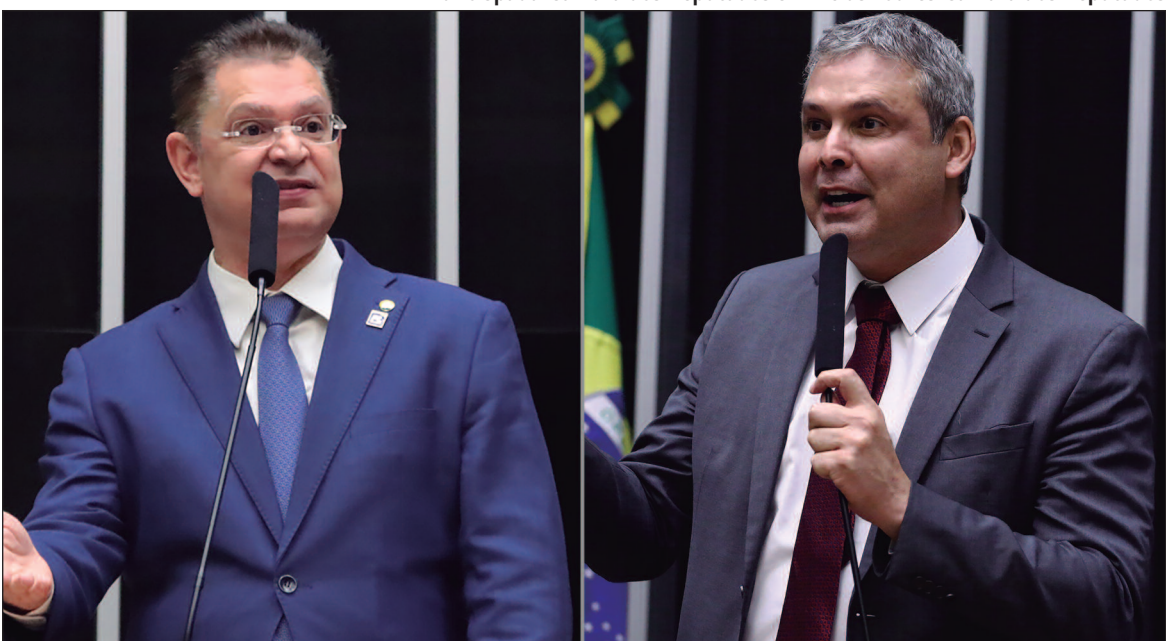
Oposição ao governo Lula e Centrão querem colocar em votação PEC que aumenta impunidade