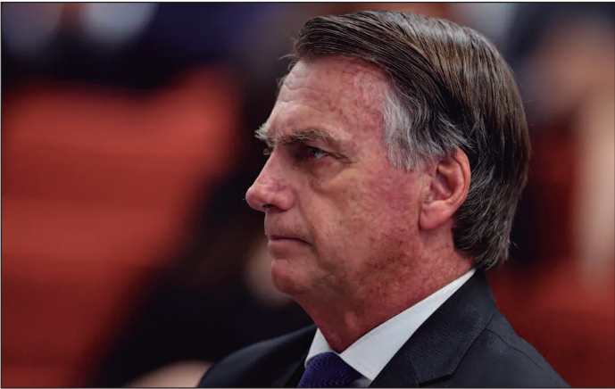
“The Economist” diz que o Brasil fortalece a democracia