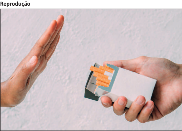
O tabagismo pode desencadear aproximadamente 50 problemas de saúde