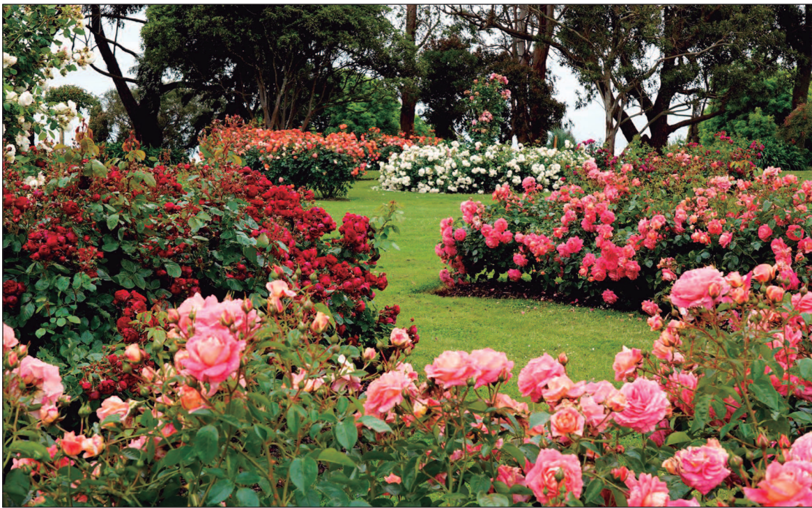
Estação das flores intensifica sintomas respiratórios