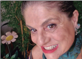
Marli Gonçalves é jornalista, consultora de comunicação e autora de “Feminismo no Cotidiano”