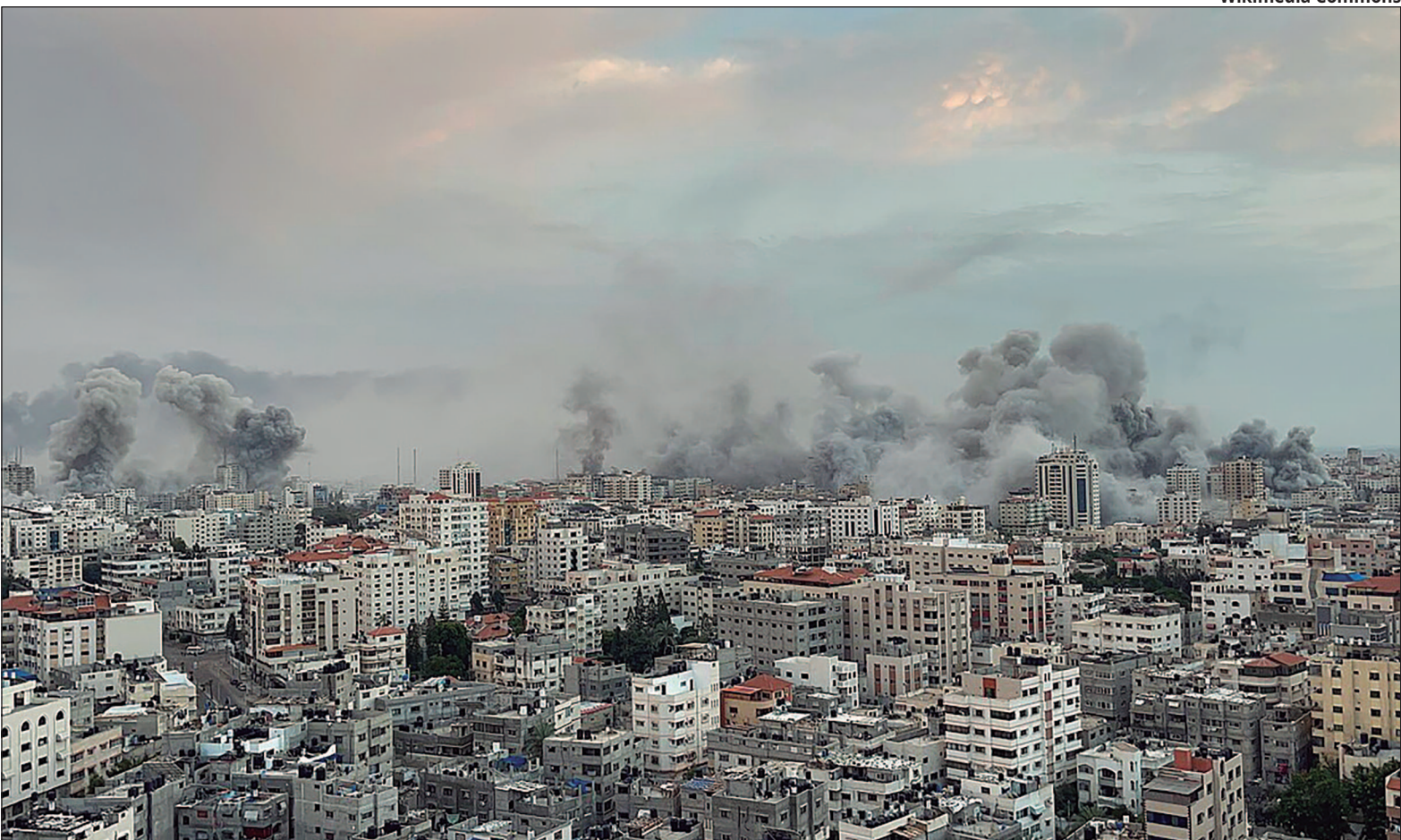
Reconhecimento fortalece solução de dois Estados e amplia pressão internacional sobre Israel

Reino Unido, Austrália e Canadá anunciaram neste domingo (21) o reconhecimento formal do Estado da Palestina. A decisão representa uma guinada histórica no posicionamento desses países e coloca, pela primeira vez, duas nações do G7 nesse grupo. O gesto ocorre em meio à intensificação da guerra em Gaza, à escalada da crise humanitária e ao enfraquecimento das negociações de paz. No Reino Unido, o anúncio foi feito pelo primeiro-ministro Keir Starmer, que utilizou as redes sociais para detalhar a decisão. “Hoje, o Reino Unido reconhece formalmente o Estado da Palestina para reviver a esperança de paz entre palestinos e israelenses, e uma solução de dois Estados”, afirmou. Em julho, Starmer havia adiantado que a formalização ocorreria em setembro, durante a Assembleia Geral da ONU, condicionada a avanços de Israel em direção a um cessar-fogo. Diante da falta de progresso e do agravamento humanitário, o governo britânico decidiu antecipar a medida. O Canadá formalizou o reconhecimento com o primeiro-ministro Mark Carney, que