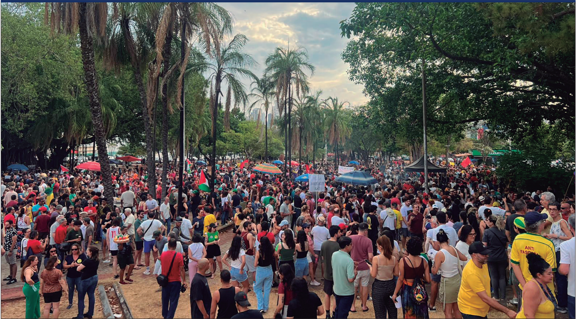
“É muito bom ver pessoas de várias idades unidas por um objetivo comum, presentes em uma manifestação organizada que busca tornar o Brasil um lugar melhor” Victor Hugo