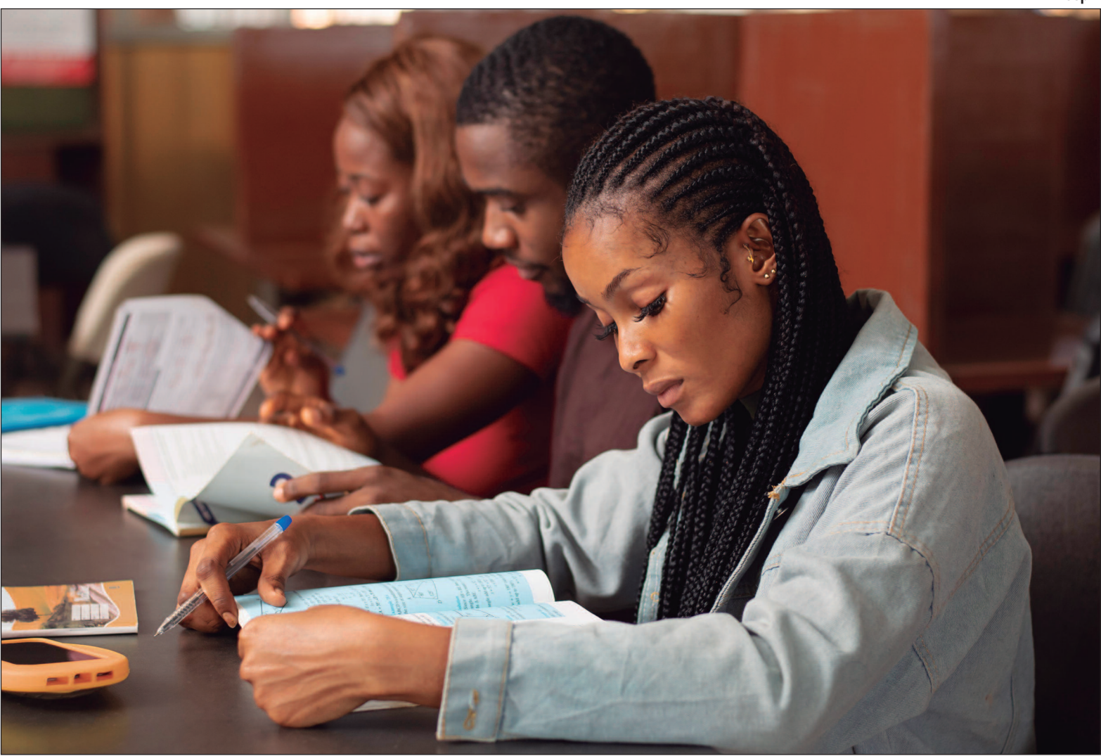
Supremo Tribunal Federal confirma uso de categorias “preto” e “pardo” do IBGE para orientar cotas raciais em concursos públicos

O Supremo Tribunal Federal (STF) decidiu que a política de cotas raciais em concursos públicos deve adotar os critérios do Instituto Brasileiro de Geografia e Estatística (IBGE), reconhecendo apenas as categorias “preto” e “pardo” como referência oficial. A medida, publicada na última sexta-feira (19), tem repercussão geral e passa a orientar todos os certames realizados no país. A decisão responde a pedido do Instituto de Defesa dos Direitos das Religiões Afro-Brasileiras (Idafro) e corrige uma imprecisão em documento anterior da própria Corte, que havia utilizado as expressões “negro e pardo”. O acórdão retificado reafirma o alinhamento da Suprema Corte à Lei 12.990/2014, que regulamenta a reserva de 20% das vagas em concursos federais para candidatos autodeclarados pretos ou pardos. O relator do caso, ministro Luís Roberto Barroso, destacou que o Judiciário pode intervir em situações em que comissões de heteroidentificação descumpram princípios constitucionais, como a dignidade da pessoa humana, o contraditório e a ampla defesa. O entendimento segue precedentes importantes, como o julgamento da