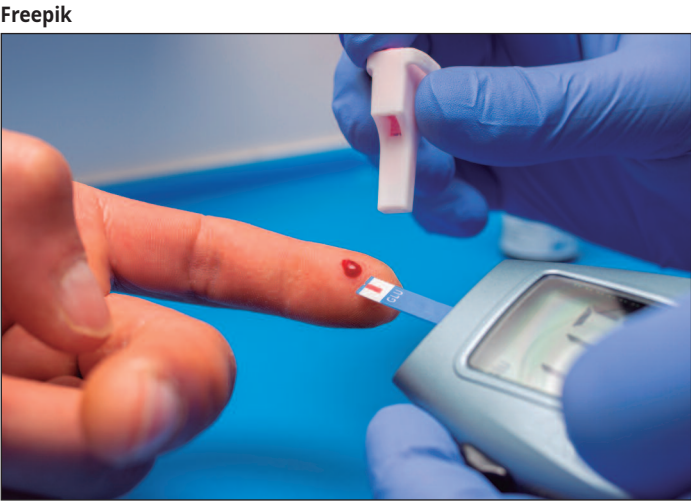
O teste anual é indicado para pessoas com maior risco