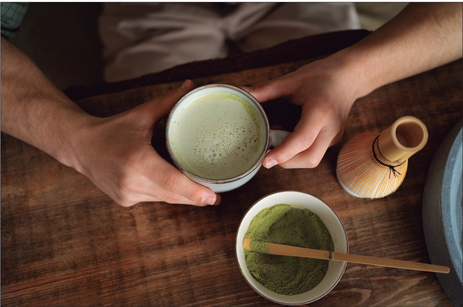
A bebida tem ganhado espaço pela variedade de benefícios associados ao seu consumo

Diversos estudos têm apontado que o chá matcha oferece uma série de benefícios à saúde, graças à alta concentração de antioxidantes, cafeína e aminoácidos presentes em sua composição. Um dos efeitos