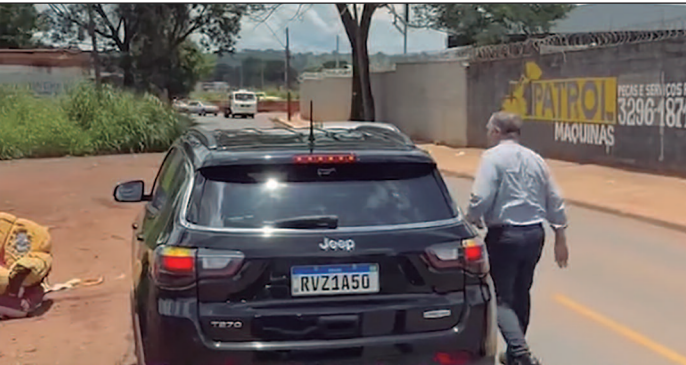
Contrato de R$ 3,1 milhões para locação de carros inclui blindado para uso do prefeito