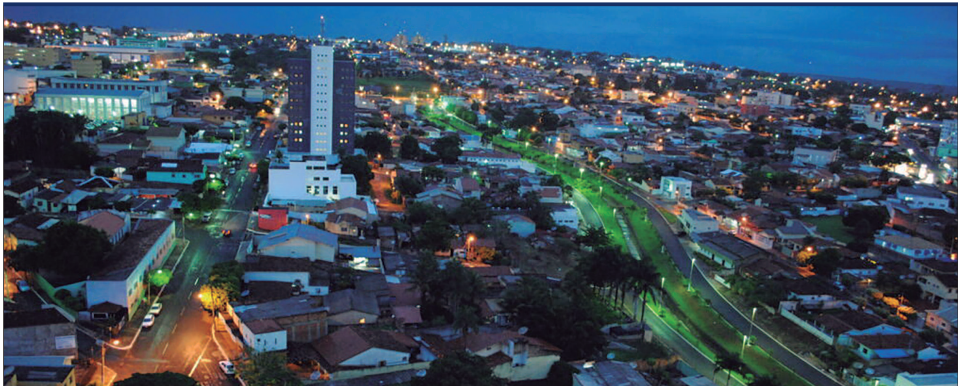
A migração de brasileiros dos grandes centros urbanos para cidades médias e interiores ganhou força nos últimos anos