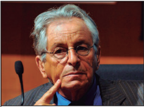
Fernando Gabeira é escritor, jornalista e ex-deputado federal pelo Rio de Janeiro