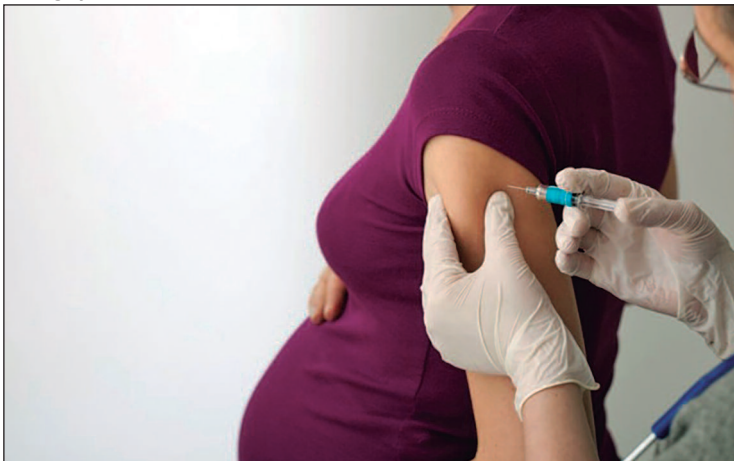
A vacinação será voltada principalmente a gestantes, a partir da 28ª semana, em dose única

imunológica. O VSR responde por 75% das bronquiolites e por cerca de 40% das pneumonias em crianças menores de dois anos. Embora a maioria dos casos seja leve, o vírus tem alta transmissibilidade