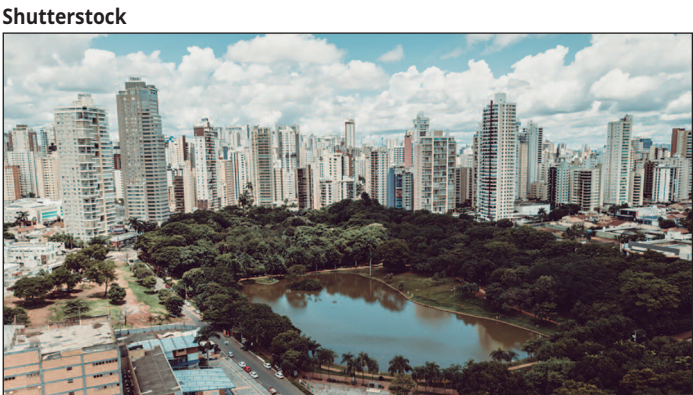
Preços empurraram muitos imóveis para fora do limite antigo