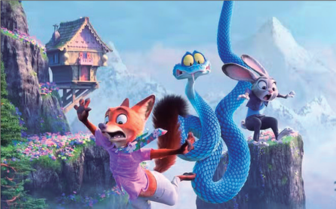
Em “Zootopia 2”, os heróis e policiais novatos Judy Hopps e Nick Wilde estão de volta para mais uma aventura extravagante pela grande metrópole animal de Zootopia