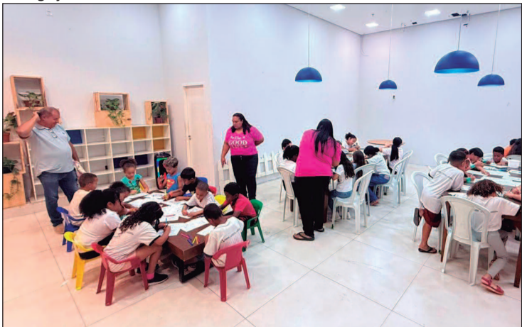
As crianças poderão participar de atividades como massinha

Goiás, a Mostra GiroDança chega à sua oitava edição celebrando a riqueza cultural brasileira. A segunda etapa do evento será realizada neste fim de semana com programação voltada para o público infantil. No sábado, às 10h, a Cia Flor do Cerrado apresenta “À espera do Balão Mágico”. Em seguida, às 11h15, a Giro8 Cia de Dança apresenta “Cerrado Mundo Mágico”. No Domingo, às 10h, Ateliê do Gesto apresenta “Fica Comigo”. Encerrando a mostra, Trupe Cambalhota apresenta “As Crianças Passarinho”. Para garantir a melhor experiência ao público, a estrutura da Mostra Kids contará com palco adaptado, sistema de som, tendas e cadeiras. Quando: Sábado (24). Onde: Rua do lazer, Centro, Goiânia. Horário: das 10h até 12h15. Entrada gratuita.