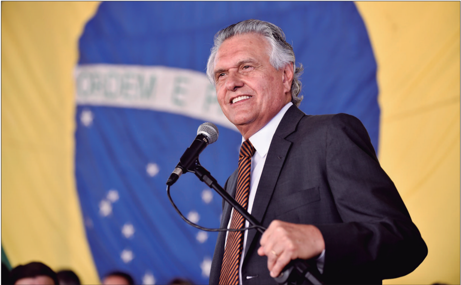
Governador quer conseguir palanque para Daniel com o PL. Caiado contaria com a ajuda de Flávio, desde que saia da corrida presidencial

As articulações feitas por Caiado e pelo seu vice para atraírem o PL tiveram algum avanço em meados de dezem-