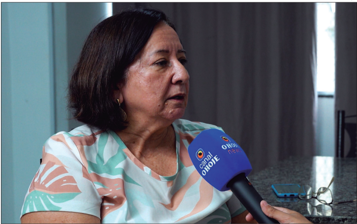
Mãe da corretora relata conflitos anteriores e pede cautela na divulgação de informações