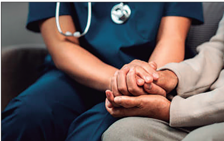
Diretrizes buscam reduzir constrangimentos e tornar o atendimento em saúde mais seguro

serviços que realizam diagnóstico, acompanhamento clínico e dispensação de medicamentos nessas áreas.