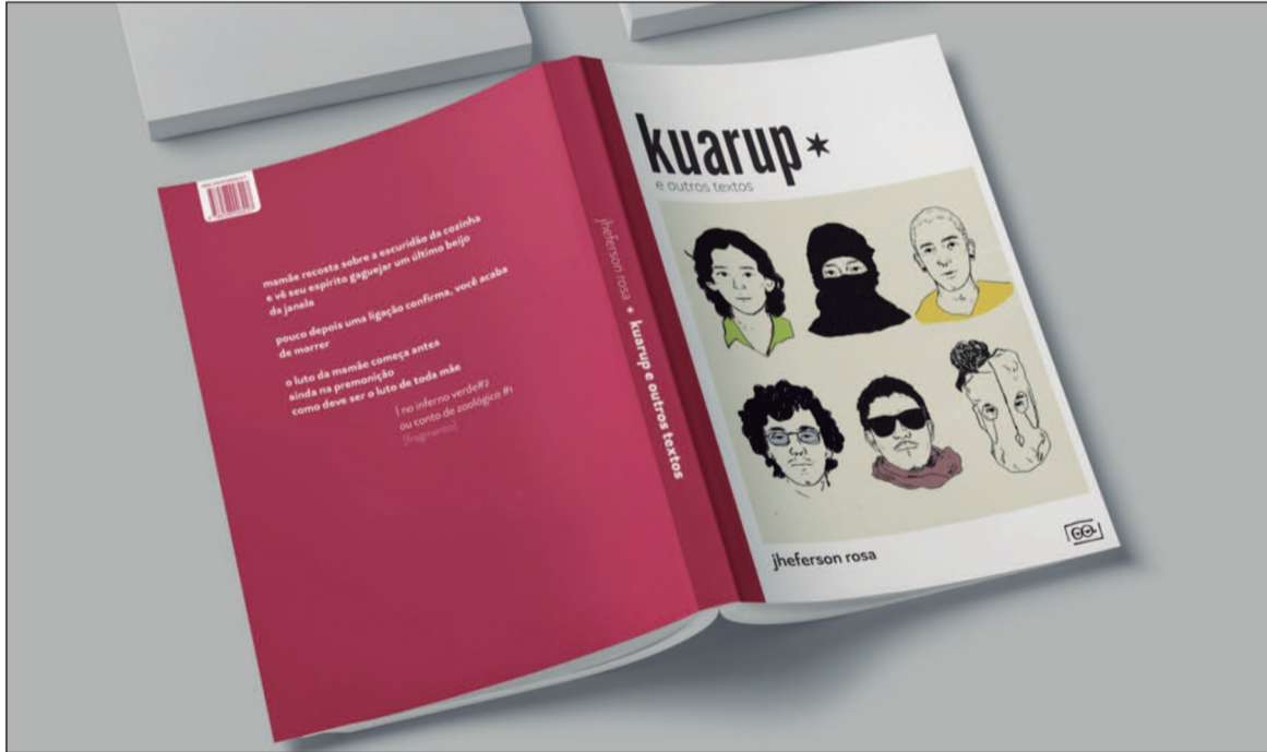
Capa de “Kuarup e outros textos”, com arte de Bruna Cruz, que auxiliou na curadoria dos zines do livro

Acompanhar Rosa é ver esse livro se formando aos poucos. Há anos sua escrita circula pelas redes, muito antes da pandemia, em poemas soltos, textos compartilhados e projetos independentes. Existe um orgulho específico em ver Kuarup e outros textos existir: não apenas pela força da obra, mas também por ela nascer em Goiás, fora do eixo tradicional do mercado editorial, sustentada por um trabalho construído com rigor e insis-