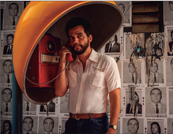
Wagner Moura em "O Agente Secreto"