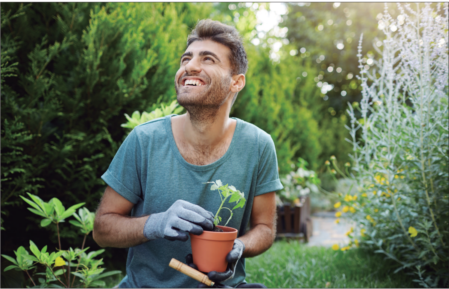
Os autores apontam que a prática pode contribuir para a prevenção de doenças crônicas

O cuidado com plantas e o contato direto com a terra, práticas comuns na jardinagem, têm ganhado destaque como aliados da saúde física e mental. Embora historicamente associados a jardins terapêuticos e iniciativas de bem-estar, esses benefícios começam a ser confirmados por estudos científicos de maior rigor metodológico. Pesquisadores da Universidade do Colorado, nos Estados Unidos, publicaram um estudo randomizado e controlado, considerado referência na pesquisa científica, que analisou os efeitos da jardinagem na saúde. Os resultados indicam que a participação em atividades de jardinagem coletiva está associada ao aumento da ingestão diária de fibras, maior nível de atividade física e redução significativa dos níveis de estresse e ansiedade. O trabalho, divulgado na edição de janeiro de 2023 da revista The Health , reforça achados preliminares de pesquisas anteriores, que já sugeriam que pessoas envolvidas com jardinagem tendem a consumir mais frutas e vegetais e a apresentar melhor controle do peso corporal. No entanto, até então, havia poucos estudos controlados sobre o tema e nenhum voltado especificamente à jardinagem comunitária. Com base nos novos dados, os autores apontam que a prática pode contribuir para a prevenção de doenças crônicas, alguns tipos de câncer e transtornos ligados à saúde mental. Além dos efeitos físicos, a jardinagem demonstrou impacto positivo no desenvolvimento cognitivo, no aprendizado contínuo e no fortaleci-