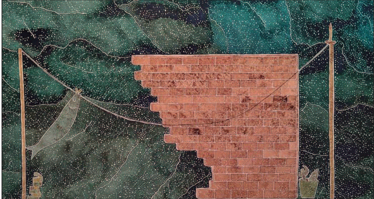
A exposição reúne trinta artistas

2026, a 7ª edição do FESTIN – Festival de Teatro Infantil de Goiás, um dos principais eventos dedicados às artes cênicas para a infância e juventude no estado. Com o tema “Vamos celebrar as diferenças e abraçar a imaginação!”, o festival oferece entrada gratuita e ocupa o Centro Cultural da Universidade Federal de Goiás (CCUFG), no Setor Universitário, com uma programação diversa, sensível e profundamente comprometida com a inclusão. Criado em 2017, dentro da Cia Flor do Cerrado, o FESTIN nasceu do desejo de ampliar o espaço para companhias goianas que produzem teatro para crianças e jovens. Quando: 5, 6 e 7 de fevereiro. Onde: Centro Cultural da UFG (CCUFG) – Setor Universitário. Entrada gratuita.