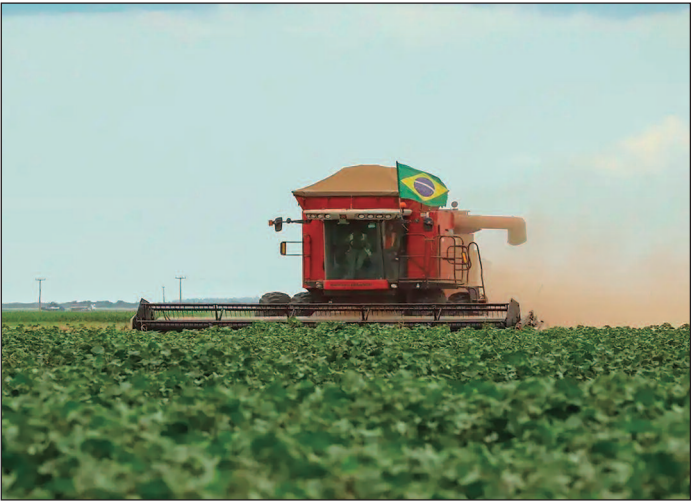
Exportações chinesas de fertilizantes chegam ao menor patamar em mais de 10 anos