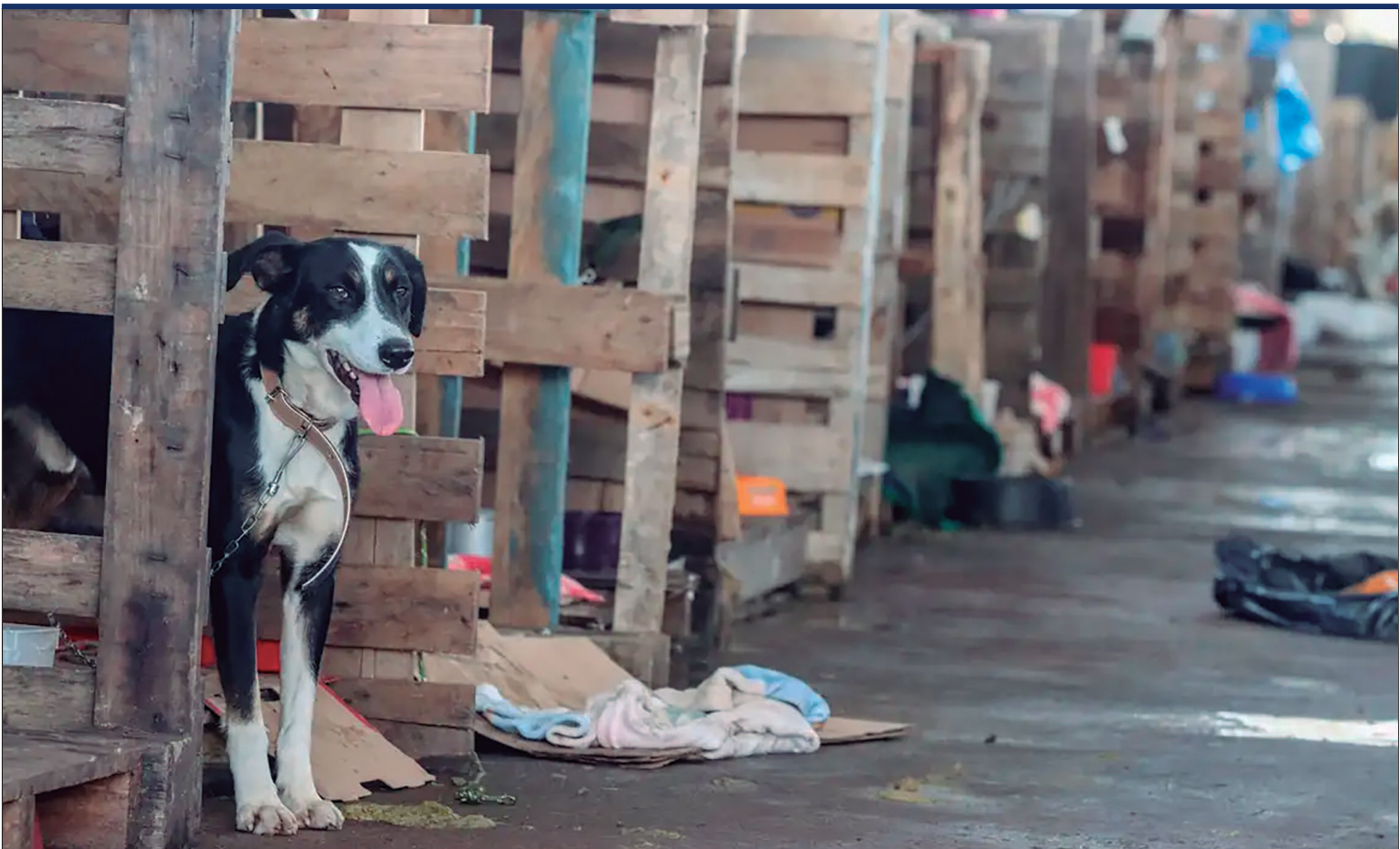
Levantamento da Dema aponta que maus-tratos e abandono são as principais denúncias registradas no Estado