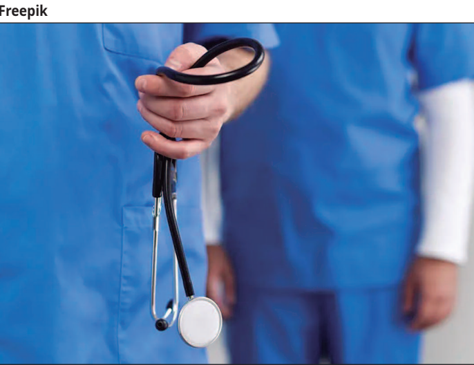
SMS sustenta que edital segue parâmetros legais; médicos denunciam precarização do trabalho e risco de instabilidade