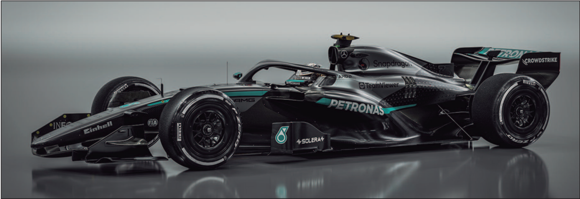
A Mercedes oficializou nesta segunda-feira (2) o lançamento do W17, seu carro para a temporada