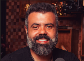
Igor Coelho é fundador do Flow Podcast e CEO Grupo Flow

O hábito de consumo de 2025 é, sem dúvida, o do consumidor multicanal. Ele é o cara que liga a TV em busca daquele consumo linear e previsível, mas no intervalo, está ouvindo um podcast que pesquisou no celular e, em seguida, ri com um corte no TikTok. Ele faz tudo. E é exatamente aqui, nesta coexistência complexa de formatos, que reside o futuro da mídia. O caminho não é mais a competição de plataformas, mas a capacidade de adaptação modular que garante que a sua produção esteja otimizada para todas as telas, em todos os momentos.