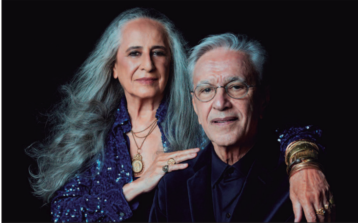
O projeto vitorioso registra a turnê histórica iniciada em 2024

World Music, e voltou a ser premiado em 2001 como produtor de João Voz e Violão, de João Gilberto.