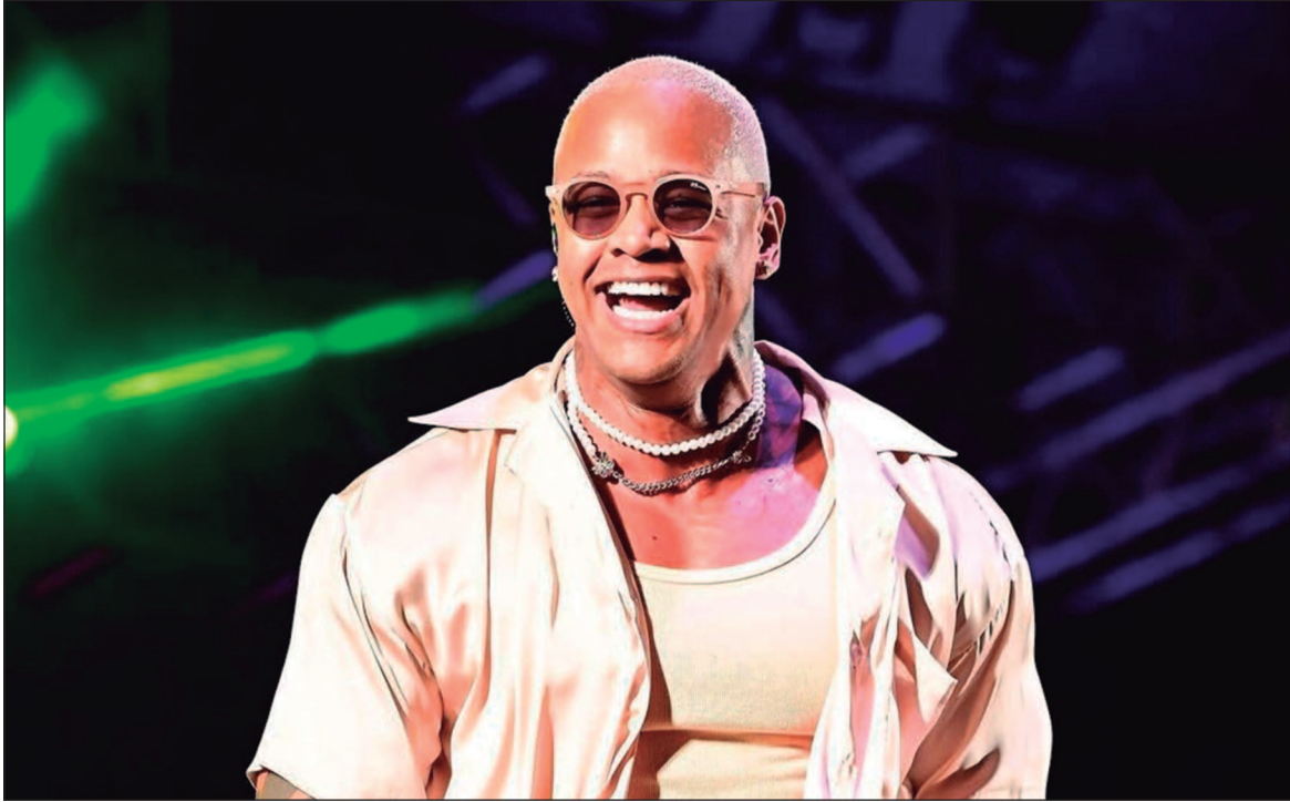
Léo Santana é uma das atrações do pré-Carnaval em Goiânia