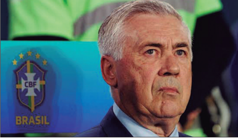
Treinador elogia logística nos EUA

Em evento realizado na sede da CBF nesta segunda-feira (2), o técnico Carlo Ancelotti deu detalhes sobre o planejamento da Seleção Brasileira para a Copa do Mundo de 2026. O comandante italiano revelou que, embora o grupo de convocados esteja avançado, o elenco final ainda não está totalmente fechado, deixando uma ponta de esperança para atletas que buscam uma vaga de última hora.