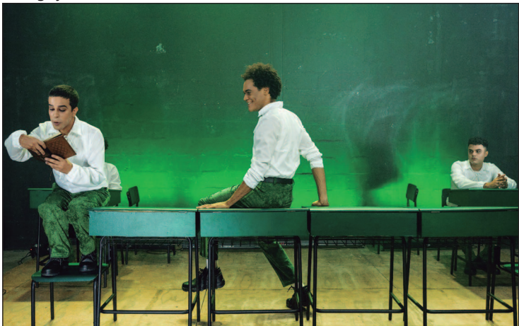
A dramaturgia do espetáculo é assinada por Rafael Freitas

tos. Instalado no piso térreo, na praça de eventos, o espaço reúne brinquedos infláveis, áreas interativas e um circuito suspenso de desafios, garantindo momentos de diversão, movimento e aventura para crianças e adolescentes de até 13 anos. O parque temático conta com torre elástica com plataformas para escalada, passarelas, escorregadores tubulares e temáticos iluminados, além de uma mega piscina com bolinhas. Quando: até o dia 2 de março. Onde: Buriti Shopping – Praça de Eventos: piso Térreo, em frente ao Fujioka. Horário: das 10h às 22h. Entrada: a partir de R$ 50.