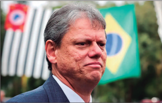
Pablo Jacob/Governo de SP

Emedebistas pleiteiam vice na chapa do governador de SP