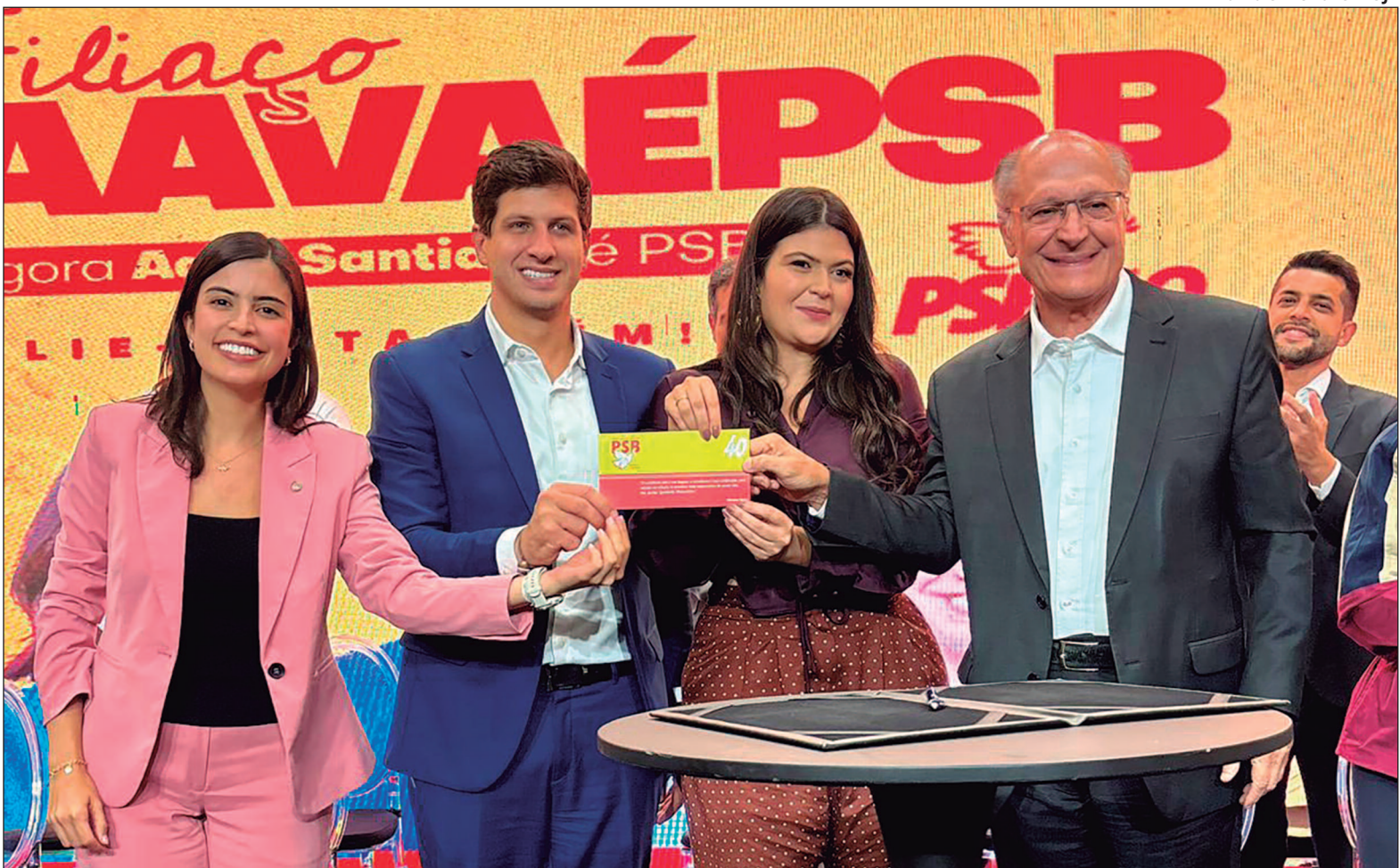
Lideranças nacionais do PSB, como Tabata Amaral, João Campos e Geraldo Alckmin, participam da filiação de Aava Santiago em Goiânia

Sem anunciar alianças, a nova filiada adotou discurso focado na reorganização interna da legenda. Segundo Aava, a prioridade do PSB, que agora será comandado pela vereadora em Goiás, é ampliar sua representação legislativa antes de discutir disputas majoritárias. “A missão que me foi dada é entregar uma chapa forte para o Congresso Nacional e para a Assembleia Legislativa. A discussão sobre palanques majoritários não está no radar agora”, afirmou. A declaração sinaliza uma estratégia de consolidação partidária antes de qualquer definição sobre