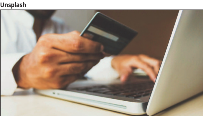
É possível renegociar com condições mais favoráveis