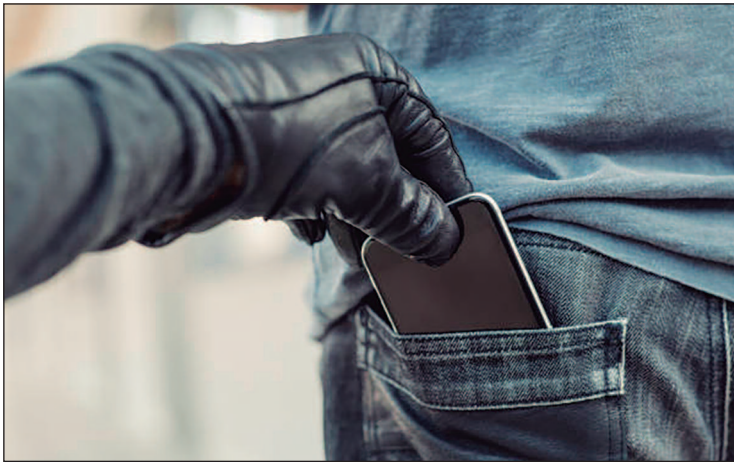
Uso de celular em blocos de Carnaval aumenta o risco de furtos e crimes digitais durante a folia

cativos bancários, redes sociais e dados pessoais sensíveis.” Para o especialista, “o prejuízo financeiro é consequência direta da exposição digital que começa no momento do furto”.