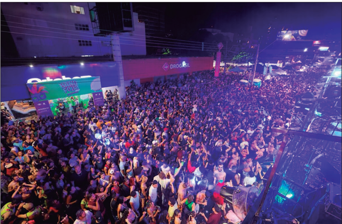
O fluxo iniciado na Capital se espalhou por cidades do interior, como Aruanã, Pirenópolis e Goianésia, o que ampliou os impactos econômicos do Carnaval em todo o Estado de Goiás

Bares e restaurantes também registraram resultados positivos, com relatos de aumento no faturamento entre 20% e 40% ao longo do período. No setor de bebidas, especialmente no mercado de chope, a projeção indicou crescimento entre 15% e 20% nas vendas. A combinação entre praticidade e custo-benefício em en-