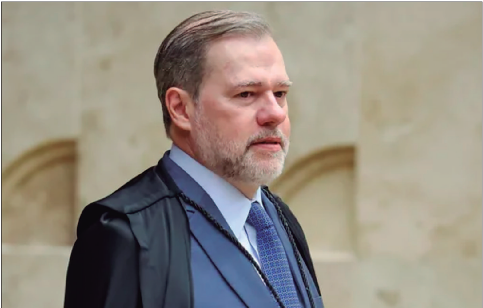
Decisão foi tomada após a reunião convocada pelo presidente da Supremo Tribunal Federal, Edson Fachin, com os ministros

Na última segunda-feira (9), o diretor-geral da PF, Andrei Rodrigues, apresentou a Fachin um relatório sobre a perícia realizada no celular de Vorcaro. No documento, a PF informou que o nome de Toffoli aparece em mensagens encontradas no aparelho. O teor das conversas não foi divulgado ao público. Além de relatar a menção ao ministro, as autoridades solicitaram formalmente ao presidente do STF que fosse declarada a sus-