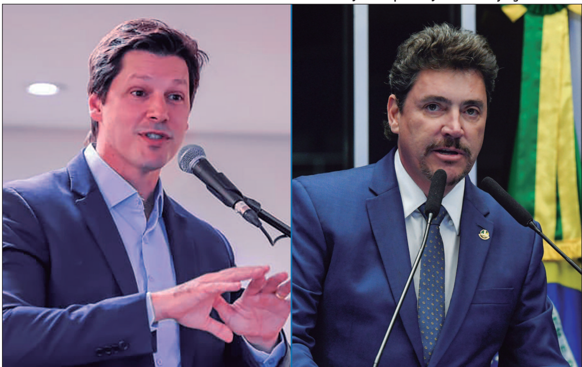
Analistas avaliam que Daniel e Caiado não vão pressionar o PL; intenção é focar disputa com Marconi

Estado, o desfecho demonstrou um aparente interesse na manutenção da pré-candidatura de Wilder, ainda mais diante da concepção de que Goiás é considerado o Estado mais bolsonarista do Brasil. Assim, são grandes as expectativas em torno da disputa do senador pelo governo estadual, sobretudo diante de uma conjuntura política onde os integrantes do PL não devem ser pressionados. O risco de comprar briga com o partido de Wilder é o de, em um eventual segundo turno entre Daniel e o ex-governador Marconi Perillo (PSDB), a legenda de Wilder direcionar apoio ao tucano. Cabe destacar que o posicionamento neutro do presidente nacional do PL relativo à divisão do partido em Goiás possivelmente se dá devido à possibilidade de a sigla poder ter benefício tanto se direcionar apoio à Daniel, quanto se mantiver pré-candidatura própria. De acordo com interlocutores, caso a organização bolsonarista decida seguir com Daniel, a vaga ao Senado que é de interesse do deputado federal Gustavo Gayer (PL) está praticamente reservada para o parlamentar, que tem o interesse de formar chapa com