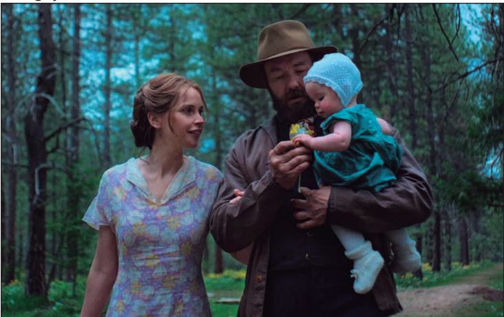
O destaque da semana é o longa-metragem “Sonhos de Trem”