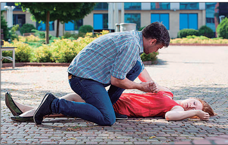
Calor, multidão e consumo de álcool elevam risco de mal-estar no Carnaval

no telefone 192, ou por equipes de socorro do evento.