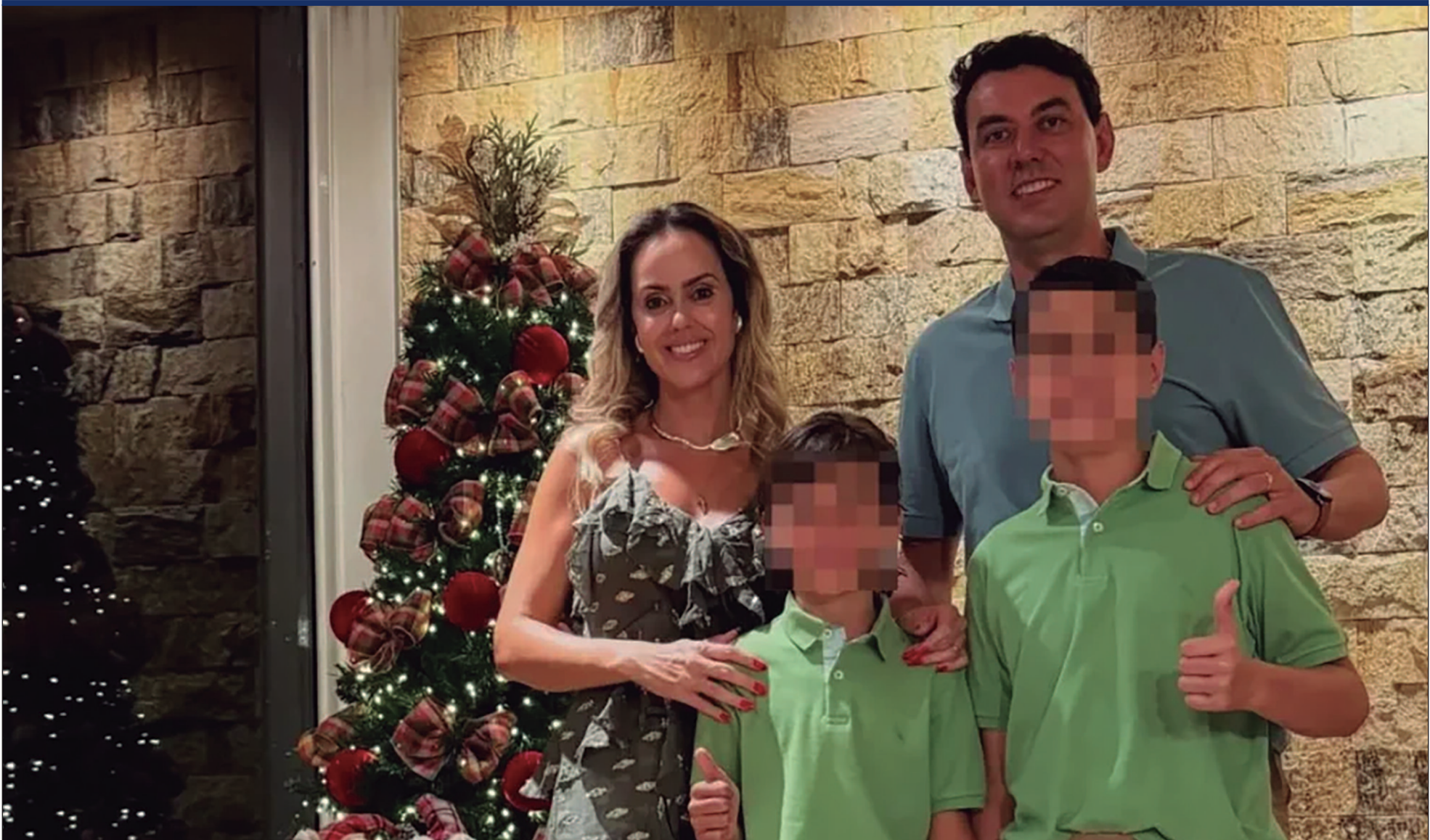
Polícia investiga o caso como homicídio consumado e tentado, seguidos de autoextermínio; mensagem publicada antes do crime integra a apuração