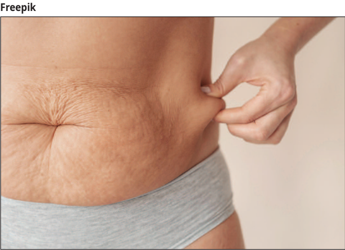
A celulite é classificada em diferentes níveis de gravidade