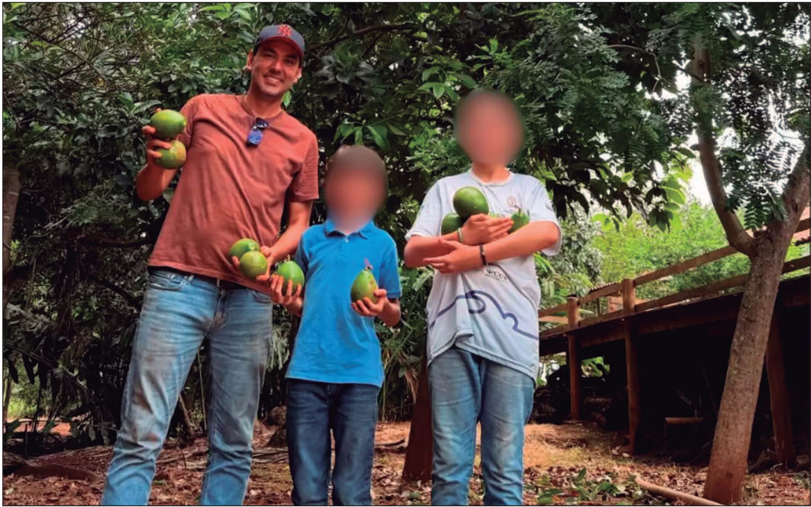
A cidade decretou luto oficial de três dias e aguarda o avanço das investigações