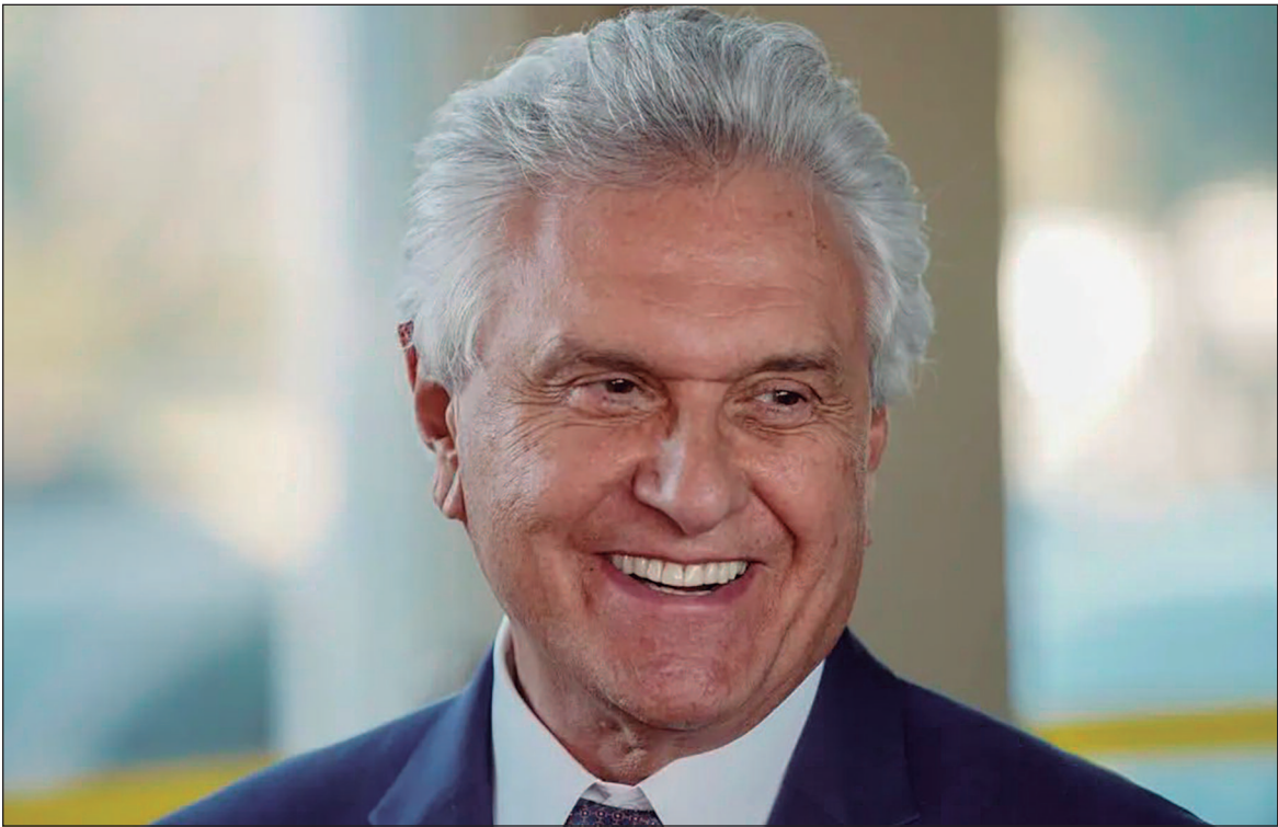
Candidatura presidencial exige dedicação integral, presença constante nos Estados e articulação nacional contínua