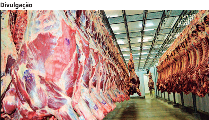
Ministério da Agricultura estima redução de 35% na demanda