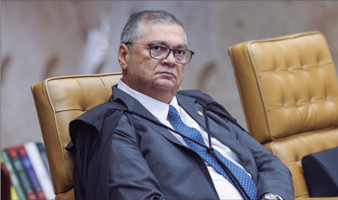
Ministro proibiu a aprovação de novas leis ou atos que garantam pagamento de “penduricalhos” acima do teto

A determinação amplia uma decisão tomada em 5 de fevereiro, quando o ministro