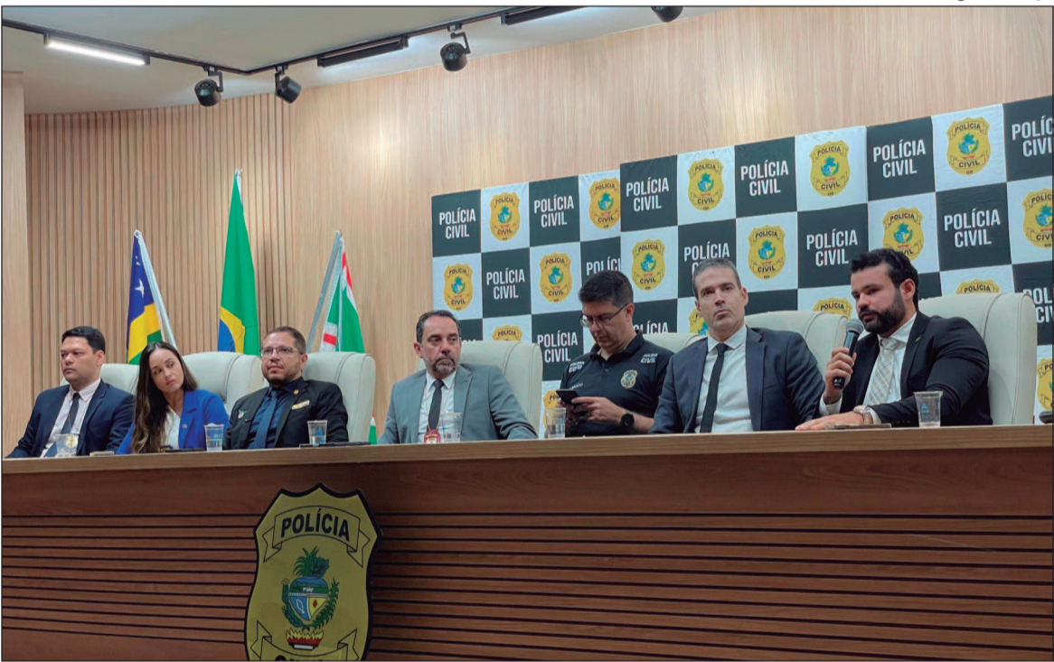
Investigação descarta participação de terceiros e confirma que os disparos ocorreram em área de mata às margens da GO-213