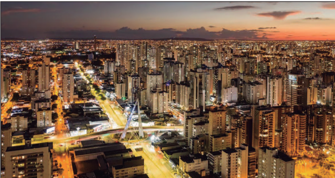
Programa habitacional financiou 156.520 unidades em Goiás, com R$ 3,81 bi em subsídios do FGTS e expectativa de expansão