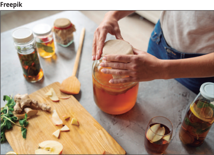
O kombucha também se destaca por suas propriedades probióticas