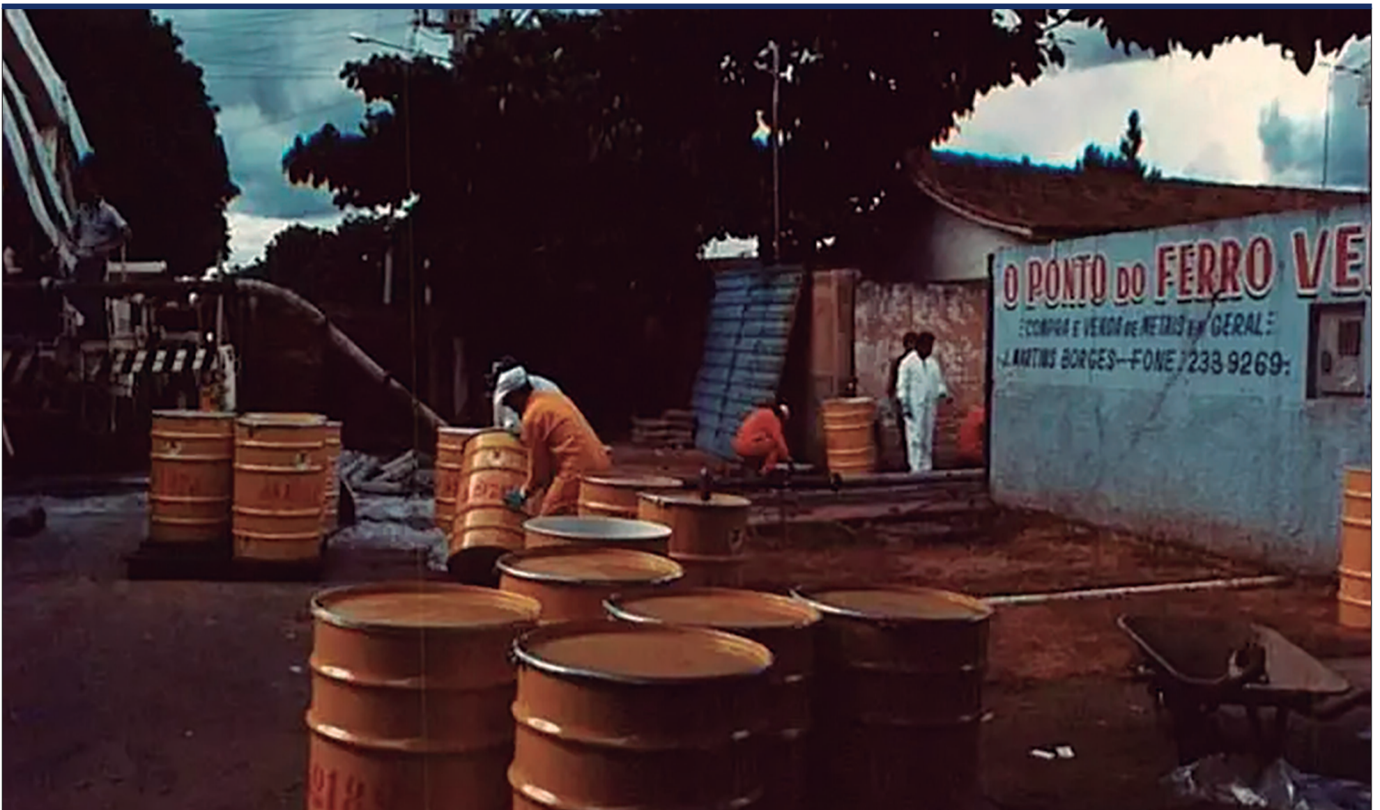
Pó de Césio-137 retirado de equipamento abandonado se espalhou por casas, comunidades e causou contaminação invisível e mortes imediatas