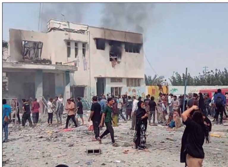
Militares citam 18 empresas como alvos e pedem que funcionários evacuem os locais

Ainda na terça-feira, a Guarda afirmou ter realizado ataques contra duas instalações ligadas ao Exército dos EUA: uma estrutura fora da base aérea de Al Míhad, nos Emi-