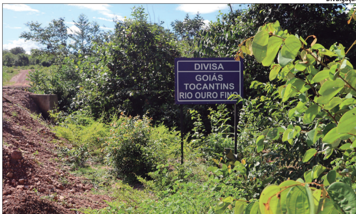
Comitiva percorre área de quase 13 mil hectares e reúne dados para disputa judicial

Segundo a Procuradoria-Geral do Estado (PGE-GO), o Tocantins ocupa o local de forma irregular e mantém serviços públicos na região, além de ter instalado um portal turístico no Complexo do Prata, um dos pontos mais visitados da região da Cha-