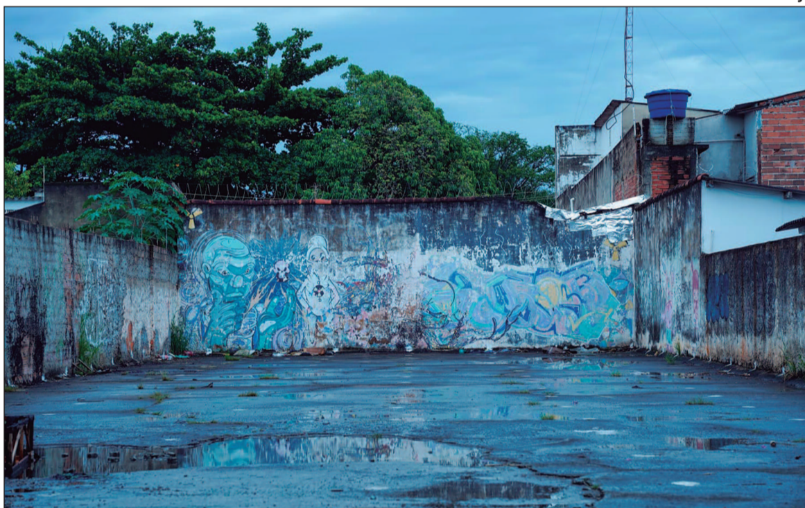
Sobreviventes ainda enfrentam estigma e lutam por reparação, atendimento médico adequado e reconhecimento dos efeitos que perduram até hoje

Com a intenção de vender o chumbo como sucata, os catadores removeram uma peça de cerca de 120 quilos e a levaram para a casa de Roberto. Lá, com ferramentas simples, romperam a blindagem do equipamento e expuseram uma cápsula que continha 19,2