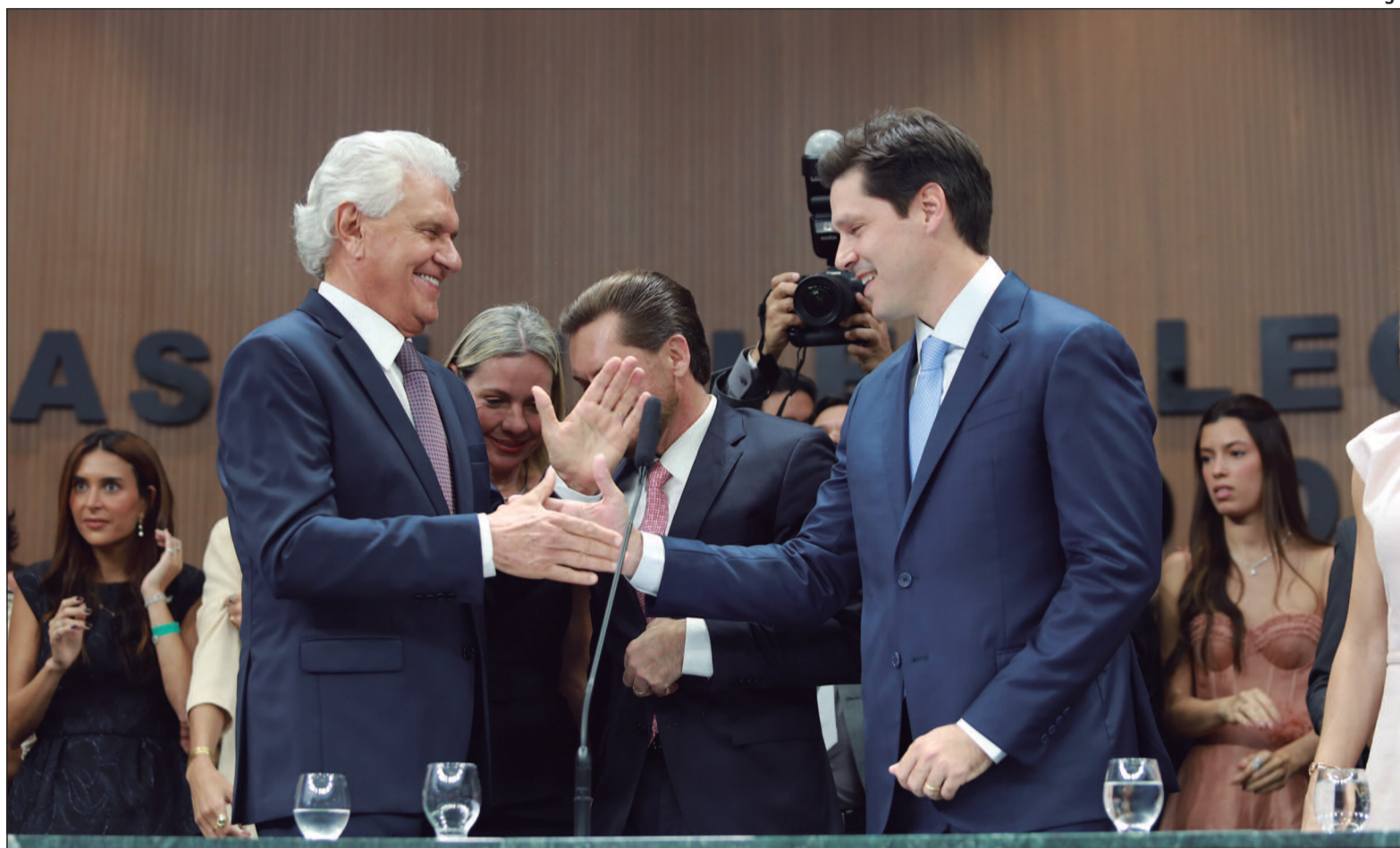
Evento também marcou a renúncia do agora ex-governador Ronaldo Caiado (PSD), que é pré-candidato ao Palácio do Planalto

Em discurso de despedida, Caiado adotou tom de agradecimento e fez um balanço de sua trajetória política, ao mes-