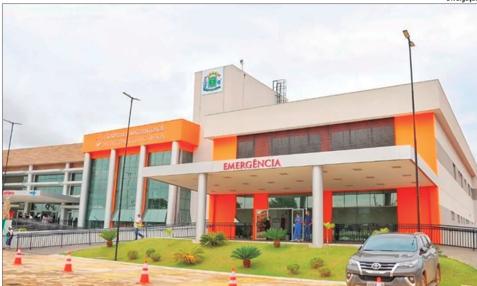
Impasse entre empresas médicas pode comprometer serviços essenciais

O conflito teve início com o encerramento do contrato da empresa Unisen Serviços Médicos, responsável pela intermediação dos profissionais, e a transição para a empresa Prime Med, que passa a assumir a gestão do corpo clínico por meio de contrato com a SBSJ. Em documento assinado no último domingo (29/3), o corpo clínico informou que decidiu, de forma unânime, não continuar prestando serviços a partir das 7h de terça-feira. Além disso, os médicos afir-