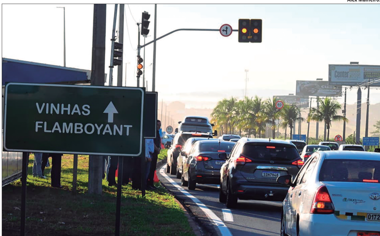
Instalação de semáforo na Av. José Hermano reorganiza tráfego, mas impõe retenções e deixa dúvida sobre prioridade no trânsito da Capital

Para compreender a viabilidade técnica de instalar semáforos em rodovias, o especialista em trânsito e professor