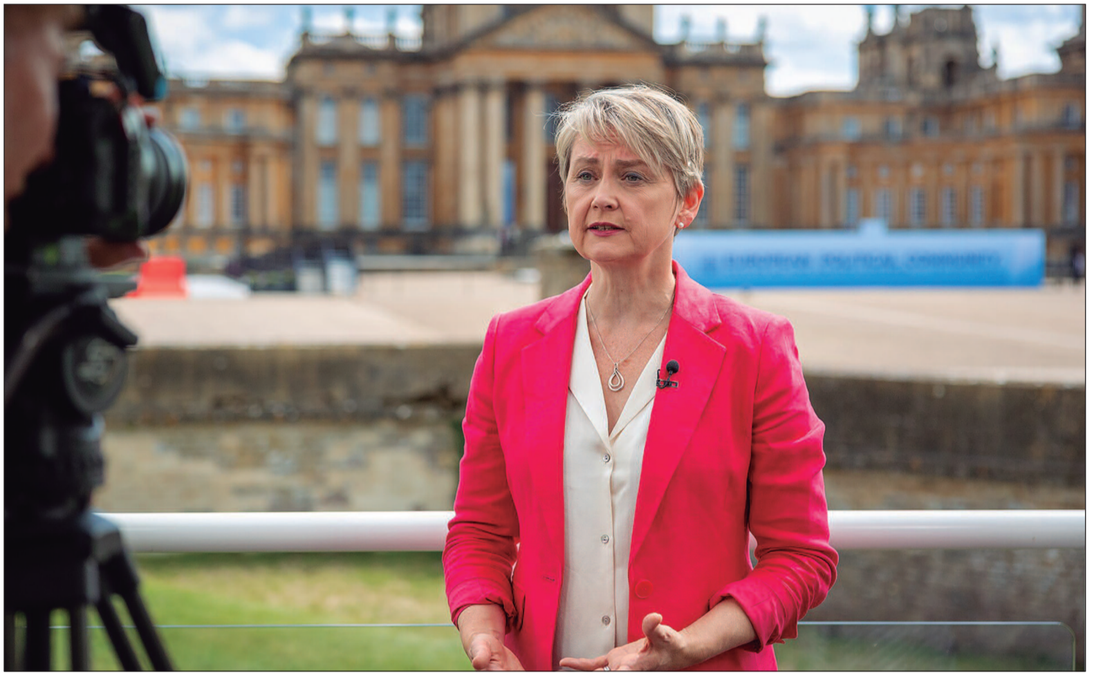
Comitê de Resgate diz que bloqueio na passagem marítima pode ampliar a fome global nos próximos meses

A interrupção do tráfego no estreito ganhou intensidade após ataques a navios comerciais e ameaças contínuas na área. Desde o início do conflito, em 28 de fevereiro, foram contabilizados 23 ataques diretos a embarcações, com 11 tripulantes mortos, de acordo com a empresa de dados marítimos Lloyd's List Intelligence. O cenário levou à redução drástica da circulação na