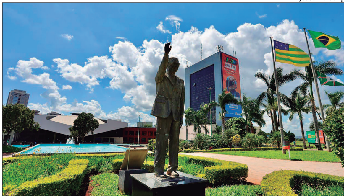
Saúde de urgência, segurança e limpeza seguem em plantão. Escolas, Atende Fácil e repartições fecham

Na rede estadual, hospitais na Capital, Hugo, Hugol, Hemu, Hecad, HDT, Crer e a Maternidade Nossa Senhora de Lour-