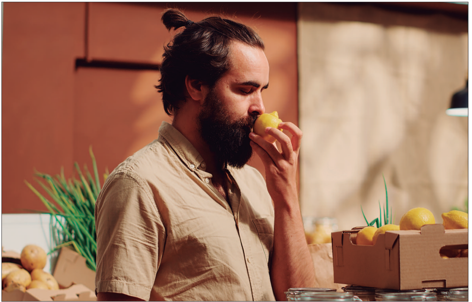
Especialistas alertam que a fagofobia pode ser subdiagnosticada

A condição pode surgir após um episódio traumático de engasgo, mas esse fator não é obrigatório. O medo pode se desenvolver gradualmente e comprometer a rotina alimentar do paciente, levando à preferência por alimentos líquidos ou pastosos, considerados mais fáceis e “seguros” para engolir. Entre os principais sintomas estão a ansiedade intensa antes das refeições, pensamentos recorrentes de que não conseguirá engolir, sensação de garganta apertada, coração acelerado, suor frio e tremores no momento