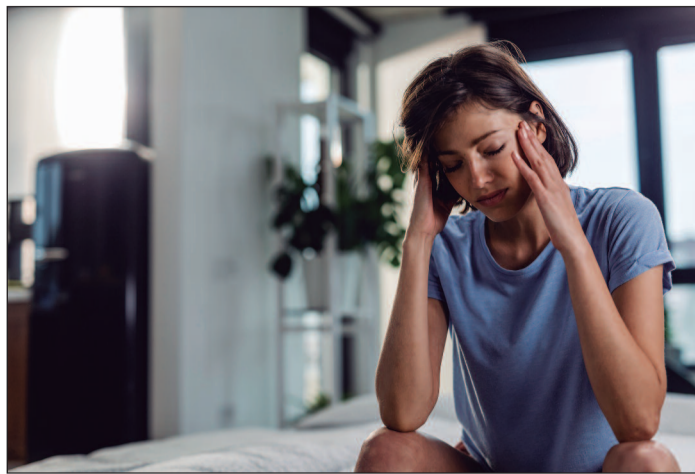
A condição pode passar despercebida pelo próprio paciente