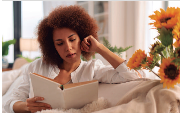
Mulheres negras e da classe C lideram a compra de livros no Brasil

gital, alta de dois pontos percentuais em relação ao ano anterior. Em números absolutos, o mercado incorporou aproximadamente 3 milhões de novos compradores em 12 meses, o maior salto registrado nos últimos cinco anos.