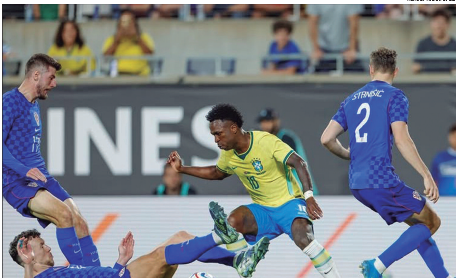
Levantamento do The Athletic coloca a Seleção Brasileira no top 5 entre as 48 equipes do Mundial

Ao analisar o Brasil, o veículo destacou o longo jejum sem títulos mundiais e as recentes eliminações para seleções europeias. Ainda assim, ressaltou o peso do novo comando técnico. “O Brasil precisa urgentemente de vitória em uma Copa do Mundo. Depois de uma qualificatória caótica, resta saber se será realmente um candidato ou se sofrerá outra eliminação precoce. Carlo Ancelotti, um vencedor em série, pode ser um trunfo”, avaliou.