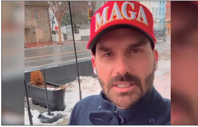
Ex-deputado responde por suposta tentativa de intimidar STF