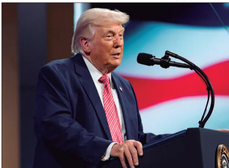
Trump afirma que pretende intensificar a ofensiva enquanto Teerã reage prometendo ampliar os ataques

como parte de um esforço para impedir que o Irã desenvolva armas nucleares e responsabilizou o governo iraniano por ataques a petroleiros que afetaram o abastecimento global de petróleo. Ele classificou a alta recente dos combustíveis como um efeito temporário e atribuiu a crise energética ao que chamou de ações do regime iraniano.