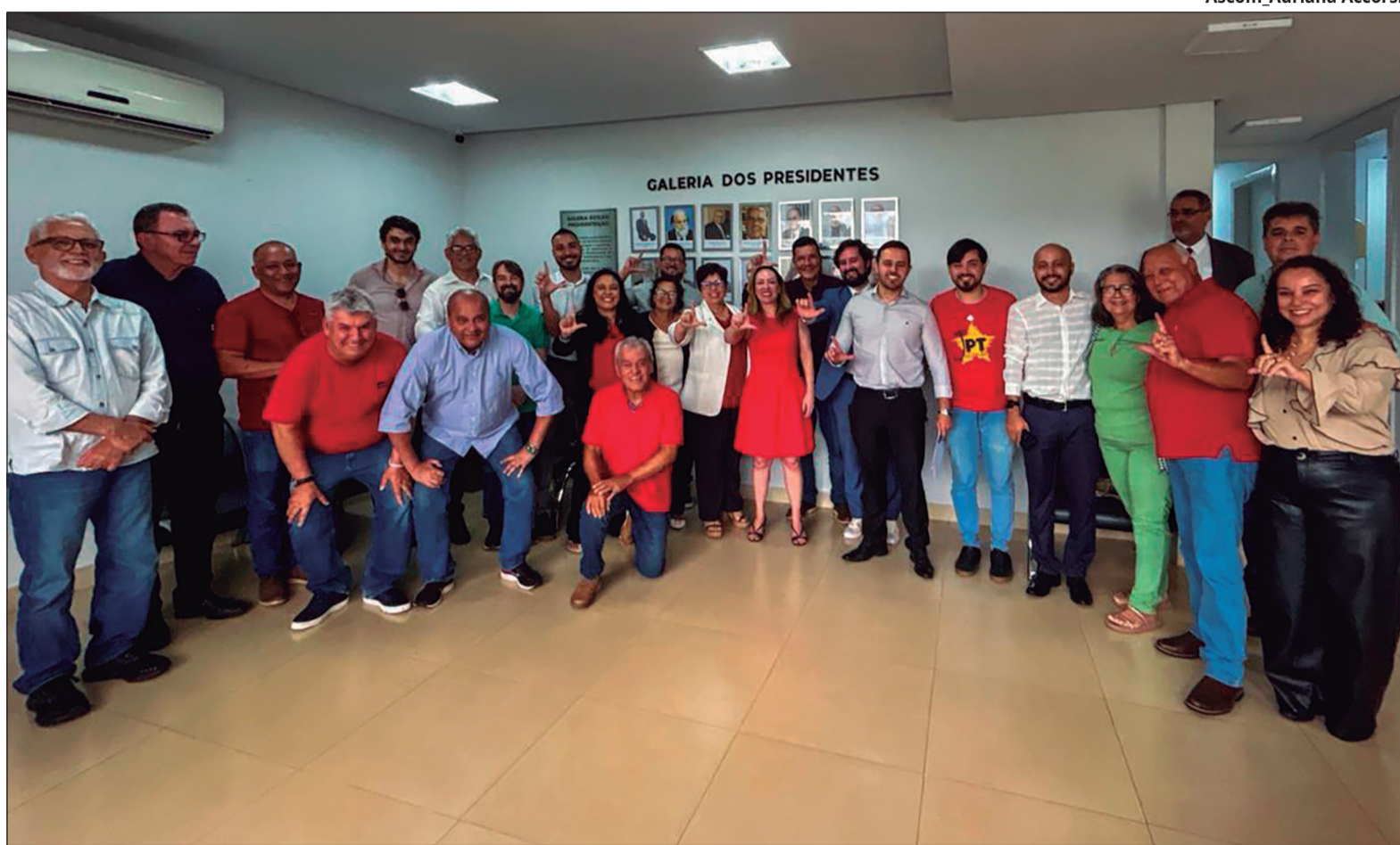
Executiva Estadual do PT durante discussão de nome do pré-candidato a governador de Goiás pela sigla

Especialistas avaliam que um dos grandes problemas do PT goiano é que os membros mais populares e competitivos que compõem o partido optam por concorrer por espaço na Câmara dos Deputados, o que torna mais difícil a escolha de uma alternativa viável para disputar o Executivo estadual.