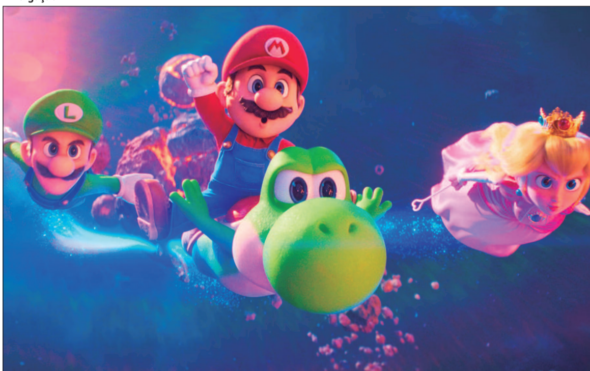
“Super Mario Galaxy Movie” é um filme de animação americano dos gêneros comédia e aventura, baseado no jogo eletrônico Super Mario Galaxy e na franquia de jogos Mario, da Nintendo

Nuremberg (EUA, 2026) Duração: 2h30min. Direção: Ja-