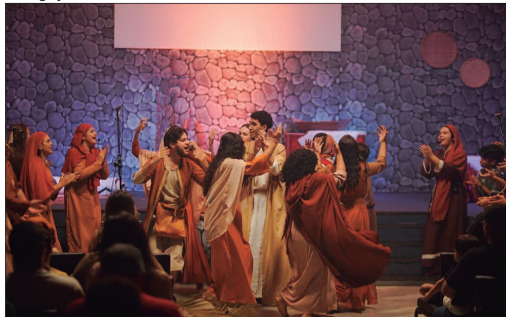
O espetáculo apresenta uma proposta artística no estilo Broadway

o projeto Esparta e Cia. A turma infantil, voltada para participantes de 7 a 11 anos, será realizada das 10h30 às 11h30. Já os adolescentes, de 12 a 15 anos, terão aulas das 18 às 19 horas. São oferecidas dez vagas por turma, e as inscrições devem ser feitas por meio do link disponível no perfil oficial da companhia no Instagram. Durante as oficinas, os participantes terão contato com práticas como acrobacia de solo, acrobacia aérea, malabarismo e equilíbrio, além de jogos coletivos voltados ao desenvolvimento corporal, à criatividade e ao trabalho em equipe. Quando: até 27 de abril. Onde: Esparta Arte e Cultura. Horário: 10h30 às 11h30 e 18h às 19h. Entrada gratuita, disponível no Instagram @ciacorpora-contramao.