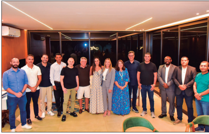
Governadora distrital tem apoio da família Bolsonaro e do ex-governador Ibaneis Rocha