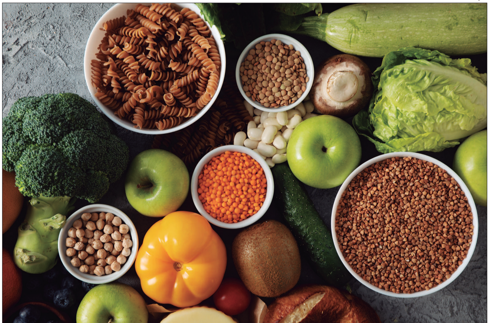
As fibras alimentares exercem funções amplas no organismo, e consumi-las abaixo do recomendado tem consequências sérias

No intestino delgado, as fibras solúveis dificultam a ab-