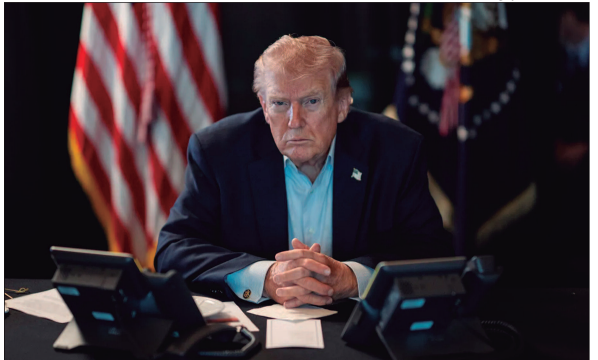
Conselho de Segurança da ONU adia novamente votação sobre medidas para proteger navegação no estreito

sexta-feira (3) e depois remarçada para sábado, a análise foi transferida para a próxima semana diante da falta de consenso entre os membros permanentes do conselho. O texto em discussão prevê que países possam utilizar “todos os meios defensivos necessários” para garantir a segurança de navios que transitam pela região.