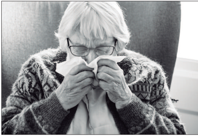
Em idosos com doenças crônicas, infecção pode comprometer ao mesmo tempo a saúde respiratória e cardiovascular