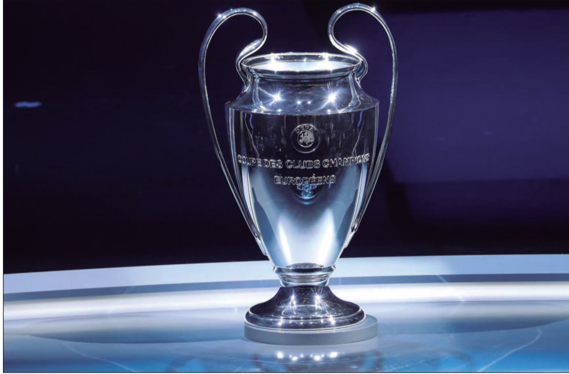
Gigantes se enfrentam em duelos decisivos, com destaque para Real Madrid x Bayern e PSG x Liverpool