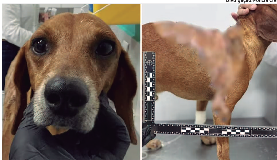
Jhonny teve 40% do corpo atingido, passou por tratamento intensivo e agora seguirá recuperação em casa com nova tutora

O caso aconteceu no dia 5 de março, no Setor Castelo Branco, em Goiânia. Na ocasião, o animal sofreu queimaduras em cerca de 40% da par-