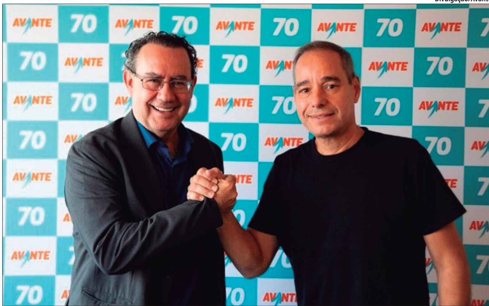
Comunicado foi feito por meio das redes sociais, em publicações nas quais Cury aparece ao lado de Luís Tibé, presidente da sigla

Em nota divulgada nas redes, a sigla escreveu: “O partido Avante anuncia oficialmente o nome de Augusto Cury como pré-candidato à Presidência da República, marcando um novo momento na construção de um projeto nacional pautado no desen-