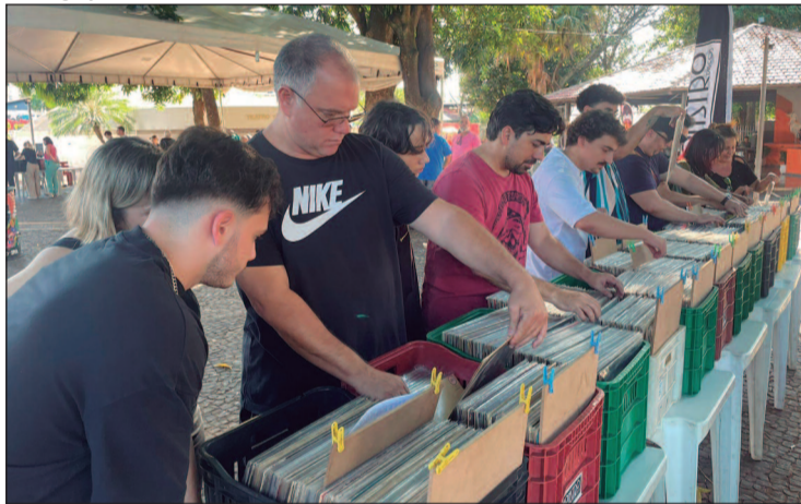
Pesquisas indicam que até 76% dos fãs de vinil da Geração Z compram discos regularmente

cos, Bacural Discos, Bambas Discos, Discos e Afins, Raw Records e Oliveira's Livraria, além de outros expositores.