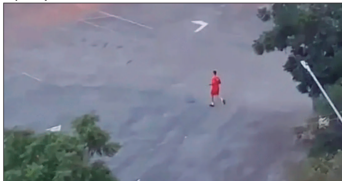
Disparos ocorreram no domingo (5) no estacionamento do Serra Dourada e foram registrados por moradores