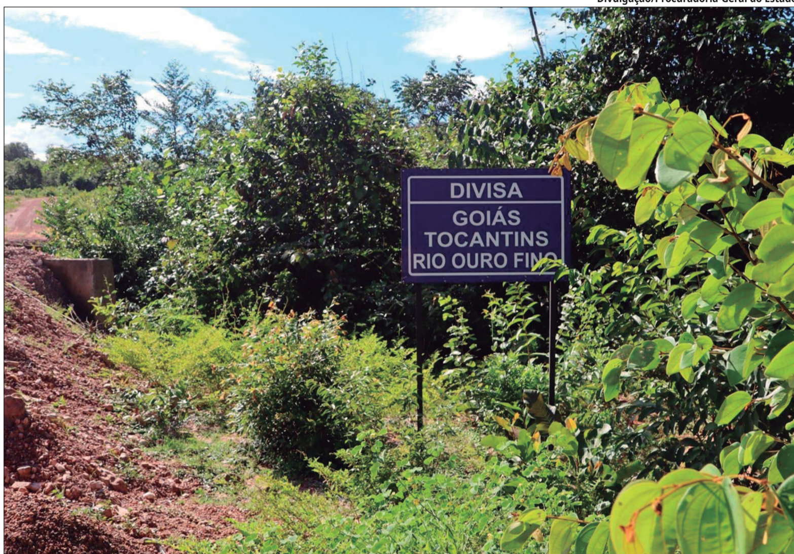
Área abriga o Complexo do Prata e a comunidade Kalunga dos Morros, que enfrenta incertezas sobre serviços e pertencimento territorial

De acordo com as fontes documentais, a raiz do conflito não é política, mas técnica. A Procuradoria-Geral do Estado de Goiás (PGE-GO) sustenta que a ocupação tocaninense na área decorre de um erro de toponímia na Carta Topográfica "São José", elaborada pela Diretoria de Serviço Geográfico (DSG) do Exército Brasileiro em 1977. Naquele documento, o Rio da