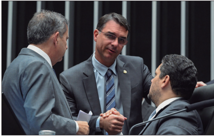
Discussão opõe ala ligada ao Centrão e grupo mais ideológico na pré-campanha presidencial do senador do PL