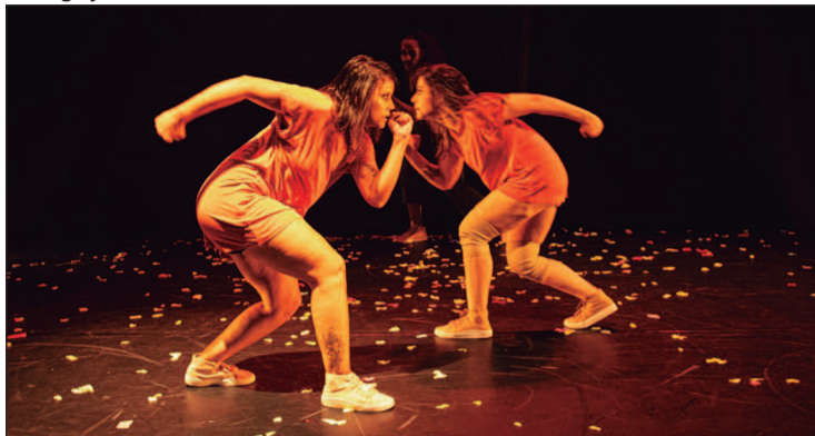
Os artistas vão convidar as pessoas a brincar de amarelinha

Av. T-1, 1698 - St. Bueno, Goiânia. Horário: 17h. Entrada gratuita.