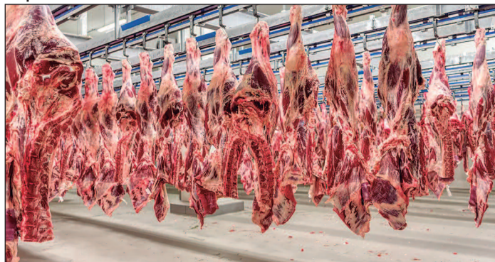
Especialistas avaliam que cenário pode pressionar demanda externa e fortalecer exportações