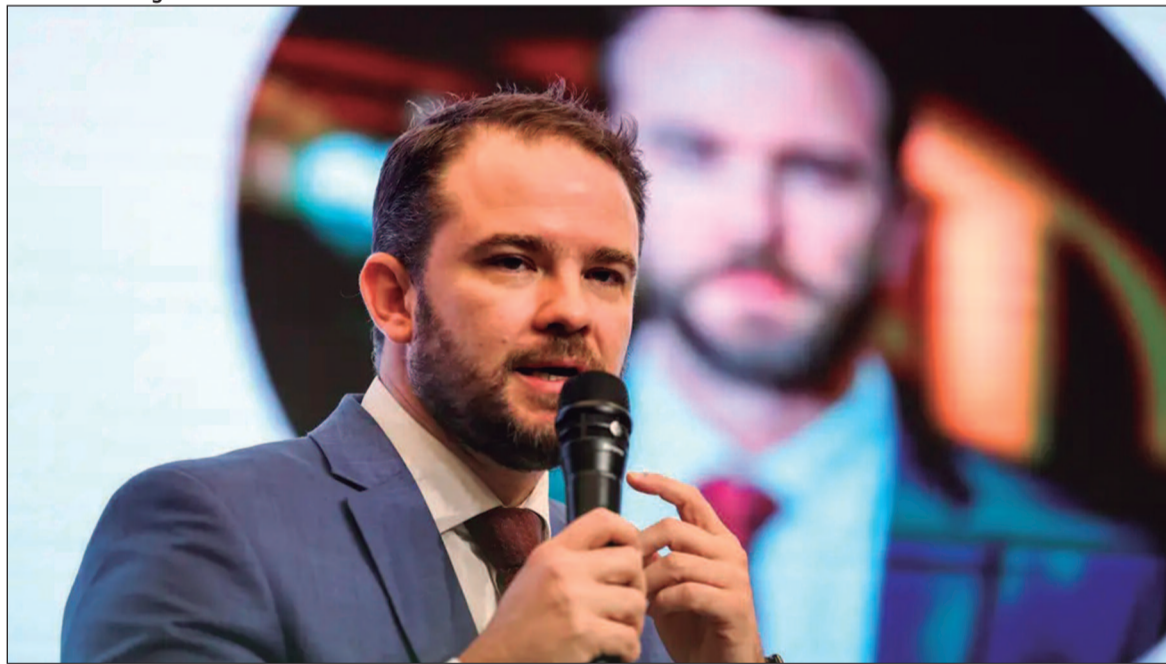
Medida para conter a alta do preço do gás de cozinha terá duração de dois meses e pode ser prorrogada

O governo federal anunciou nesta segunda-feira (6) um apoio financeiro aos importadores de Gás Liquefeito de Petróleo (GLP). O GLP, também conhecido como gás de cozinha ou gás de botijão, é destinado principalmente ao uso doméstico. O pagamento da subvenção será de R$ 850 sobre cada tonelada de GLP, com o custo de R$ 330 milhões.