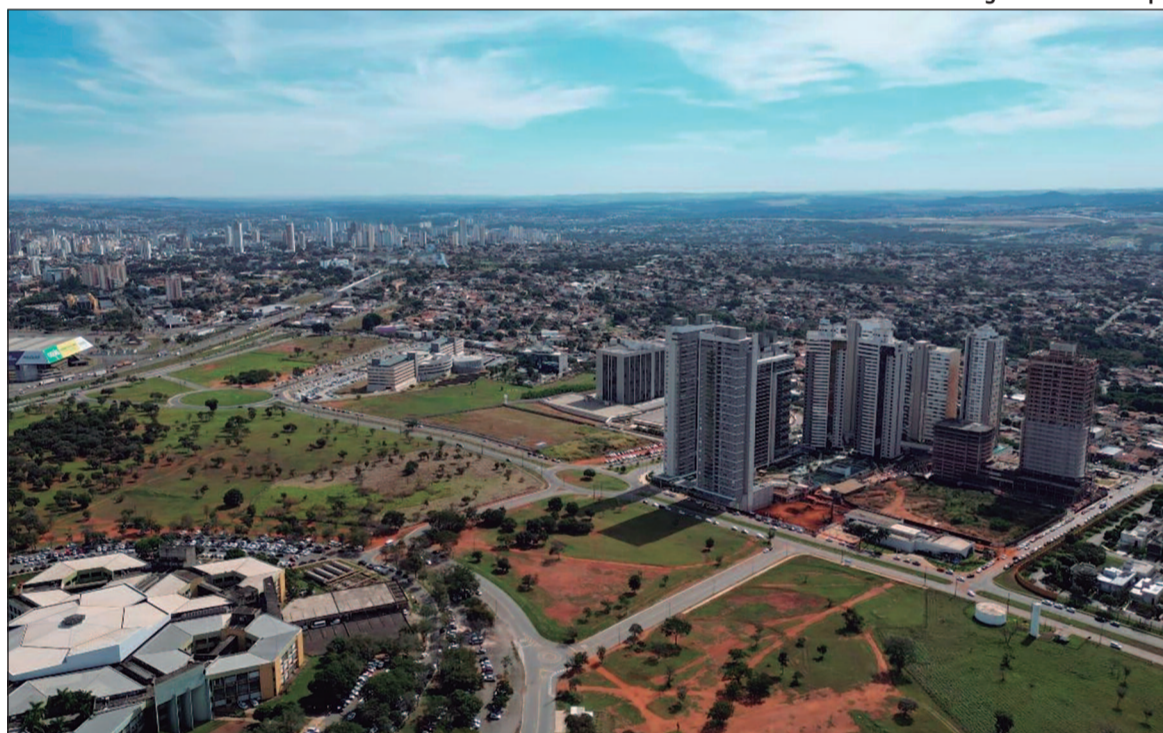
Segundo especialista, construção de viaduto pode aumentar ocupação e adensamento

De acordo com o projeto, a intervenção prevê uma reconfiguração da estrutura atual da GO-020. As seis pistas da rodovia serão rebaixadas no trecho central, formando uma