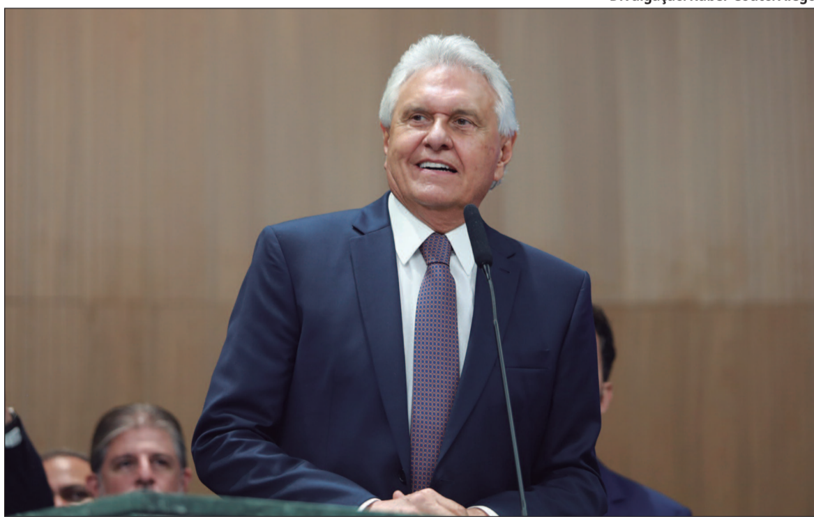
Em São Paulo, Caiado marcará presença na terça-feira no 68º Congresso Nacional dos Municípios

Fato é que o ex-chefe do Executivo goiano começa a colocar em prática sua pré-campanha. O ex-governador irá intensificar as agendas nacionais, numa estratégia que visa