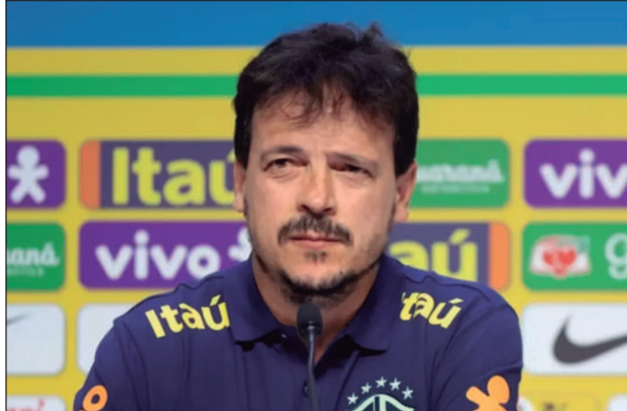
Treinador assume após saída de Dorival e assina até o fim de 2026