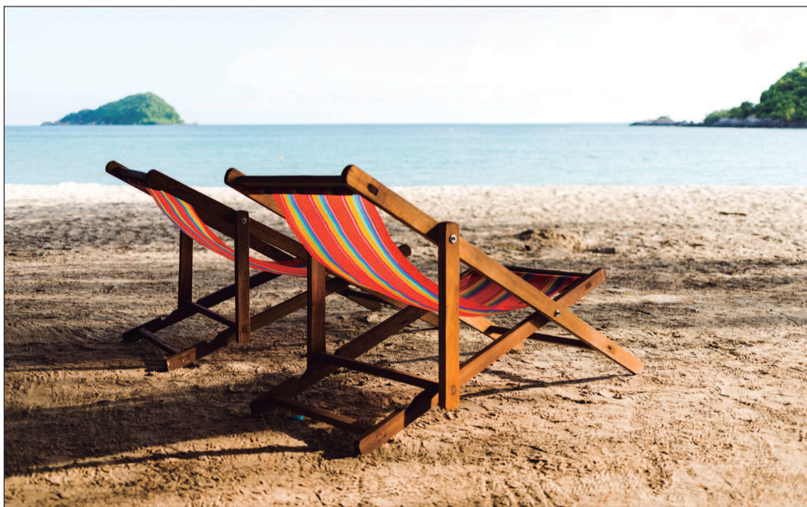
Fungos não sobrevivem facilmente no material das cadeiras de praia

Além da candidíase vaginal, o excesso de umidade pode comprometer a flora local e aumentar a sensibilidade da região íntima, facilitando irritações e outros processos infecciosos. Pessoas com imunidade baixa, diabetes ou que fizeram uso recente de antibióticos tendem a apresentar risco ainda maior. Apesar dis-