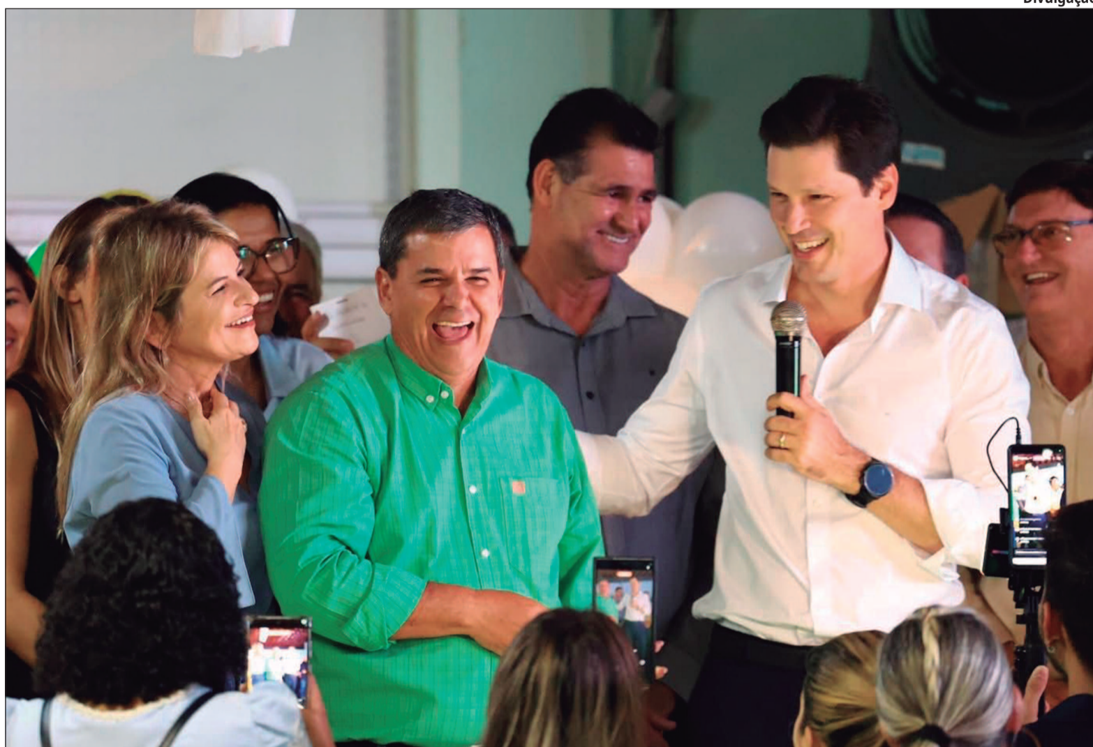
“A relação sólida que os líderes políticos deste Estado têm com a deputada Flávia e o deputado George é fruto de muito trabalho”, afirma Daniel

O governador Daniel Vilela ressaltou a trajetória e a dedicação dos parlamentares e destacou o reconhecimento popular construído ao longo dos anos. “A relação sólida que os líderes políticos deste Estado têm com a deputada Flávia e o deputado George é fruto de