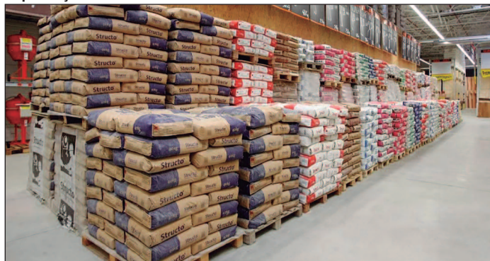
Construção tem alta de 1,77% no custo com diesel mais caro