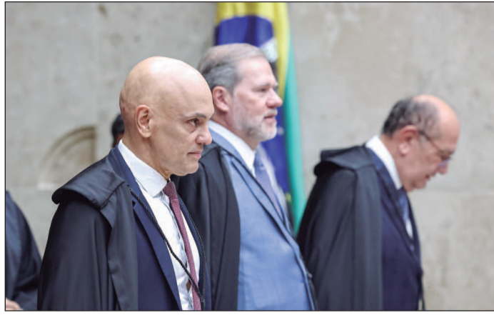
Processo discute limites, validade e aplicação de acordos