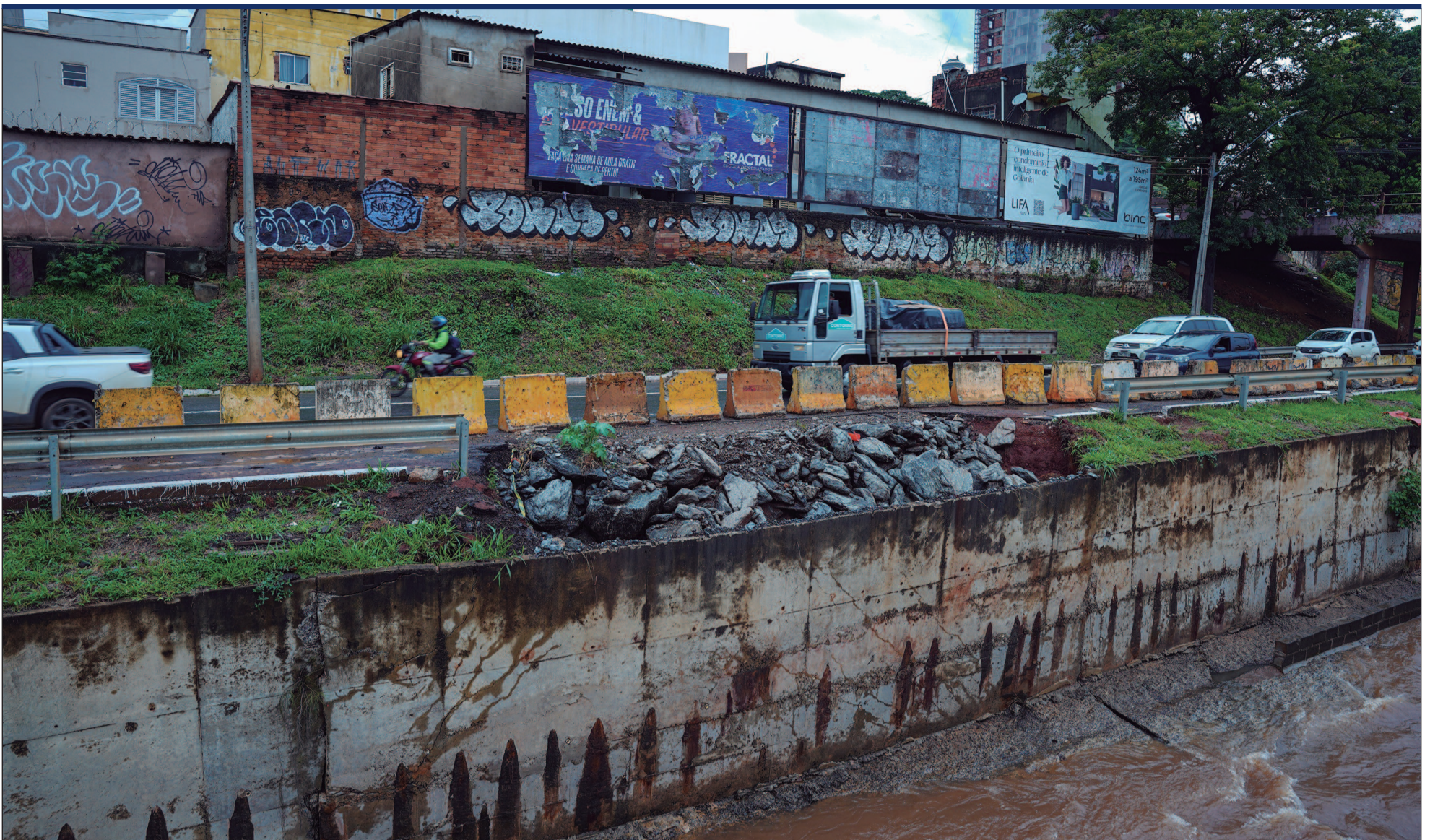
Problema expõe fragilidades estruturais da Marginal Botafogo e aumenta o risco de acidentes