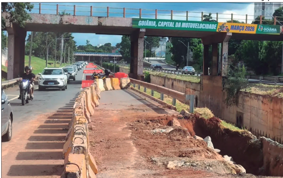
Sem solução definitiva, motoristas enfrentam transtornos e convivem com intervenções paliativas

Desde a abertura da cratera, novas rachaduras, trincas e desníveis no solo continuam sendo observados no local, indicando que o problema não está estabilizado. A cada episódio de chuva, mesmo com o período chuvoso se aproximando do fim, há registros de agravamento da erosão, o que reforça a sensação de insegurança entre os motoristas. Especialistas apontam que a de-