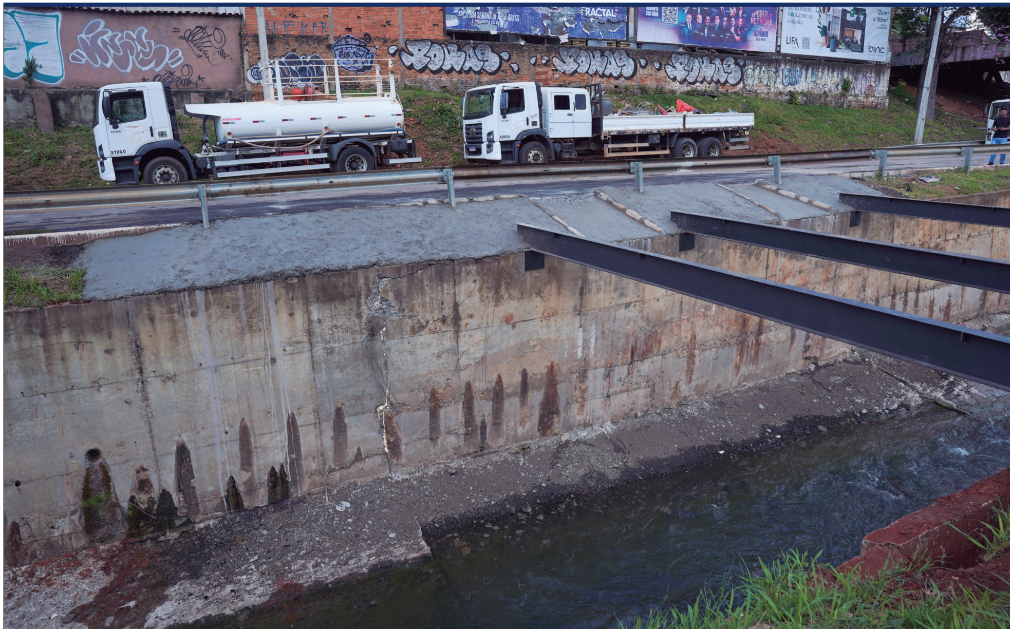
Trecho entre a Rua 21 e a Rua 10 foi interditado para reconstrução de estrutura comprometida por erosão na Marginal Botafogo