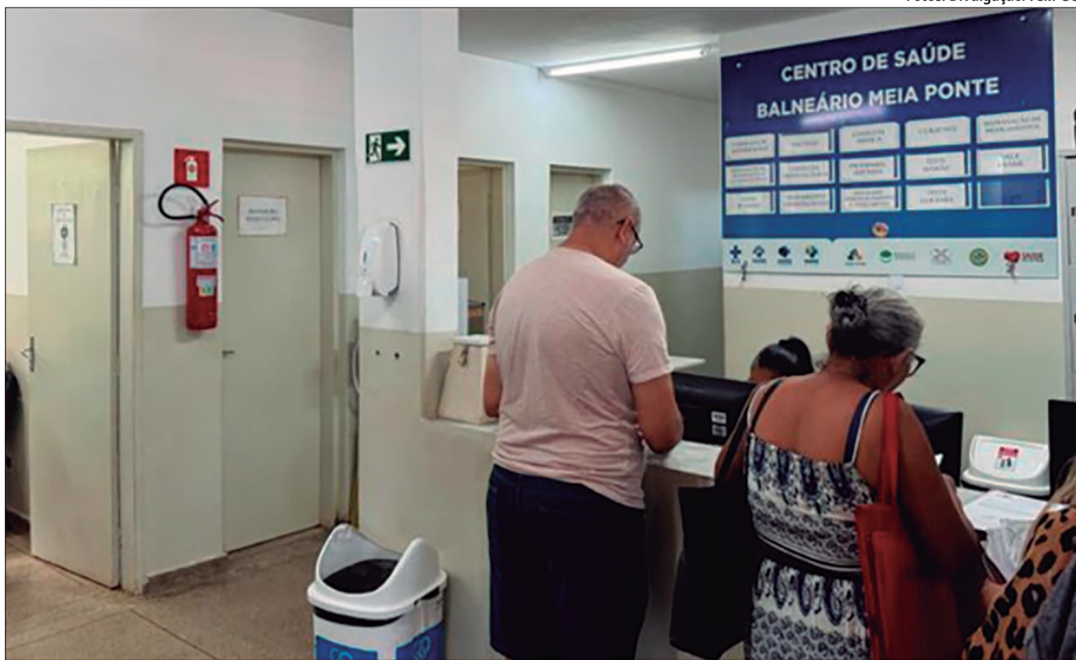
As medidas mais urgentes concentram os principais atrasos e evidenciam falhas na oferta de profissionais, insumos e organização das unidades

Por outro lado, as medidas mais urgentes, aquelas que afetam diretamente o funcionamento dos serviços, estão entre as que tiveram prazo vencido. Entre os principais