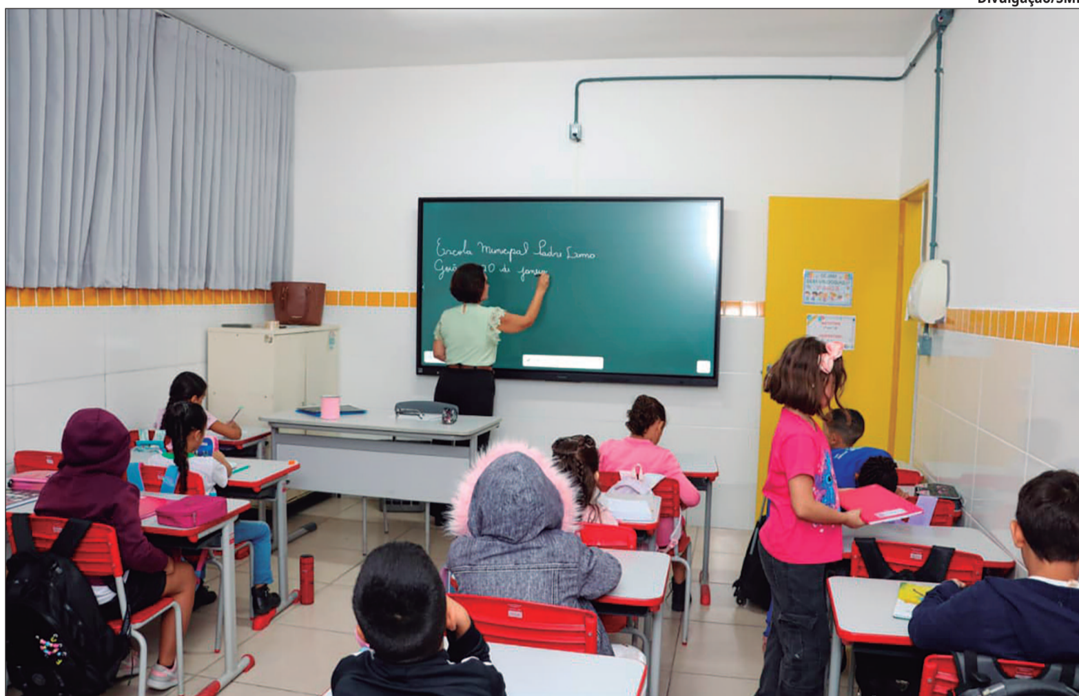
Especialista avalia que existe uma ilegalidade clara na não nomeação dos candidatos aprovados no concurso