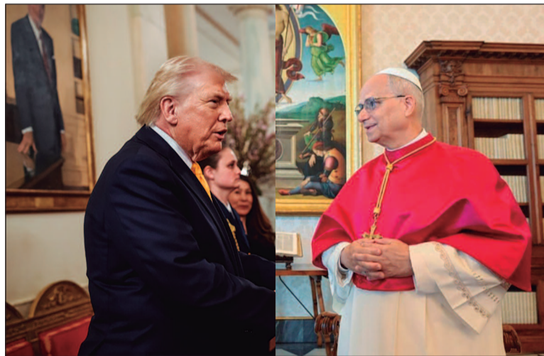
Presidente dos Estados Unidos critica pontífice, que responde ao afirmar que não teme governo Trump

Sem mencionar diretamente o presidente em suas primeiras declarações, o pontífice