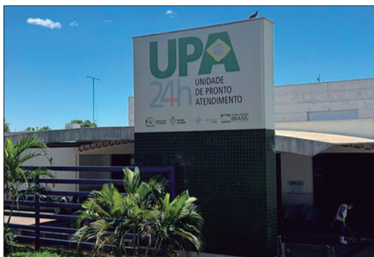
Apesar de a maioria das ações estarem em andamento, relatório alerta que número pode gerar leitura equivocada da situação

problemas apontados está a falta de profissionais de saúde, como técnicos de enfermagem, farmacêuticos e equipes completas para atendimento nas unidades básicas.