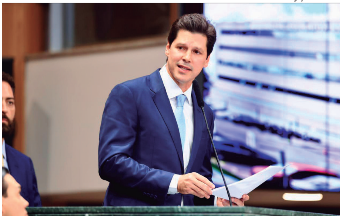
Para a disputa na Alego, MDB é tratado como franco favorito a ter a maior bancada do Legislativo