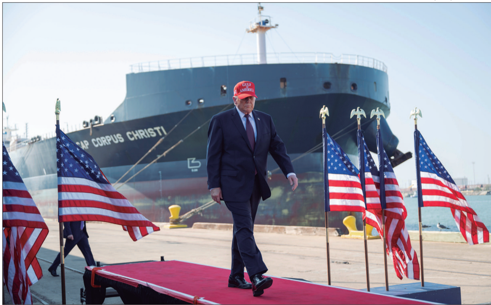
Navios ligados ao Irã passam a ser barrados na rota marítima após bloqueio militar imposto pelos EUA

O anúncio foi acompanhado de um endurecimento no discurso do presidente Donald Trump, que afirmou que forças dos Estados Unidos agirão de forma imediata contra qualquer aproximação considerada hostil. “Aviso: Se algum desses navios (iranianos) se aproximar do nosso BLOQUEIO, será imediatamente ELIMINADO, usando o mesmo sistema de