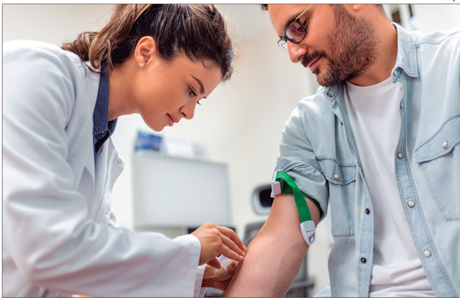
Os pesquisadores aproveitaram amostras de sangue já coletadas durante um estudo sobre Covid-19

Os pesquisadores aproveitaram amostras de sangue já coletadas durante um estudo