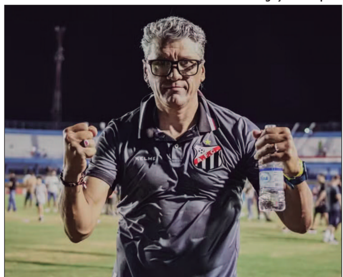
Treinador deixa o comando do Galo da comarca após sua segunda passagem pelo clube