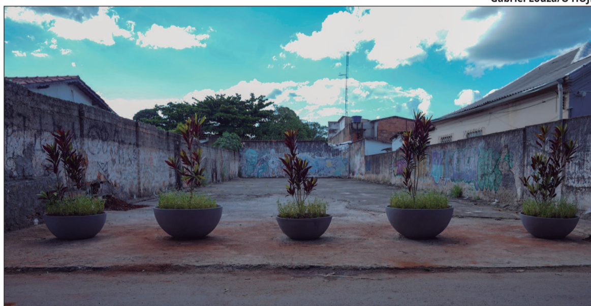
Vasos de plantas foram colocados no local histórico após vídeo mostrar carros estacionados na área onde começou o acidente radiológico de 1987