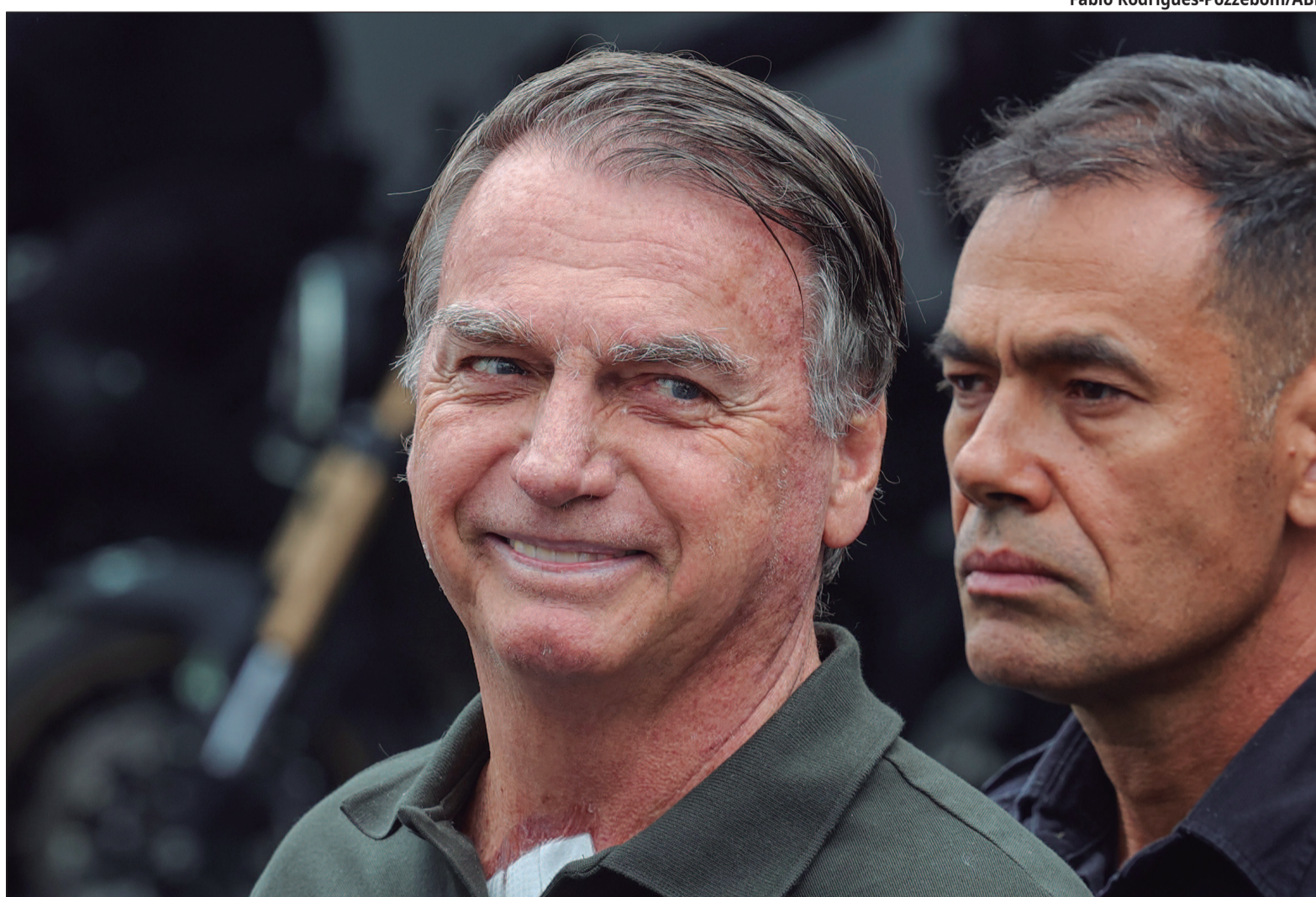
O inquérito teve início em 2020, após a saída do então ministro da Justiça, Sergio Moro

a aposentadoria de Celso de Mello no STF, o processo passou para a relatoria de Moraes. Ainda em 2020, o ministro suspendeu a nomeação do delegado Alexandre Ramagem