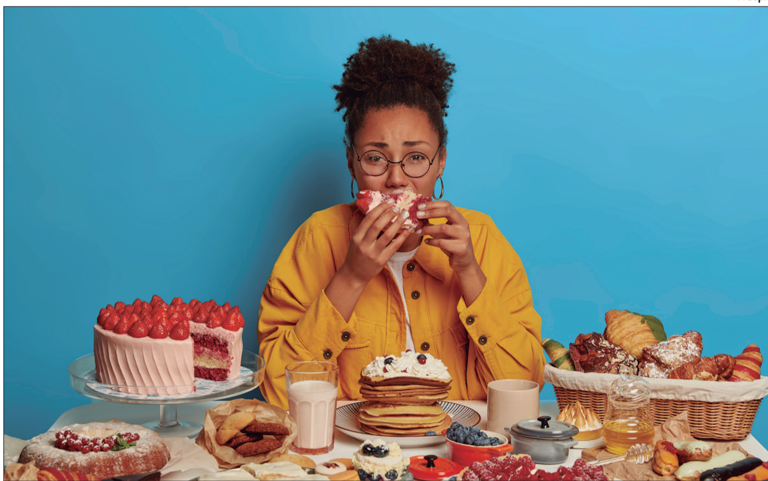
O órgão comporta entre 1 e 1,5 litro de alimento sem causar danos ou desconforto significativo

Outro ponto de atenção é a possibilidade de broncoaspiração, quando o conteúdo vom-