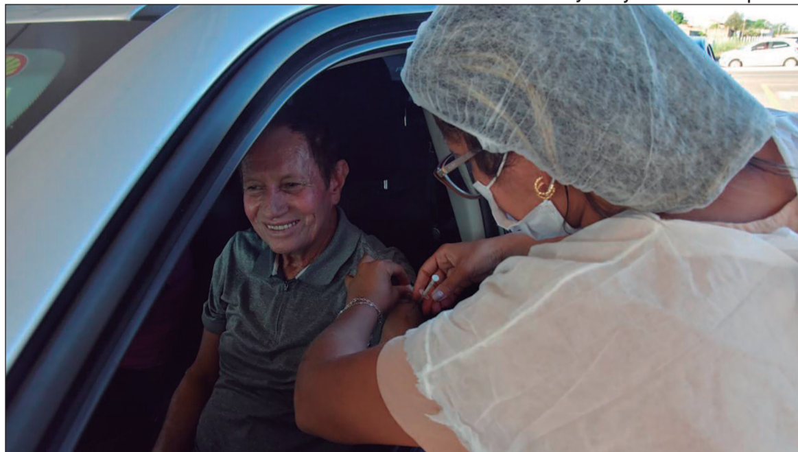
Estratégia busca elevar cobertura vacinal entre grupos prioritários e reduzir casos graves de síndromes respiratórias no município

A decisão ocorre diante da necessidade de aumentar a cobertura vacinal no município. Até o último balanço da campanha, Aparecida aplicou 25.195 doses da vacina contra a gripe, número que corresponde a apenas 23% do público-alvo estimado em 109.557 pessoas. O índice também se repete entre os grupos prioritários, como idosos, crianças e gestantes, percentual ainda distante da meta