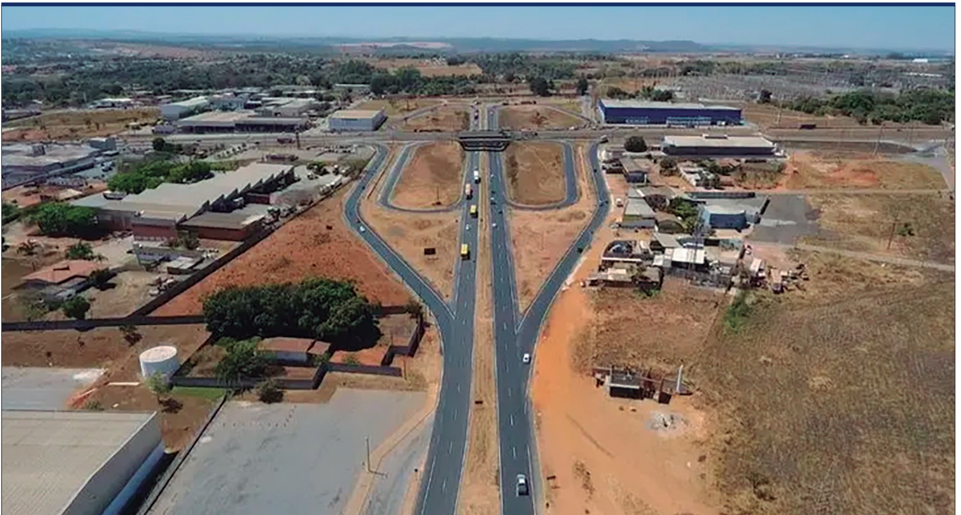
Projeto possui orçamento estimado em R$ 948 milhões e será financiado pelo Programa de Aceleração do Crescimento, do governo federal