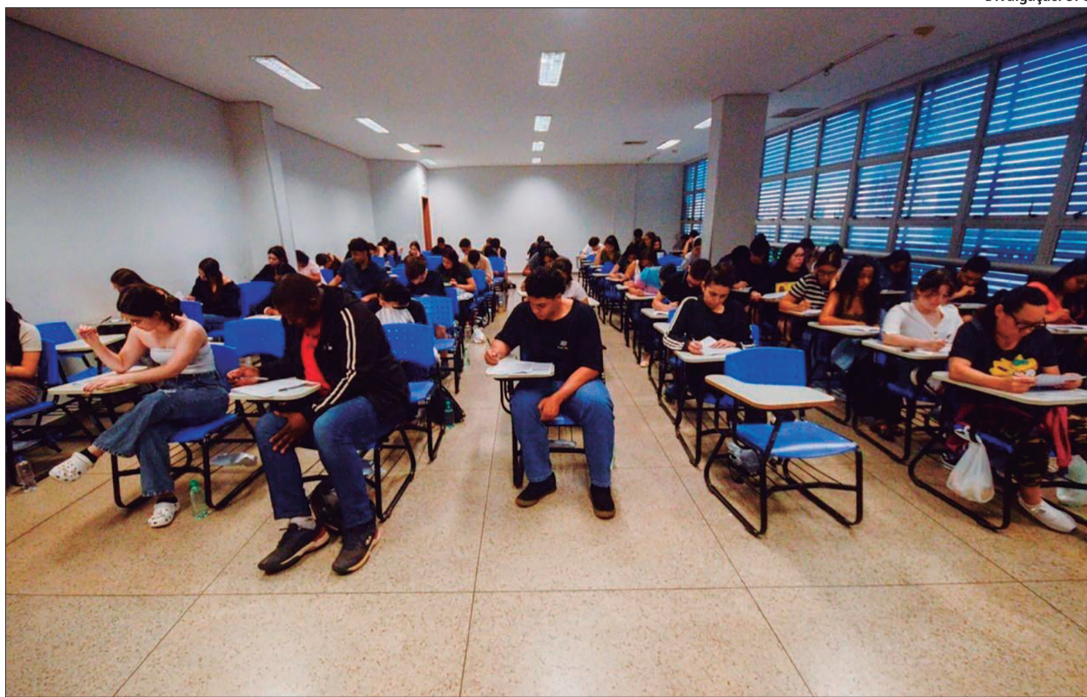
Conselho Nacional de Educação prepara diretrizes para todo o País

“A recomendação prática é simples: o estudante deve declarar o uso. A boa prática