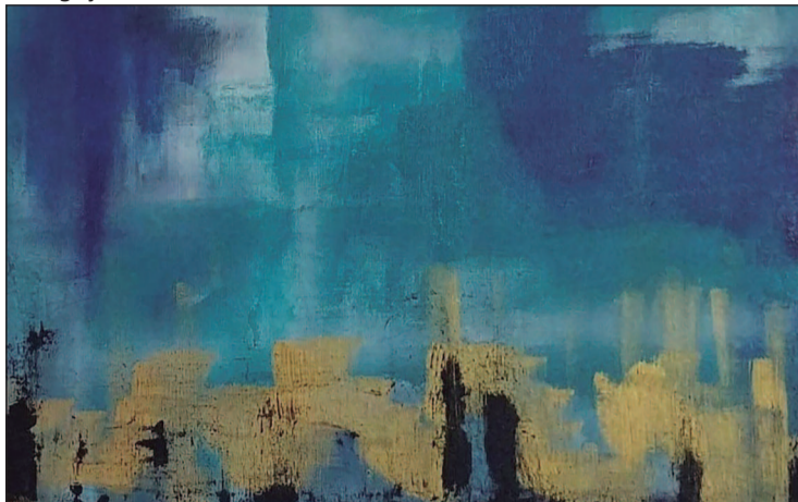
A exposição tem a curadoria do artista Pedro Galvão