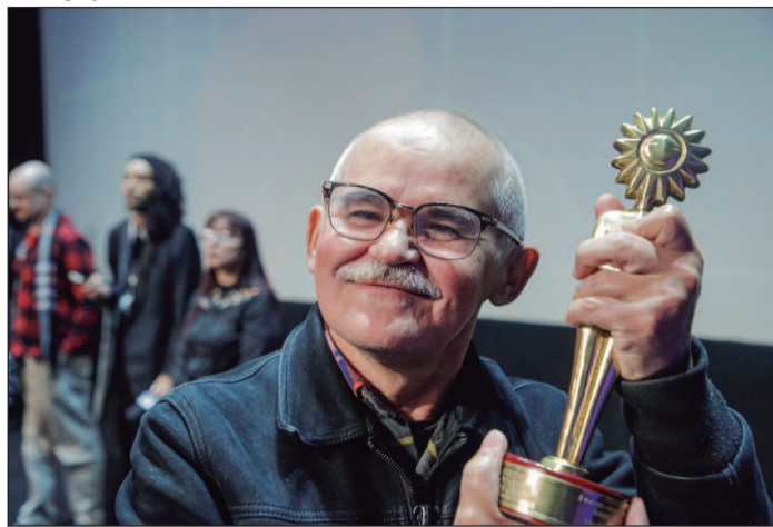
A narrativa questiona até onde uma pessoa é capaz de ir