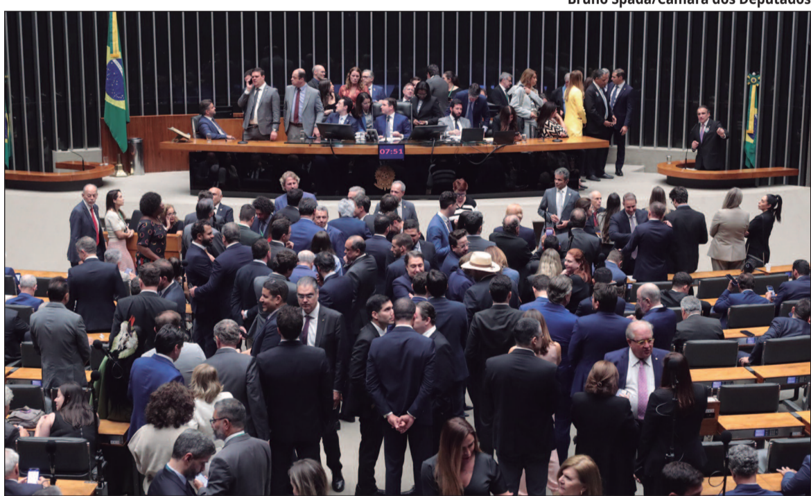
Bruno Spada/Câmara dos Deputados

A oposição aposta em uma vitória ampla. A expectativa é de mais de 300 votos pela derrubada, número parecido com o da aprovação do projeto, em