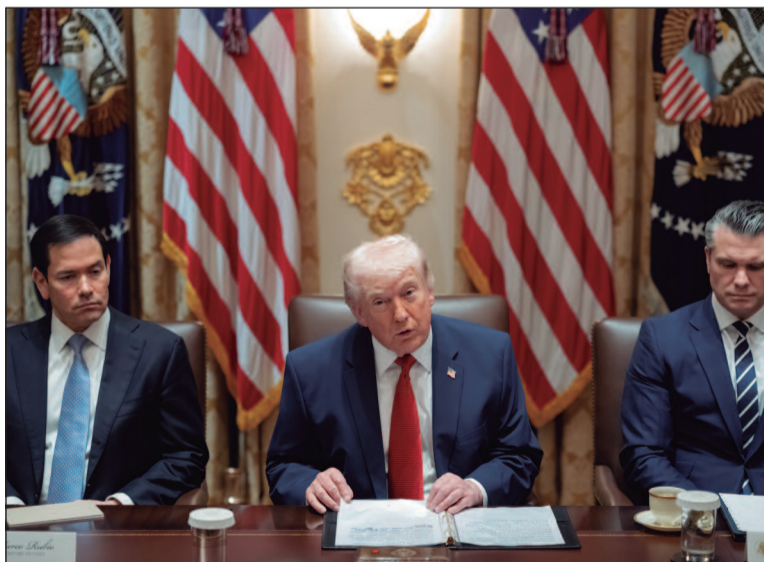
Documento enviado pelo governo iraniano prevê a reabertura do estreito, mas adia o debate nuclear

O adiamento do debate sobre o enriquecimento de urânio, uma das principais exigências de Washington, é vista como um obstáculo para o avanço do acordo. Ainda, Trump sinalizou também que não pretende abrir mão da pressão militar e econômica sobre Teerã. Em entrevista à Fox News, o presidente afirmou que está "sufocando as exportações de petróleo" iranianas na expectativa de for-