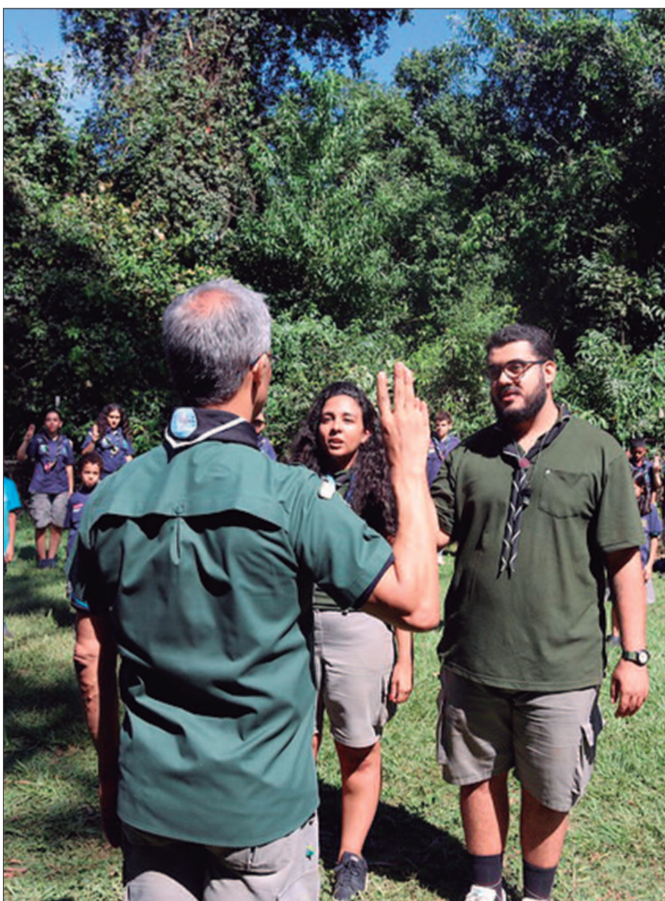
Integrantes de diferentes gerações do Grupo Escoteiro Rudyard Kipling durante atividade coletiva que reforça convivência, trabalho em equipe e conexão com a natureza

A progressão é medida por competências. Os escotistas adultos acompanham avanços e fragilidades de cada jovem, propondo que ele assuma, gradualmente, a responsabilidade pelo próprio desenvolvimento.