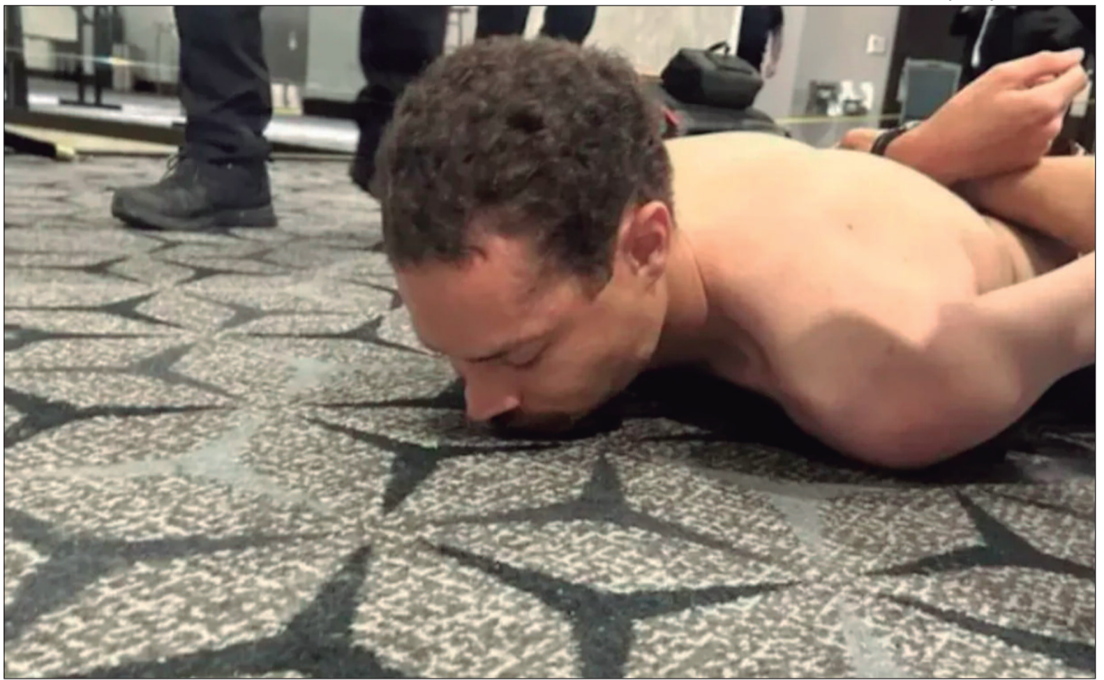
O suspeito de 31 anos é mantido sob custódia após audiência inicial em tribunal federal de Washington

Segundo a promotoria, o ataque foi planejado. O suspeito teria viajado até a capital norte-americana carregando uma espingarda, uma pistola e três facas. A intenção, conforme descrito em audiência, era realizar um "assassinato político". Além da tentativa de