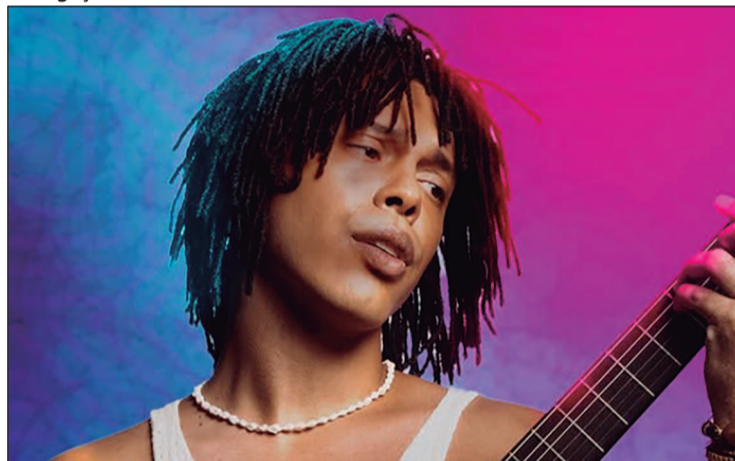
O repertório reúne canções emblemáticas

ros e pela identidade própria. Ao longo dos anos, construiu uma discografia extensa, com sucessos que atravessaram gerações e garantiram reconhecimento nacional e internacional.