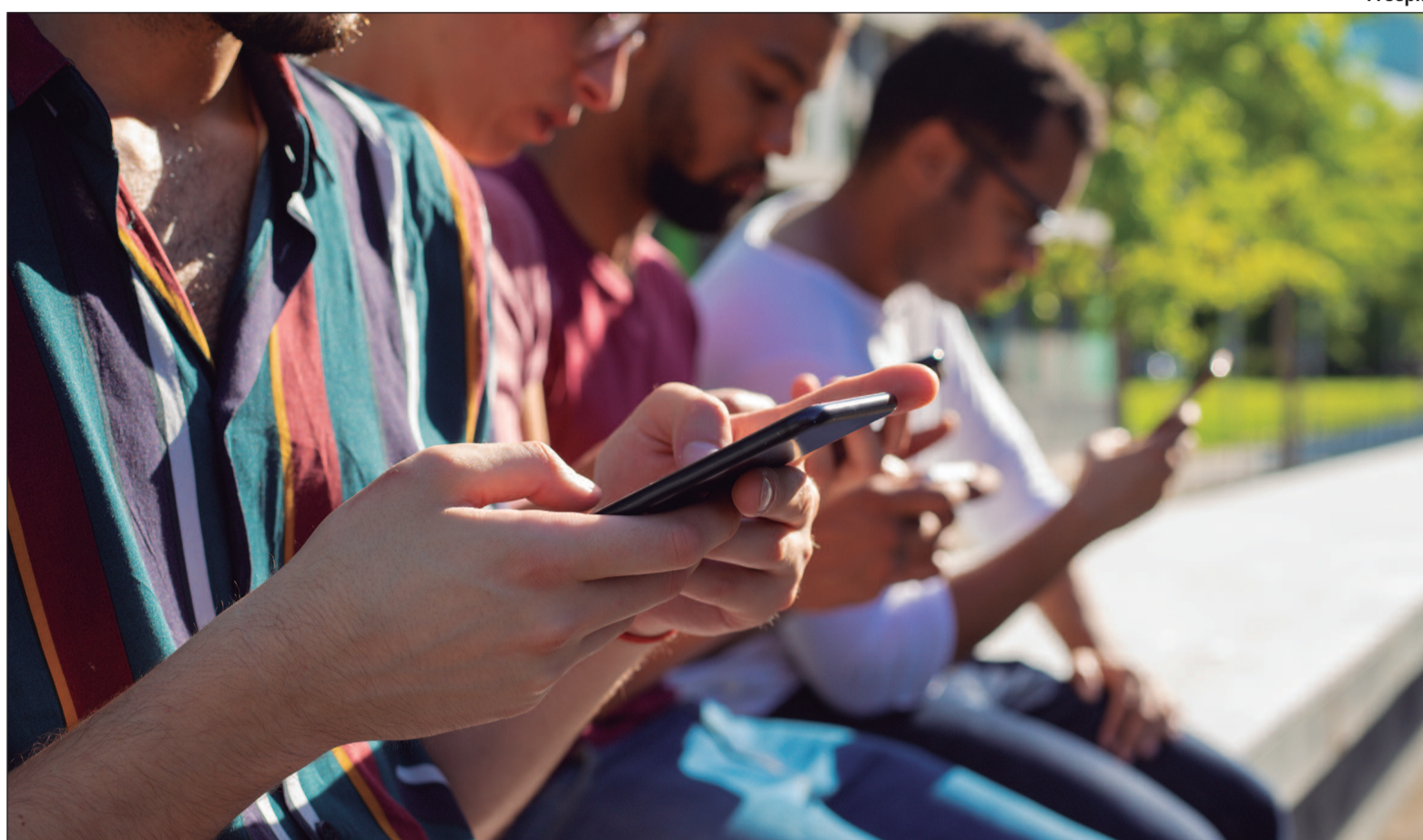
1,8 milhão de jovens se cadastraram no Ashley Madison em 2022

Segundo o estudo, mais de 1,8 milhão de jovens dessa faixa etária se cadastraram no Ashley Madison em 2022. Desse total, mais de 240 mil eram brasileiros.