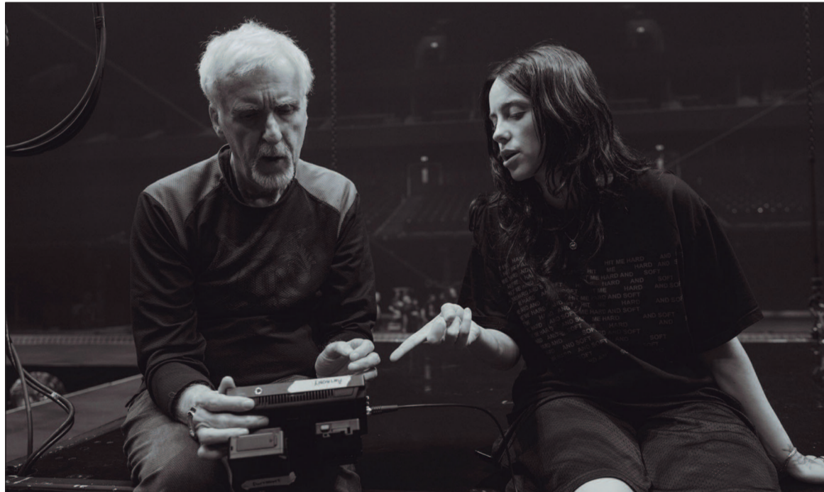
Cantora vencedora do Grammy, Billie Eilish apresenta seus sucessos durante sua turnê mundial com ingressos esgotados em “Billie Eilish - Hit Me Hard and Soft: The Tour”