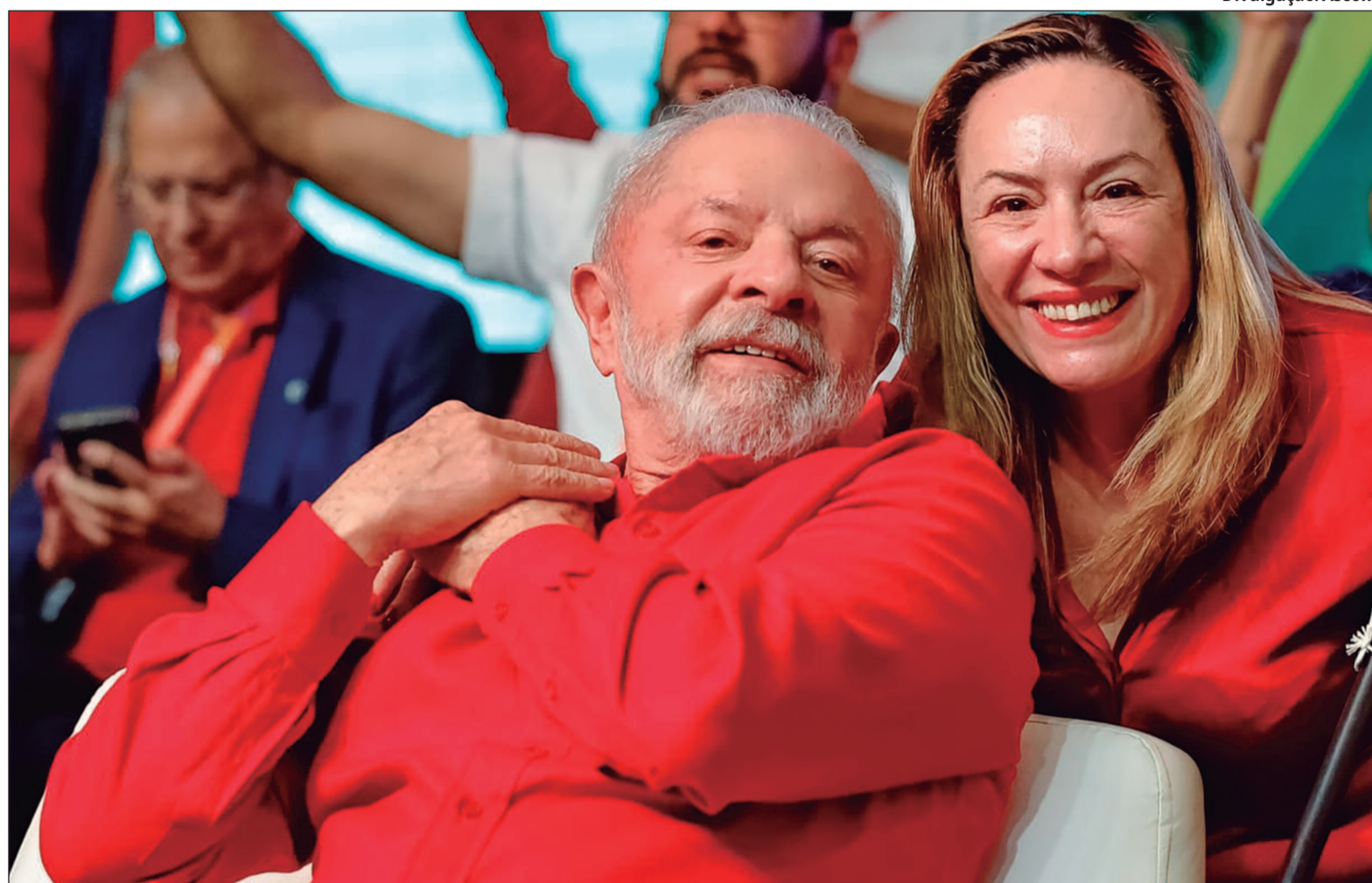
Lula da Silva convidou Adriana Accorsi para uma conversa em Brasília e demonstrou apoio pelo nome da deputada ao governo

Pacheco tem condicionado sua pré-candidatura ao Governo de Minas Gerais em 2026 ao envolvimento direto do presidente na construção do projeto. Aliados do ex-presidente do Senado avaliam que Pacheco só entrará na disputa se houver garantia de entrosamento com o Palácio do Planalto e participação ativa de Lula na campanha.