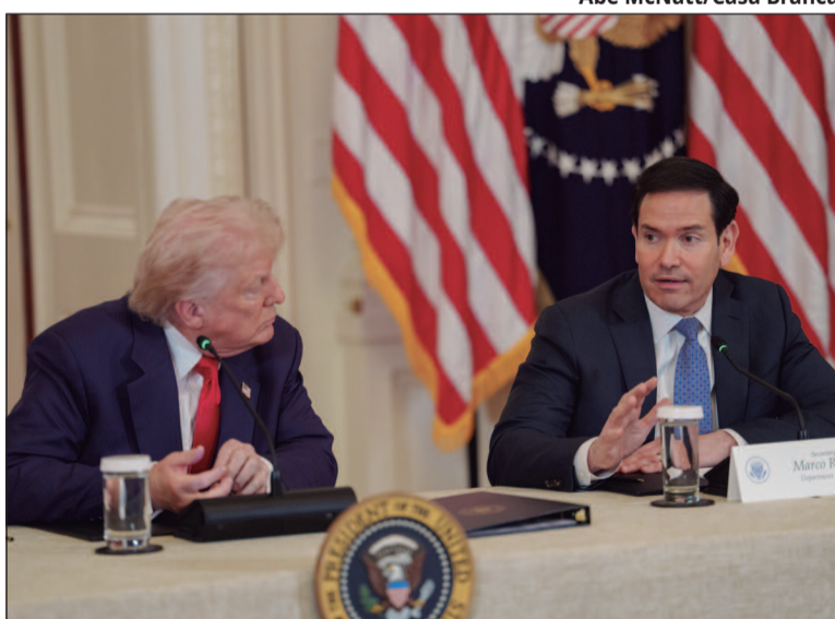
Abe McNatt/Casa Branca

Mesmo assim, os parlamentares questionam o uso da legislação antiterrorismo pelo governo Trump. Segundo o texto, há preocupação com a “instrumentalização das de-