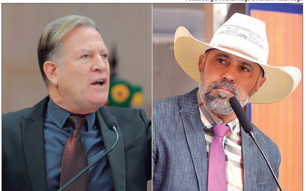
Bate-boca durante a sessão foi só o ápice de um desentendimento que se arrasta há meses na legenda

Araújo e Prado são aliados de Wilder. Já Amauri era base do ex-governador Ronaldo Caiado (PSD) e mantém proximidade com o governador Daniel Vilela (MDB). Antes de se filiar aos liberais, era do União Brasil. Chegou ao PL alinhado ao deputado federal e pré-candidato ao Senado Gustavo Gayer (PL), líder da ala do par-