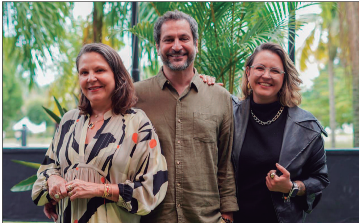
FARGO consolida Goiânia como ponto de encontro das artes visuais

e se estende para relações de médio e longo prazo, impulsionando negócios, parcerias e a circulação de artistas."