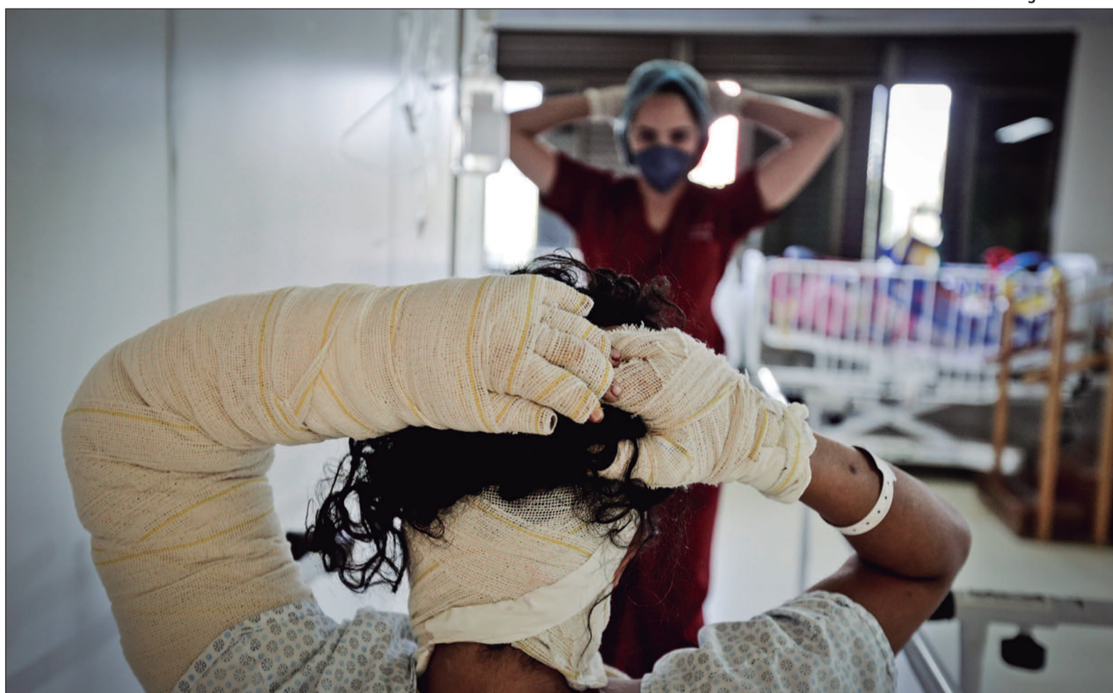
Crianças representam parte significativa dos atendimentos por queimaduras registrados no Hugol em 2026