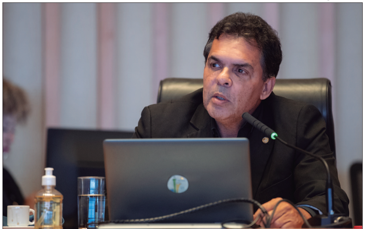
Avanço acelerado das apostas esportivas on-line e dos jogos de azar digitais acendeu alerta no DF

A escolha do mês de março, segundo o projeto, busca dialogar com campanhas voltadas à saúde mental e ao bem-estar emocional para ampliar o alcance das ações de conscientização.