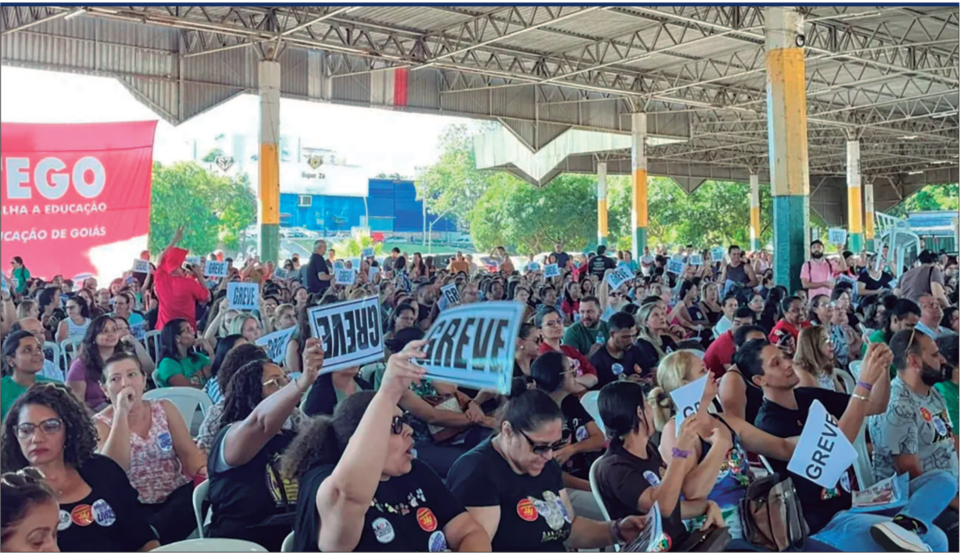
Categoria afirma que greve é resultado de anos de reivindicações acumuladas e promessas não cumpridas pela gestão municipal