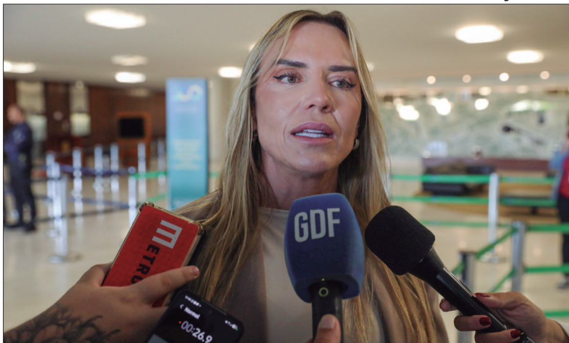
GDF anuncia medidas voltadas à ampliação do atendimento e redução das filas de espera

A ampliação das equipes médicas ocorre em um momento em que o DF busca re-