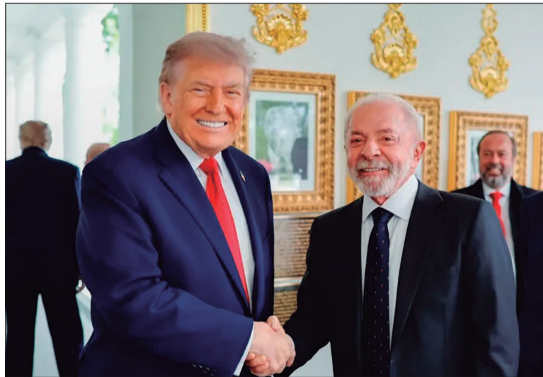
Encontro de Lula com Trump em Washington terminou com promessa de continuidade das negociações

A conversa aconteceu sem participação do chanceler Mauro Vieira ou integrantes da assessoria internacional do Palácio do Planalto. Segundo relatos feitos por Joesley a interlocutores, Trump atendeu rapidamente e demonstrou disposição em receber o presidente brasi-