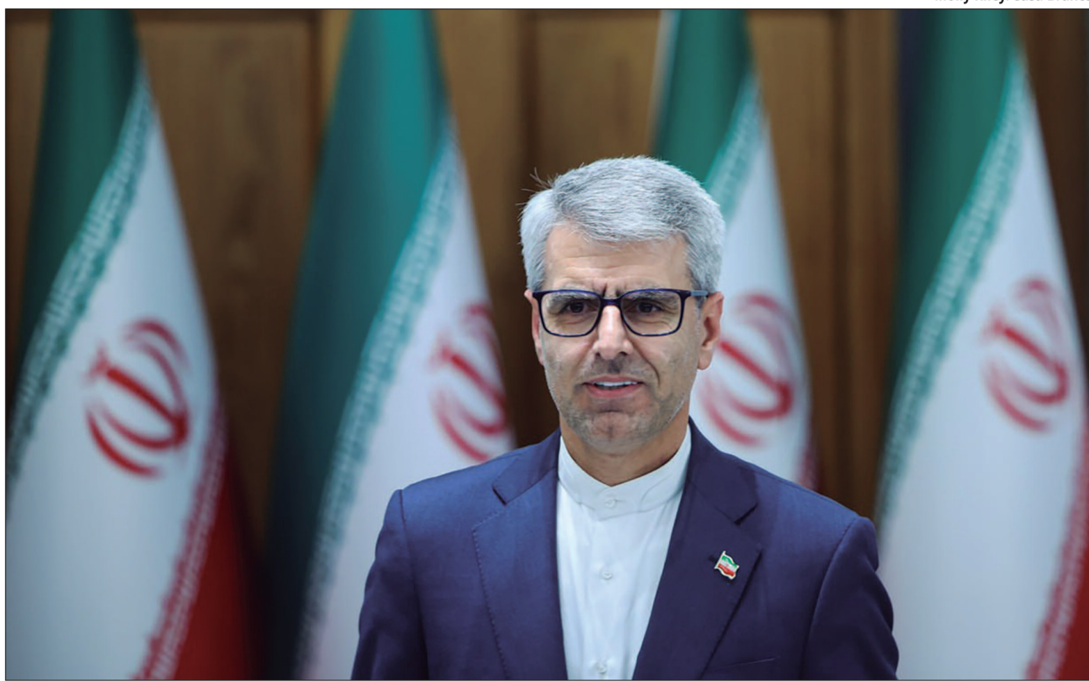
Presidente norte-americano afirma que trégua firmada entre os países está "respirando por aparelhos"

suir "o melhor plano de todos os tempos" para encerrar o conflito e voltou a afirmar que o principal objetivo norte-americano é impedir que o Irã desenvolva armas nucleares. "Eu tenho um plano — sabe, é um plano muito simples, não sei por que você não diz isso como é, o Irã não pode ter uma arma nuclear", afirmou.