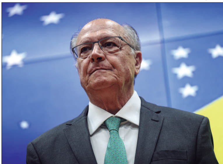
Geraldo Alckmin afirma que em duas semanas ‘esclarecimentos vão ser dados’

O veto europeu foi anunciado na terça-feira (12) e está relacionado às exigências da UE sobre o controle do uso de antimicrobianos na pecuária. O Brasil ficou fora da lista validada pelos países do bloco europeu com as nações consi-