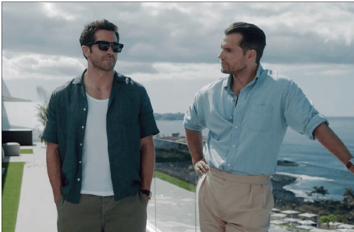
Em “Na Zona Cinzenta”, dois especialistas em resgate precisam encontrar uma rota de fuga para uma negociadora que possui milhões em dinheiro roubado na conta

Simon McQuoid. Elenco: Karl Urban, Jessica McNamee, Hiroyuki Sanada. Gênero: Ação/Aventura. Cinemark Passeio das Águas: 15h50, 18h50, 21h40. Moviecom Buriti: 16h40, 19h10, 21h40. Cinemark Flamboyant: 15h20, 15h50, 18h30, 18h50, 21h40. Kinoplex Goiânia: 13h00.