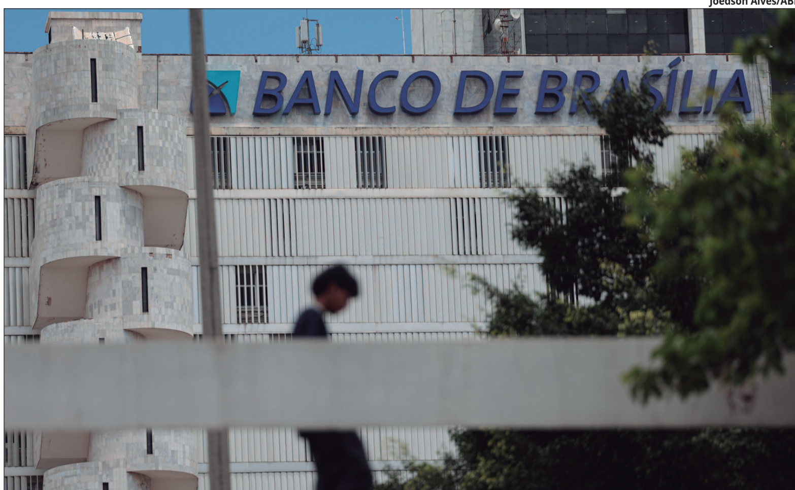
A crise ganhou ainda mais repercussão após operações relacionadas ao Banco Master

A governadora também tem buscado transmitir segurança aos correntistas e ao mercado. Em declarações recentes, afir-