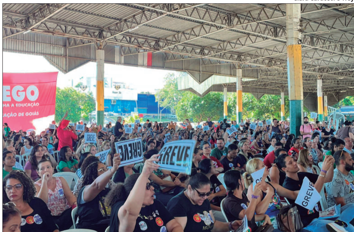
Trabalhadores afirmam que acordos firmados desde 2022 não foram cumpridos e cobram valorização profissional