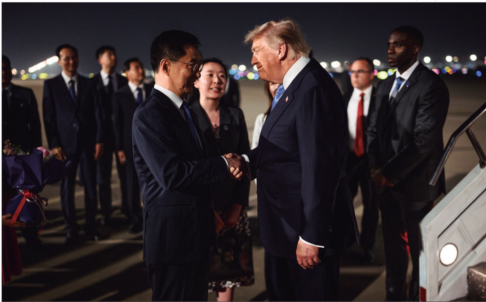
Elon Musk, Tim Cook e Jensen Huang integram a comitiva empresarial levada por Trump em visita à China

Antes da viagem, Trump afirmou que pretende pedir