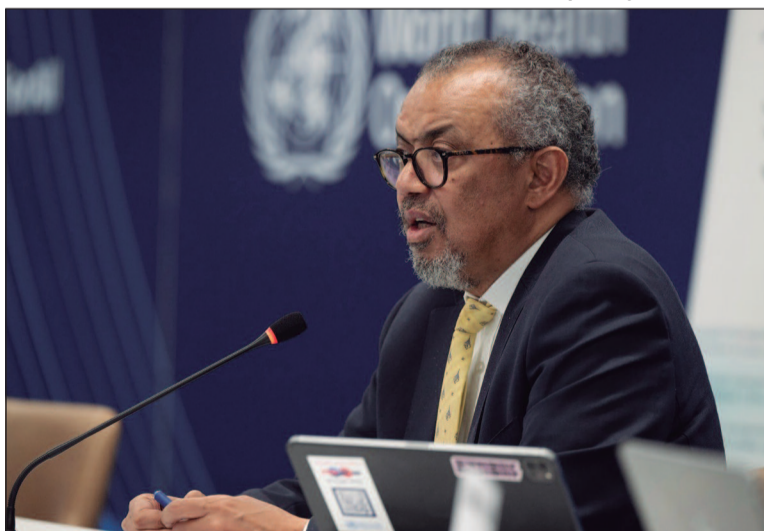
Diretor-geral da OMS demonstra ‘preocupação profunda’ com a velocidade da escalada da epidemia

Entre os fatores que mais preocupam a OMS estão os registros de casos em centros ur-