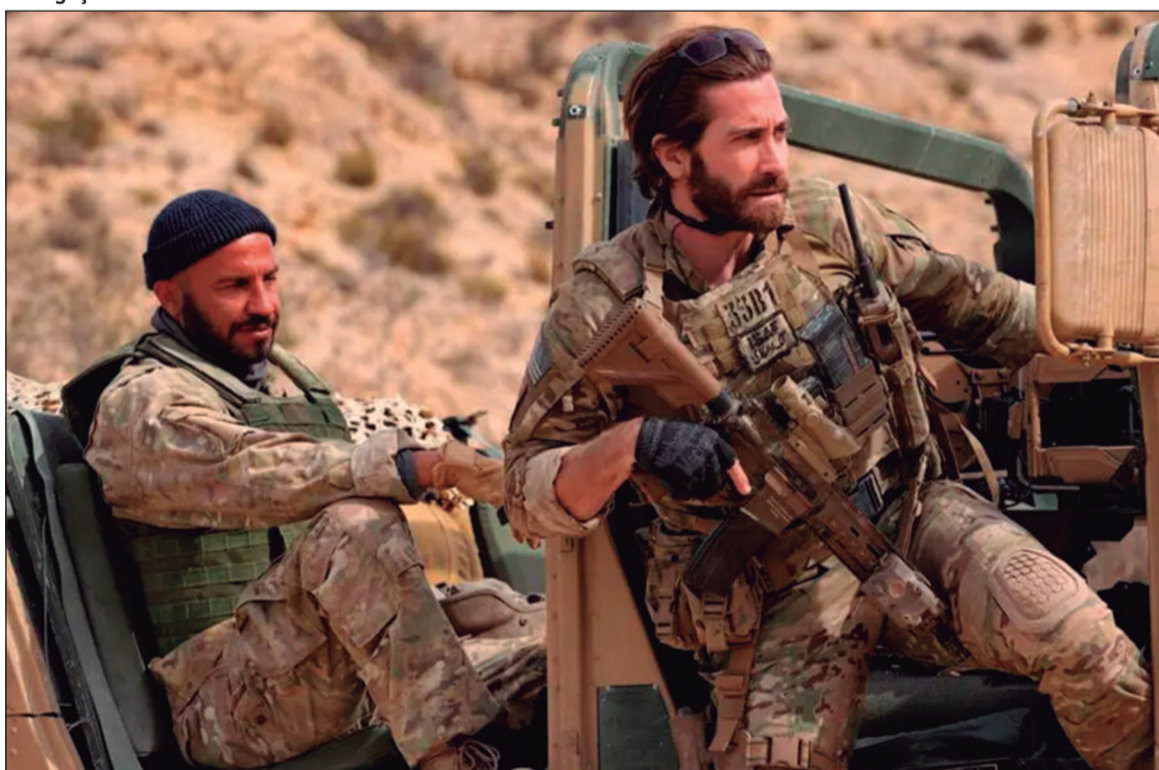
Uma equipe secreta de agentes de elite embarca em uma missão para recuperar uma fortuna de um bilhão de dólares de um tirano implacável em “Na Zona Cinzenta”

Mortal Kombat II (EUA, 2026). Duração: 1h 55min. Direção: