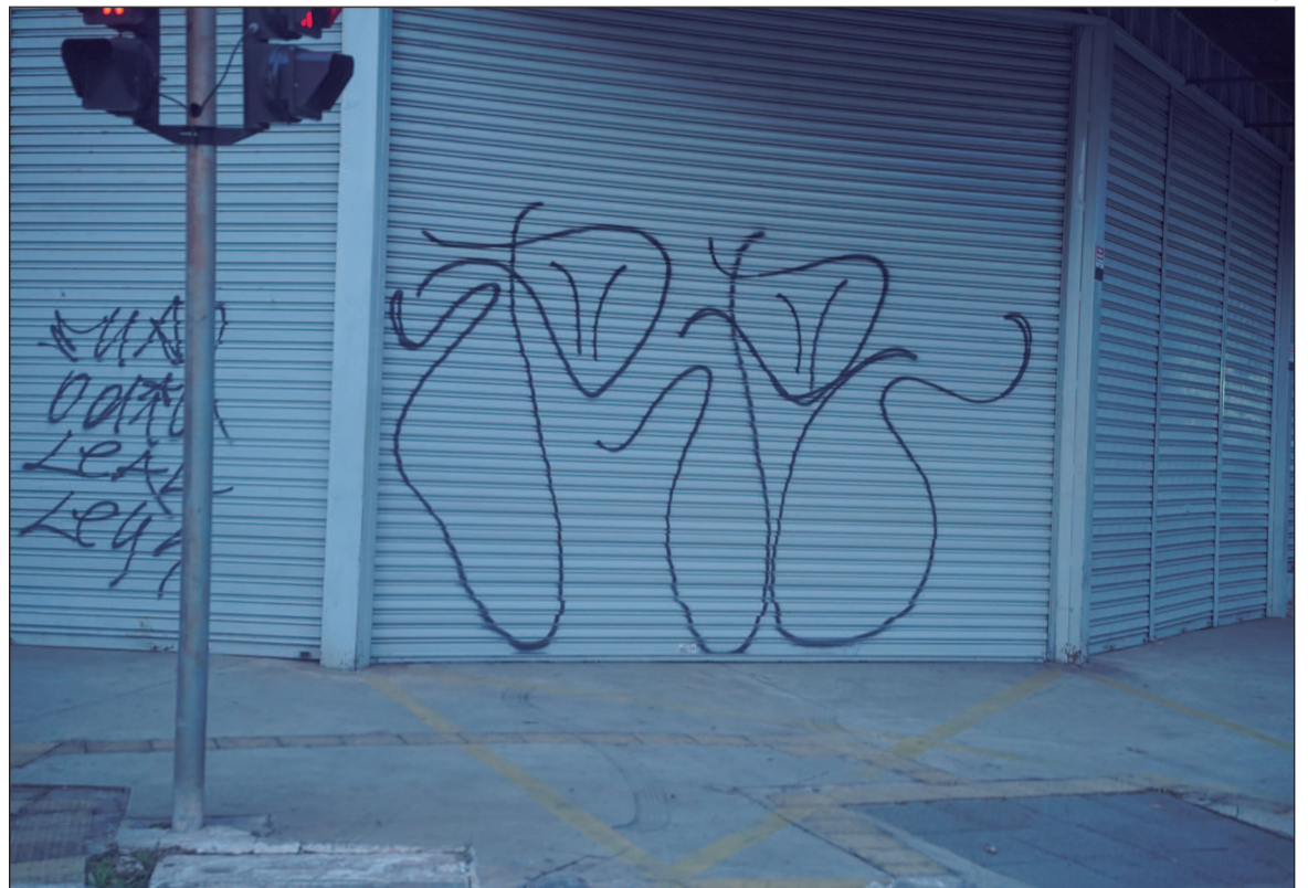
Projetos enviados à Câmara endurecem punições para pichações e descarte irregular de resíduos