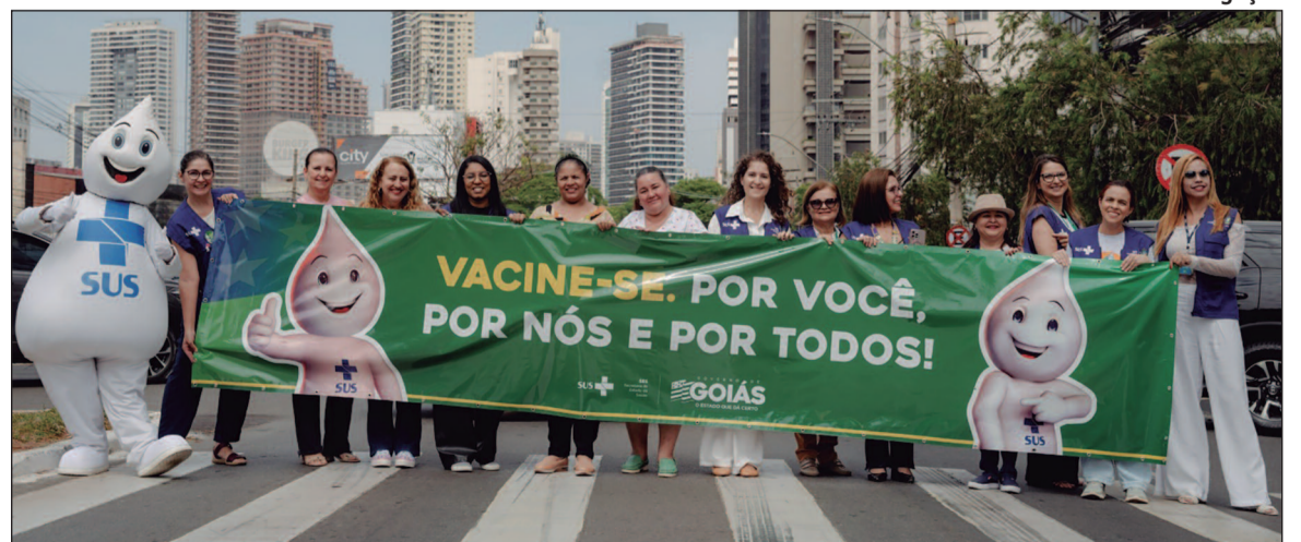
SES promove blitz educativa para reforçar importância da vacina contra Influenza nos grupos prioritários