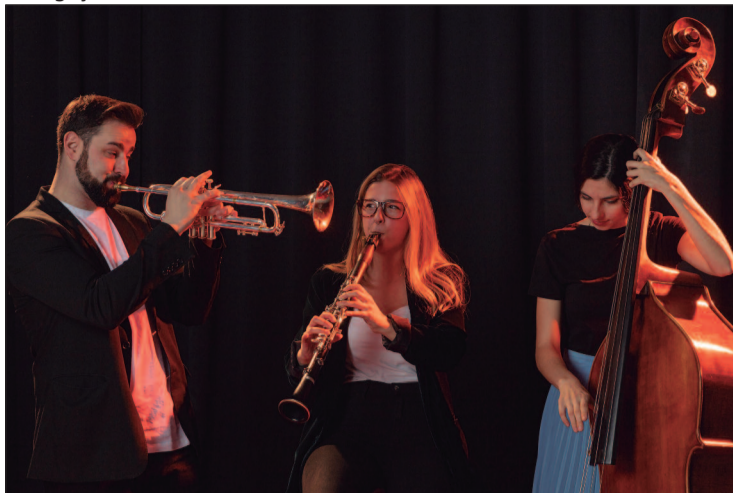
Concerto integra a temporada 2026 do Coro Sinfônico de Goiânia