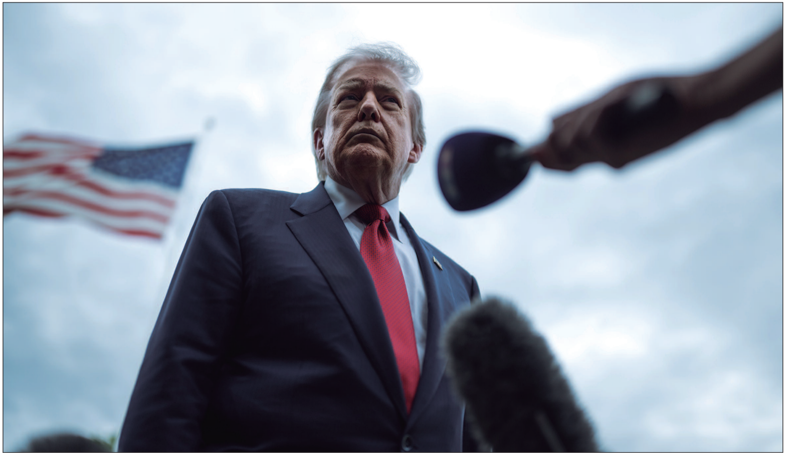
Washington anuncia uma nova rodada de sanções contra o Irã em meio às negociações por um acordo

Durante conversa com jornalistas, o republicano afirmou que o prazo concedido será