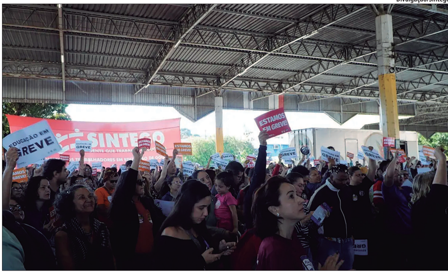
Servidores questionaram condução da votação e protestaram contra dirigentes sindicais durante assembleia

Entre os principais pontos acordados está a criação de um Grupo de Trabalho para construir, em até 30 dias, uma proposta de reestruturação do plano de carreira dos servidores técnico-administrati-