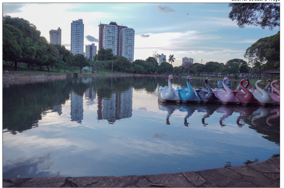
Gabriel Louza/O HOJE