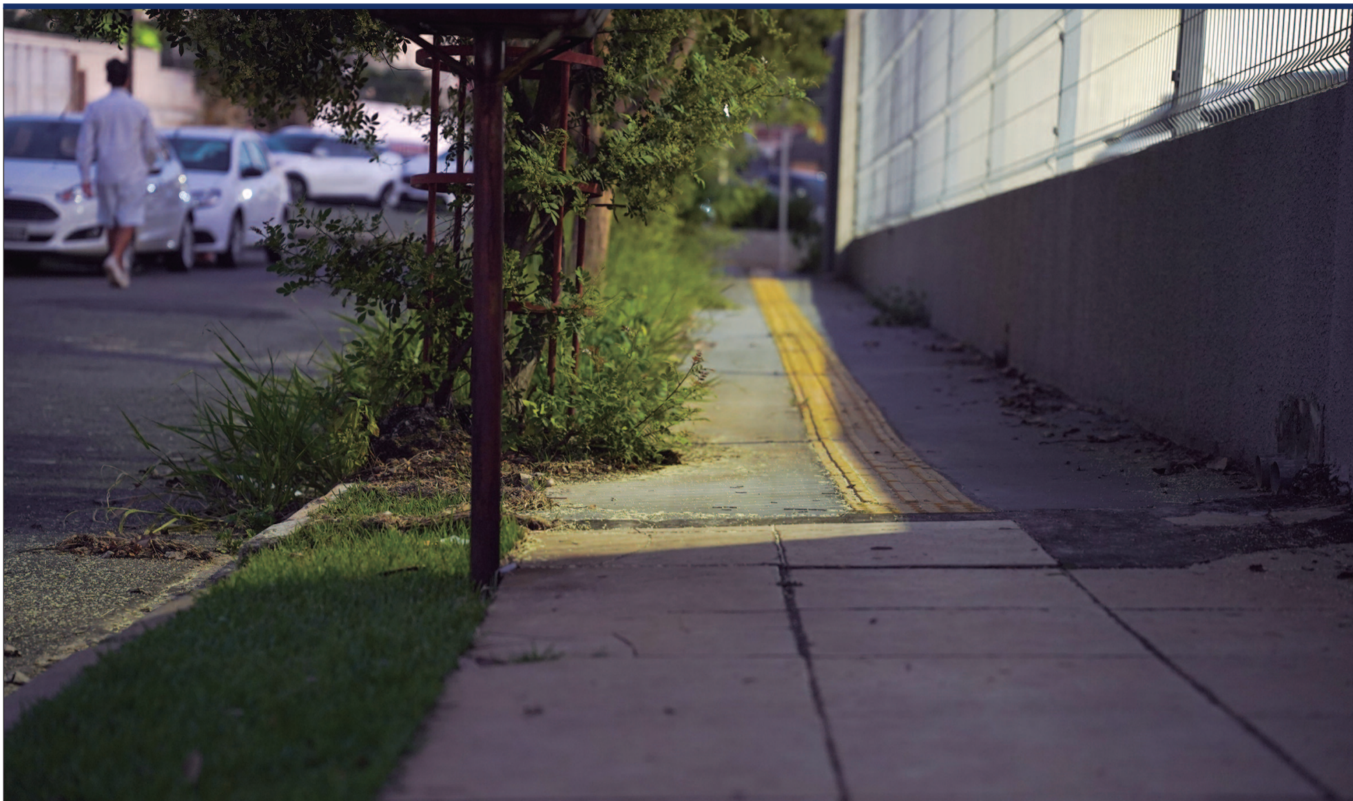
Problemas aumentam o risco de acidentes e comprometem a acessibilidade urbana