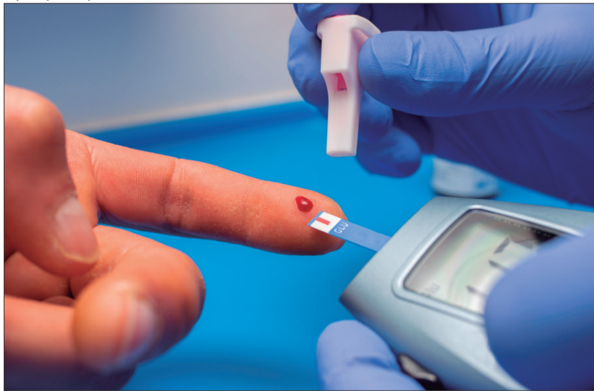
A Jornada da Cidadania já ultrapassou a marca de 3 milhões de atendimentos

Entre os serviços disponíveis para a população estarão avaliação nutricional e antropométrica, vacinação, aferição de sinais vitais, testes rápidos e avaliação de risco cardiovascular. Também serão realizadas orientações sobre alimen-