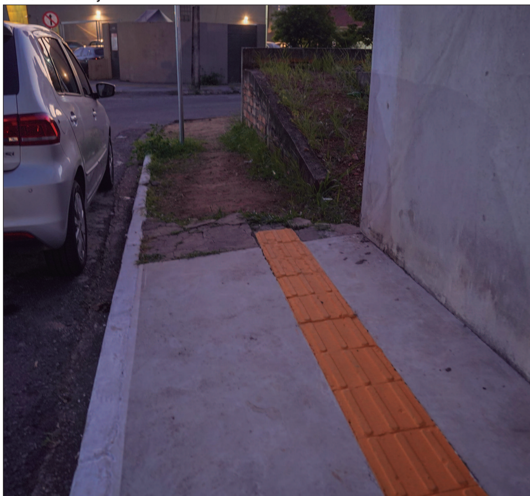
Falhas na instalação, falta de continuidade e sinalização dificultam a mobilidade