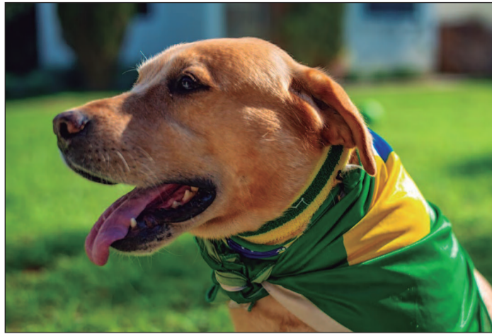
Cães e gatos podem se assustar com fogos, gritos e movimentação durante os jogos da Copa