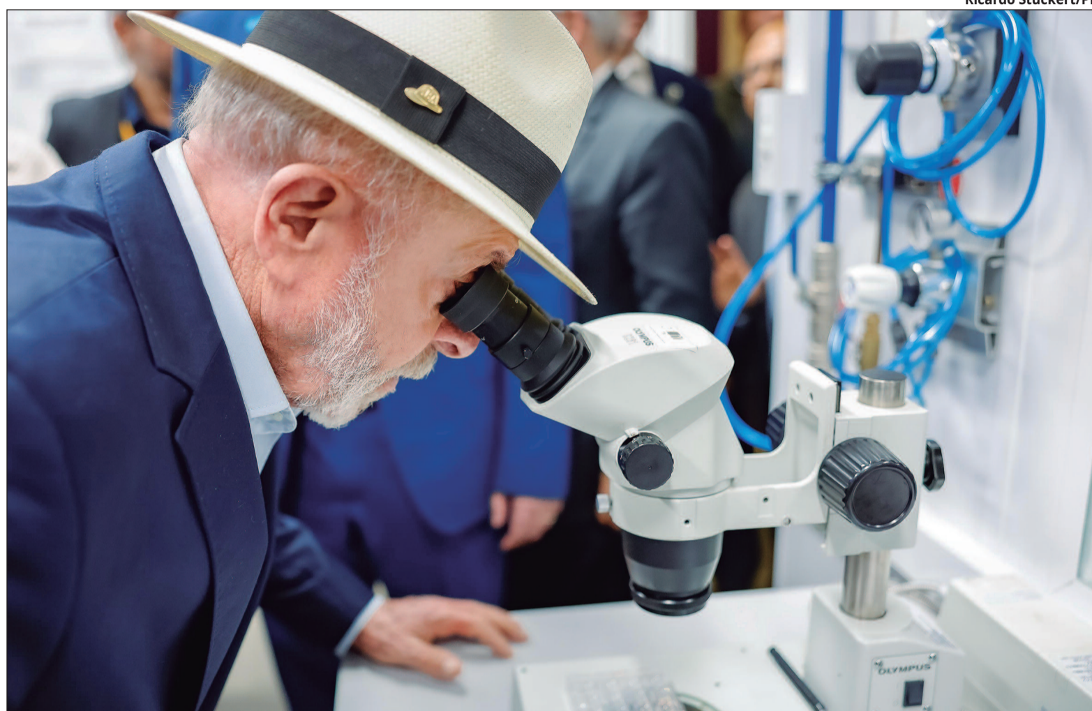
“A única coisa que associa o feito ao presidente Lula é uma pequena logo no canto da placa fincada no canteiro de obra”, reclamou Delúbio

Na mesma pesquisa em que buscava a lista de construções para as quais Lula mandou recursos, foi possível ver que