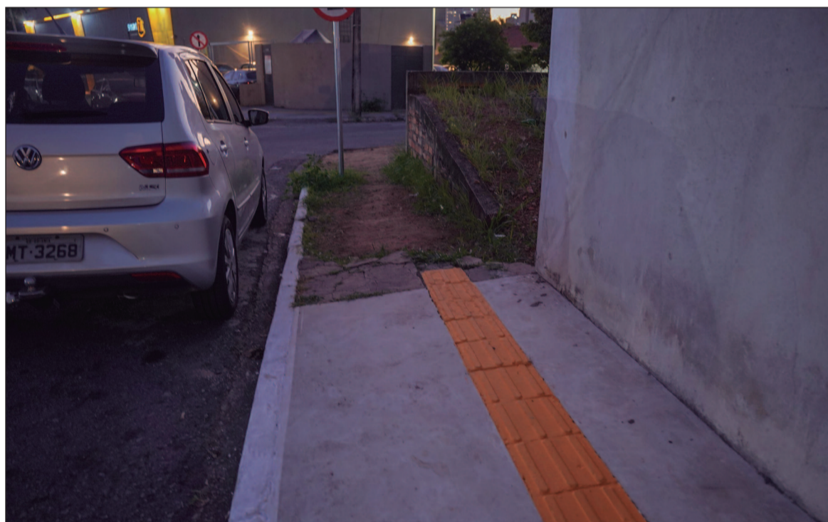
Falhas na instalação, falta de continuidade nas calçadas e ausência de sinalização adequada dificultam a mobilidade