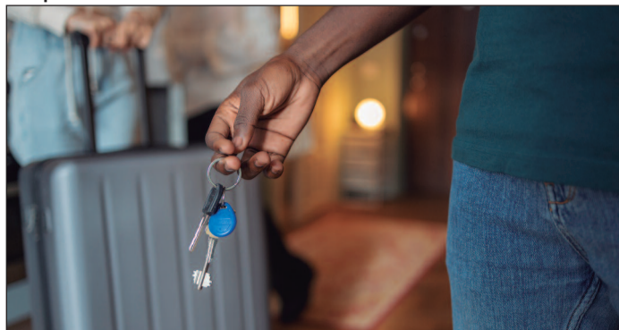
Avanço do short stay (locação de curta duração) em Goiânia reforça debate sobre os efeitos da medida