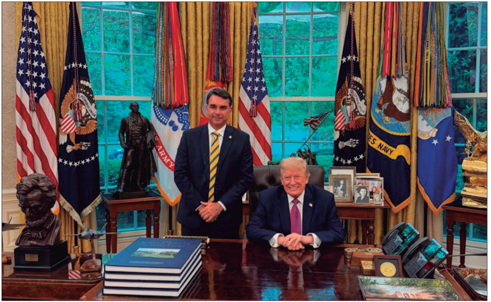
Trump não comentou a reunião e, segundo Flávio, o republicano não declarou apoio à sua pré-candidatura

A visita ocorreu um dia depois de Flávio desembarcar nos Estados Unidos acompanhado de uma comitiva for-