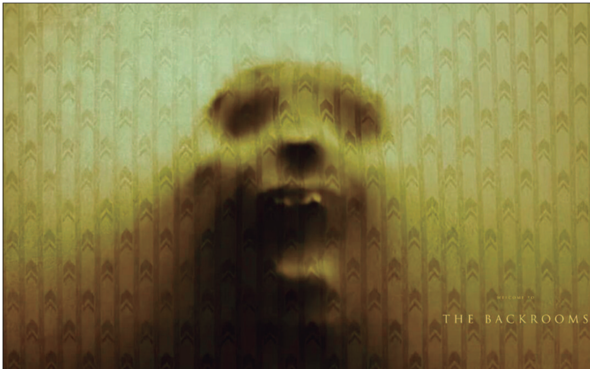
Acompanhando Clark (Chiwetel Ejiofor), um vendedor de móveis, a história toma rumo quando ele faz uma descoberta perturbadora do porão de sua loja em “Backrooms: Um Não-Lugar”

Michael (EUA, 2026). Duração: 2h10min. Gênero: Biografia/Drama. Cinemark Flamboyant: sábado, 12h45, 15h35, 18h25 e 21h15; domingo, 12h30, 15h30, 18h35 e 21h45; sexta-feira, 14h45, 17h45 e 21h; quinta-feira, 15h50; segunda e terça, 15h50 e 21h15; quarta-feira, 15h15, 18h35 e 21h30.