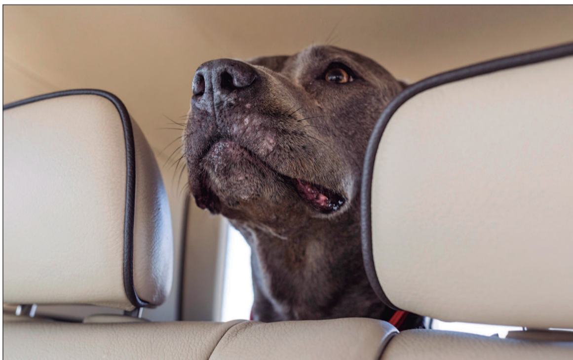
Alguns pets apresentam desconforto, náuseas e agitação

O comportamento do pet durante a viagem também merece atenção. Enquanto alguns animais costumam dormir, outros ficam mais inquietos ou desconfortáveis, principalmente os de porte grande. A veterinária