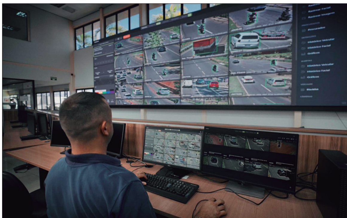
Investimentos em tecnologia e análise de dados ajudaram forças de segurança a antecipar ações criminosas no Estado

Entre os fatores apontados para a redução da violência está a mudança estrutural no modelo de segurança pública adotado em Goiás nos últimos