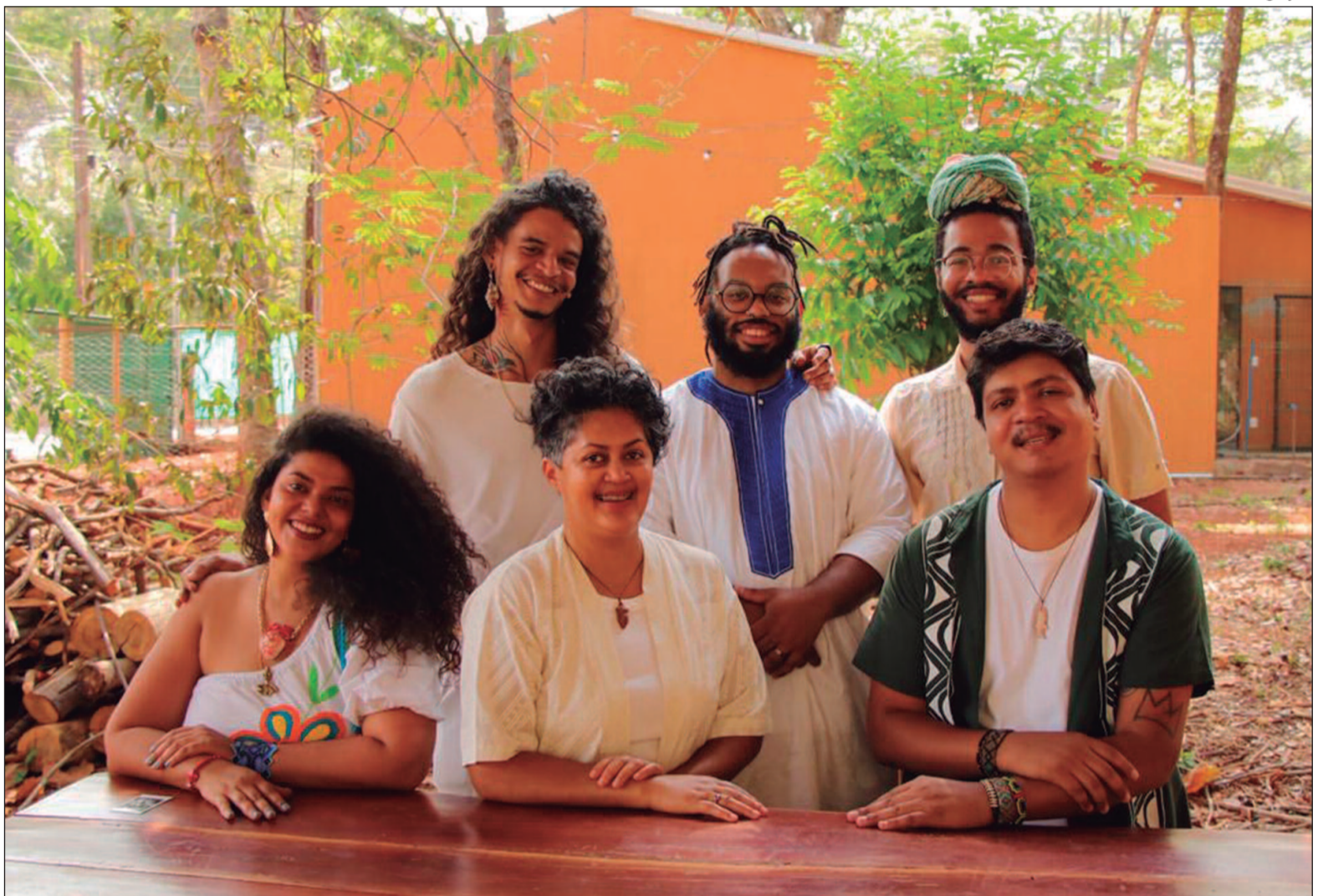
Ateliê aberto apresentou ao público obras e processos de seis artistas visuais

O modelo tem apoio de dez cotas adquiridas por colecionadores, que receberão obras dos artistas ao longo de até cinco anos. O recurso ajuda a