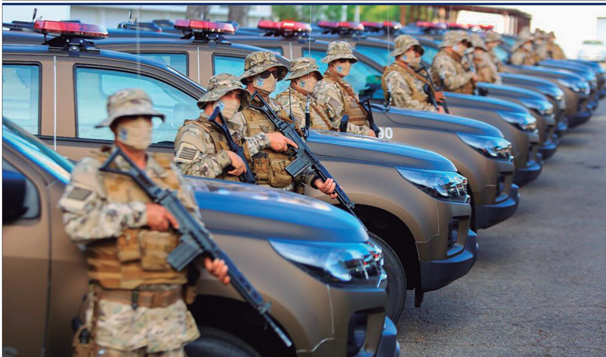
Integração entre polícias é apontada como um dos principais fatores para redução dos homicídios