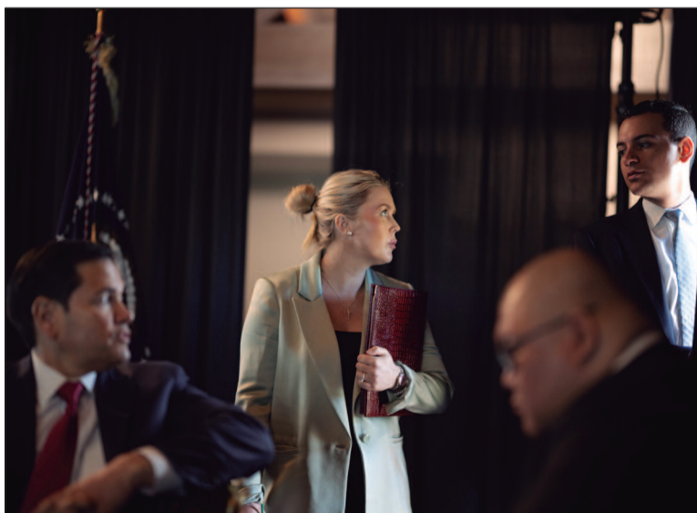
Mídia estatal iraniana divulgou um documento que detalha o possível acordo entre as nações

O texto também atribuiria ao Irã, em cooperação com Omã, a responsabilidade pela administração e definição das rotas marítimas no estreito, uma das áreas estratégicas mais importantes para o comércio global de petróleo. Ainda de acordo com a reportagem, caso as negociações sejam concluídas em até 60 dias, o pacto poderá ser transformado em resolução vinculativa do Conselho de Segurança da ONU.