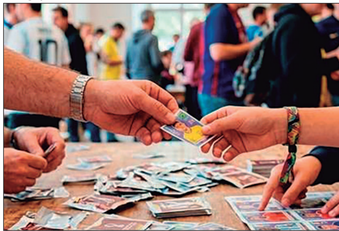
Colecionar e trocar figurinhas ativa funções cognitivas em crianças e adultos