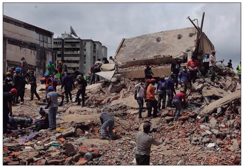
Operações de resgate continuam em ritmo intenso, com bombeiros, militares e voluntários para localizar sobreviventes

Paralelamente ao balanço oficial, uma plataforma colaborativa criada para reunir informações sobre desaparecidos ultrapassou 50 mil registros. A ferramenta vem sendo abastecida por familiares, amigos e voluntários em busca de notícias sobre vítimas que ainda não foram localizadas.