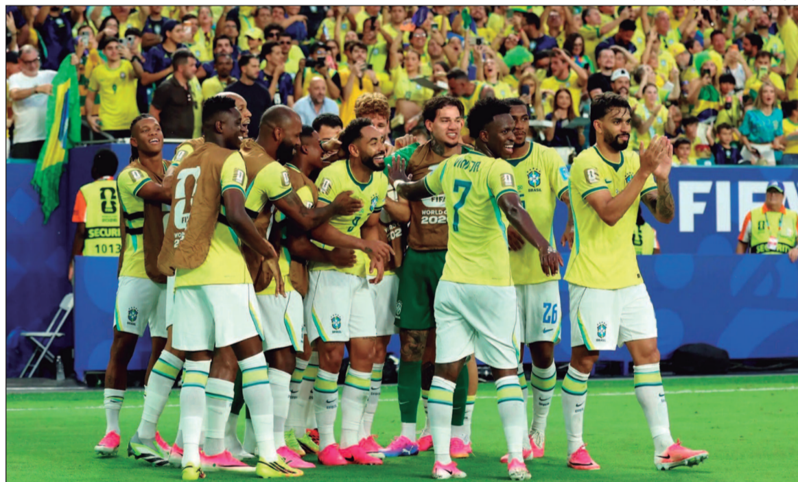
Após utilizar 38 jogadores diferentes como titulares em 15 partidas, técnico Carlo Ancelotti deve repetir pela primeira vez a escalação da Seleção Brasileira no duelo contra o Japão