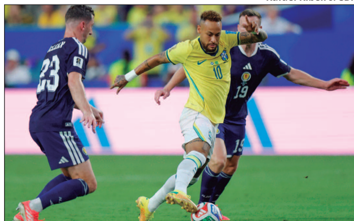
Recuperado de lesão, Neymar pode ganhar mais minutos diante do Japão nas segunda fase da Copa do Mundo