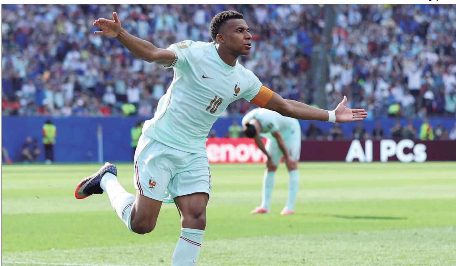
Kylian Mbappé foi decisivo mais uma vez e comandou a classificação da França

Do outro lado, o Marrocos encerra sua participação com mais uma campanha histórica. A equipe africana tornou-se a primeira seleção do continente a alcançar as quartas de final em duas edições consecutivas do Mundial, conso-