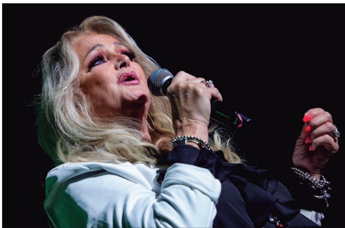
Artista marcou o pop com baladas grandiosas, carreira de cinco décadas e show único em Goiânia

O nome artístico surgiu no início da carreira fonográfica. Antes de se tornar Bonnie Tyler, ela chegou a usar o nome Sherene Davies. A gravadora RCA, que tinha Elvis Presley em seu catálogo, sugeriu a mudança. A cantora contou,