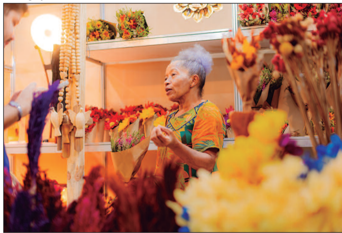
Artesãos apresentam peças que destacam a biodiversidade do Cerrado