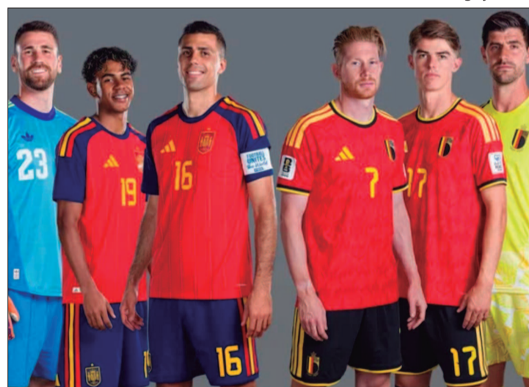
Quem avançar enfrentará a França, que derrotou Marrocos na outra eliminatória do chaveamento para as semifinais

Do outro lado, a Bélgica chega confiante após uma atuação dominante diante dos Estados Unidos. Os belgas venceram por 4 a 1 e garantiram