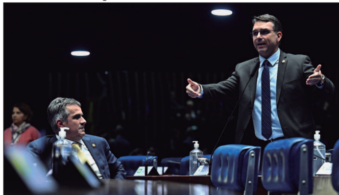
Desgaste na relação entre o pré-candidato e Ciro Nogueira seria o pivô da insatisfação