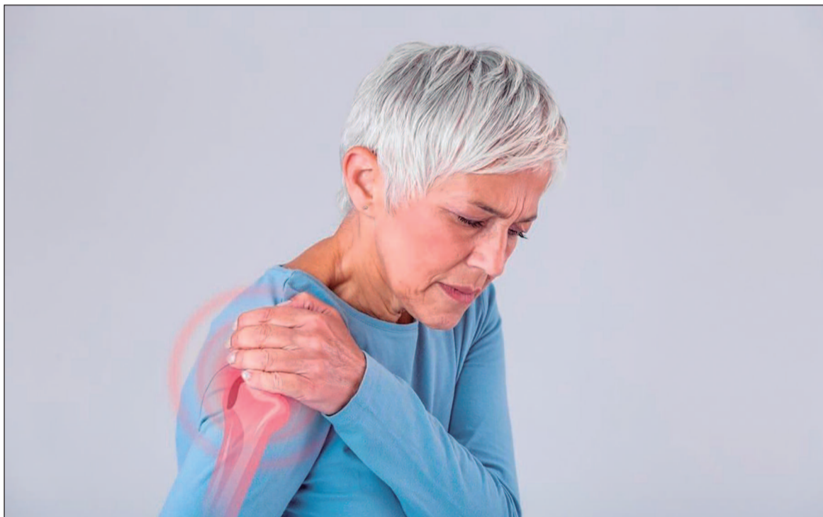
O principal ponto de debate após a sanção foi o veto aos artigos 3º, 4º e 5º da proposta

A dor é considerada crônica quando persiste por mais de três meses. Especialistas apontam que a condição está entre