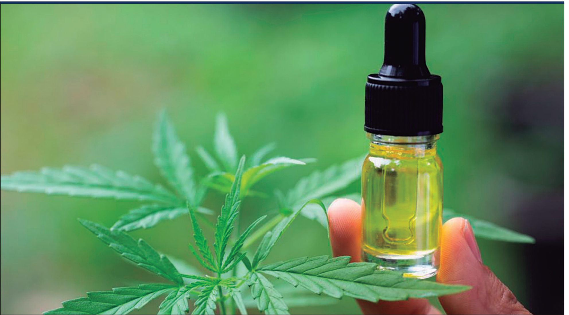
A dor é considerada crônica quando persiste por mais de três meses