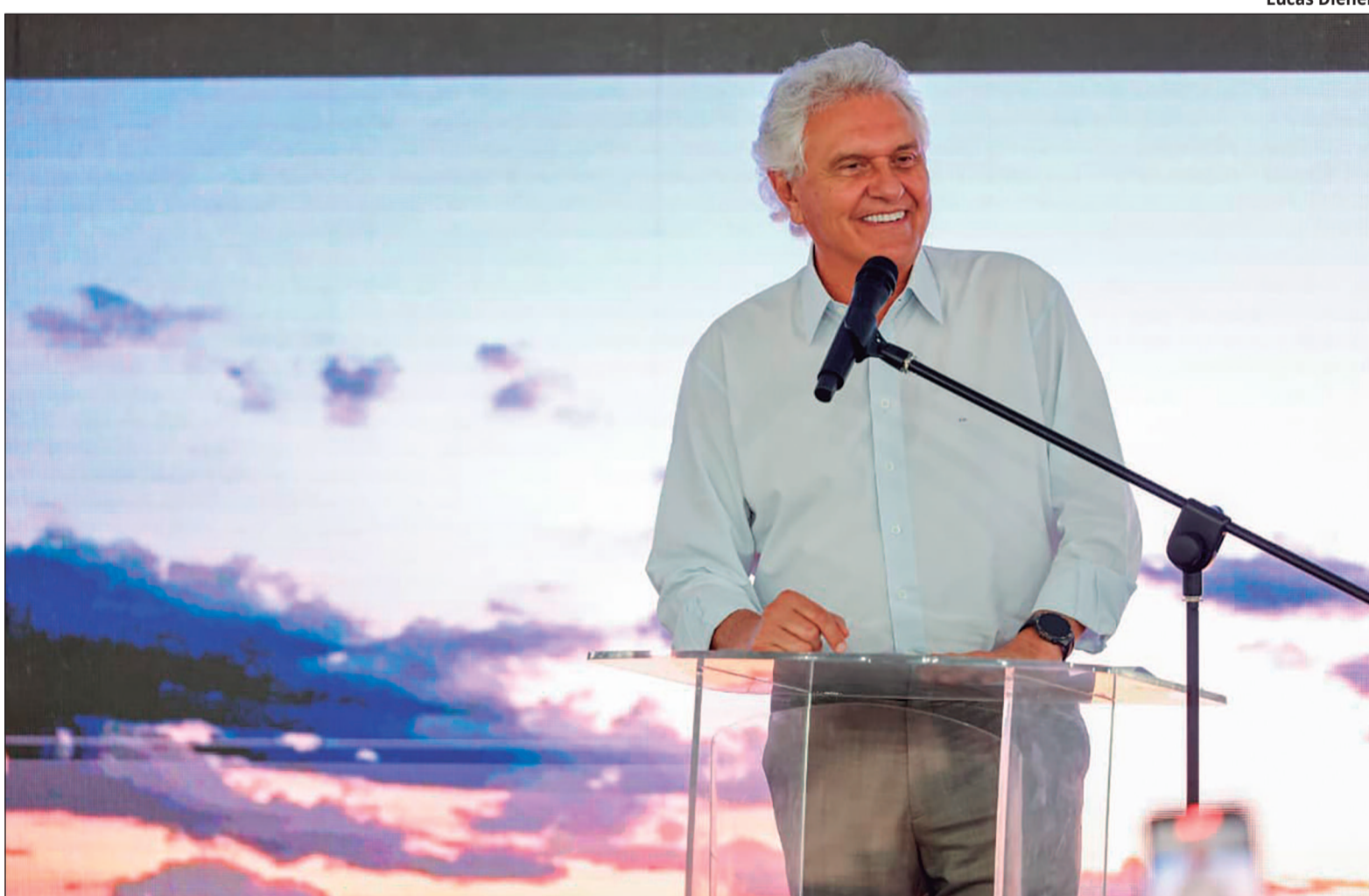
Ex-governador de Goiás voltou a defender que o País amplie a produção de energia, fertilizantes e minerais críticos

O pré-candidato do PSD à Presidência da República, Ronaldo Caiado, afirmou nesta quinta-feira (9) que o Brasil precisa investir em setores estratégicos para reduzir sua vulnerabilidade diante de crises geopolíticas internacionais. Durante agenda no Rio de Janeiro, o ex-governador de Goiás voltou a defender que o País amplie a produção de energia, fertilizantes e minerais críticos, além de estimular a inovação tecnológica. Na ocasião, também criticou o governo federal e declarou que o Brasil não deveria depender dos impactos provocados por eventuais restrições no Estreito de Ormuz. Segundo Caiado, a falta de